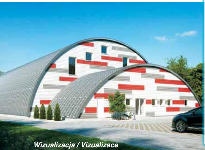
Wizualizacja / Vizualizace

Hrádek to gmina z idealnymi warunkami do uprawiania najróżnorodniejszych sportów. Możliwości ich uprawiania stale są poszerzane. Niektóre zawody sportowe w Hrádku mają długoletnią tradycję.