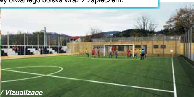
Wizualizacja / Vizualizace