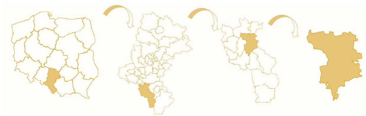
Rysunek 1 Położenie Gminy Skoczów na tle kraju, województwa śląskiego i powiatu cieszyńskiego.

Gmina Skoczów to gmina miejsko-wiejska położona w południowej części województwa śląskiego, w powiecie cieszyńskim. Gmina Skoczów od wschodniej strony graniczy z gminą Jasienica, w powiecie bielskim. Od południowej strony sąsiednimi gminami są: Brenna oraz Ustroń, od południowego zachodu Golezów, od północnej strony jest to gmina Chybie, natomiast od północno-zachodniej gmina Strumięń. Gmina Skoczów od zachodu graniczy z gminą Dębowiec.