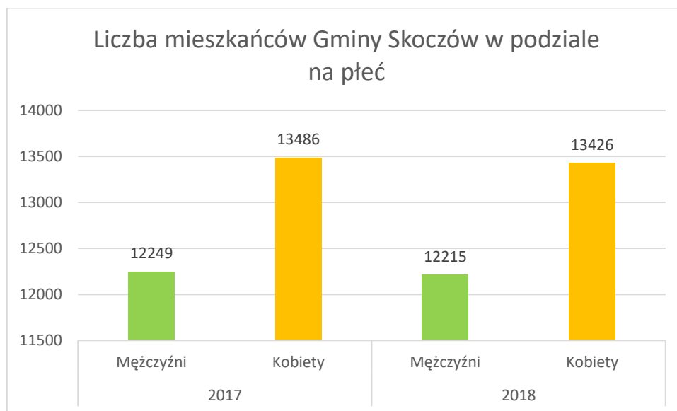
Rysunek 2 Liczba mieszkańców Gminy Skoczów w podziale na płeć w latach 2017-2018.

Źródło: opracowanie Grupa CDE Sp. z o.o. na podstawie danych Urzędu Miejskiego w Skoczowie.