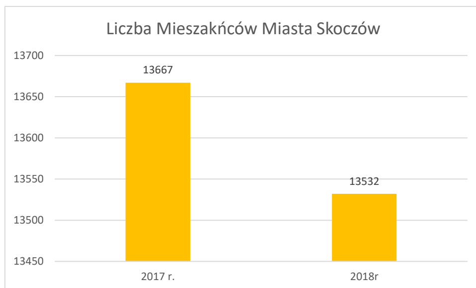
Rysunek 4 Liczba mieszkańców w mieście Skoczów w latach 2017-2018.

Źródło: opracowanie Grupa CDE Sp. z o.o. na podstawie danych Urzędu Miejskiego w Skoczowie.