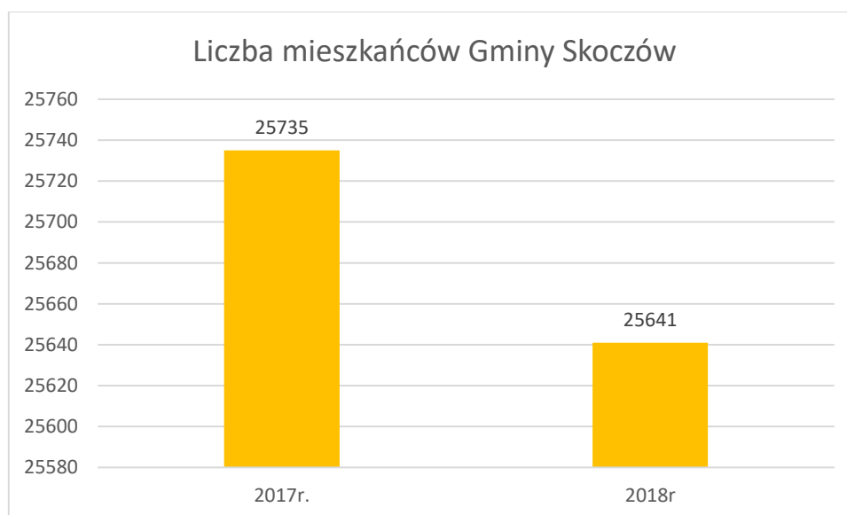
Rysunek 3 Liczba mieszkańców Gminy Skoczów w latach 2017-2018.

Źródło: opracowanie Grupa CDE Sp. z o.o. na podstawie danych Urzędu Miejskiego w Skoczowie.