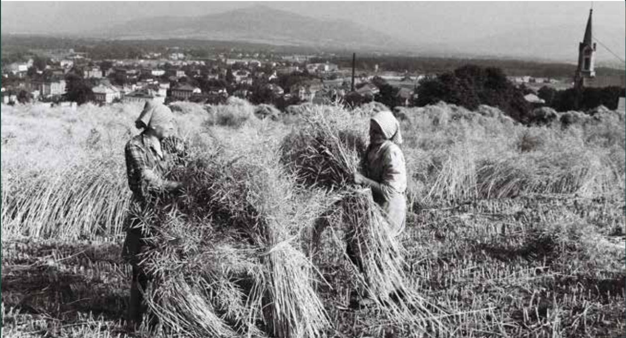
Żniwa na Kaplicówce – stawianie snopków, 1963 rok