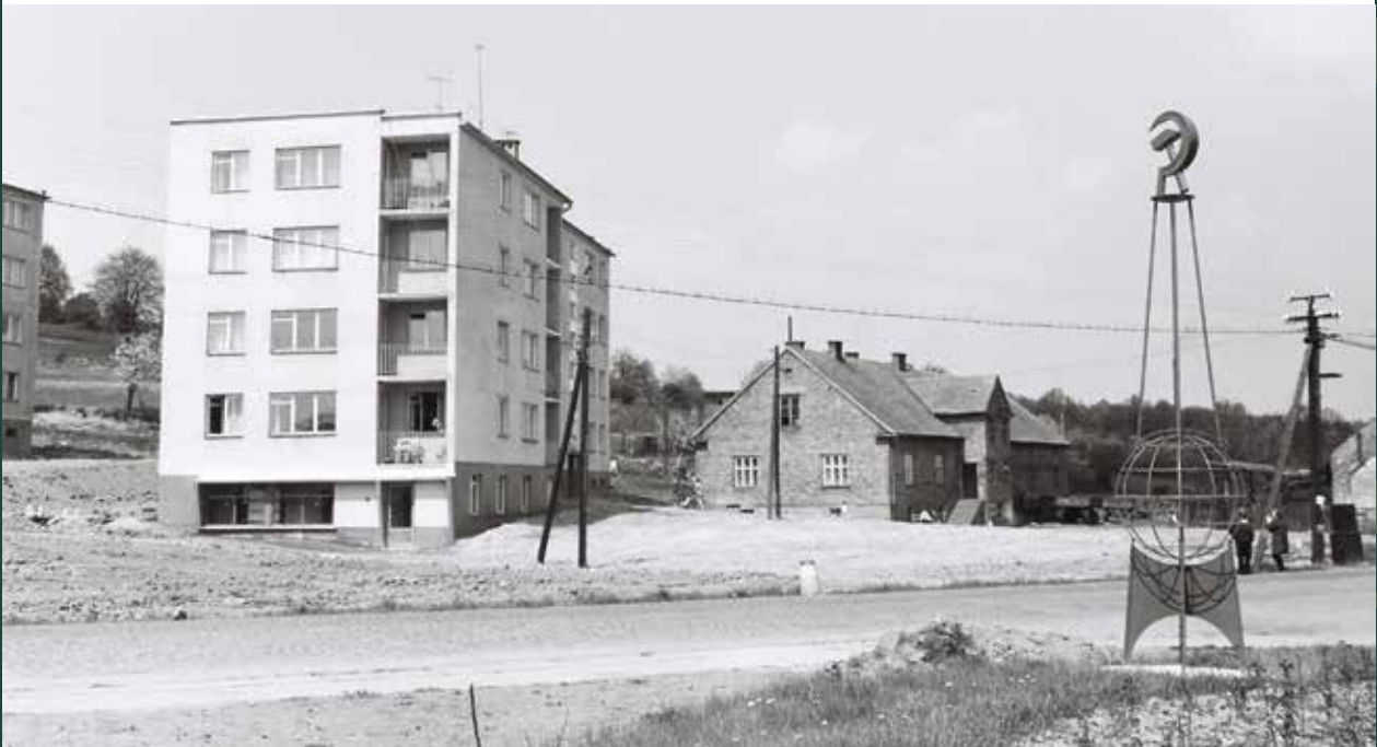
Ulica Objazdowa – nowe bloki Spółdzielni Mieszkaniowej „Wspólnota” u podnóża Kaplicówki, 1967 rok