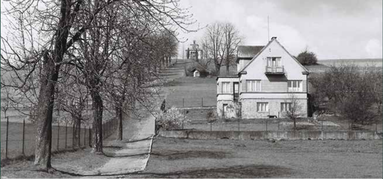
Aleja na Kaplicówkę prowadząca do kaplicy św. Jana Sarkandra, 1961 rok