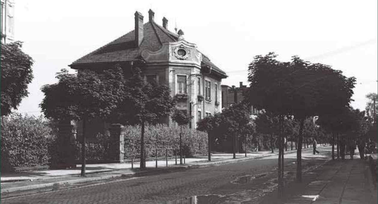
Ulica Mickiewicza w stronę dworca kolejowego, 1958 rok