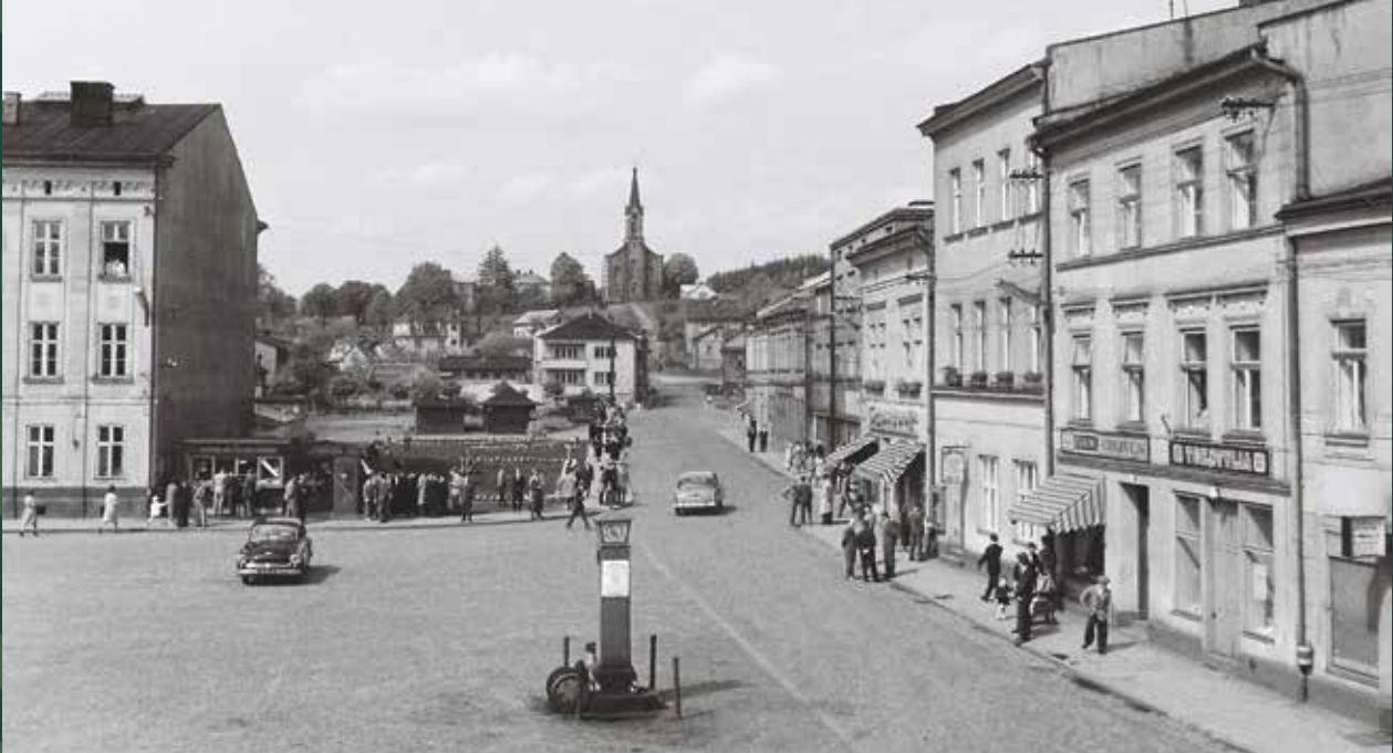
Rynek – widok na ulicę Cieszyńską i kościół ewangelicki Świętej Trójcy, 1962 rok