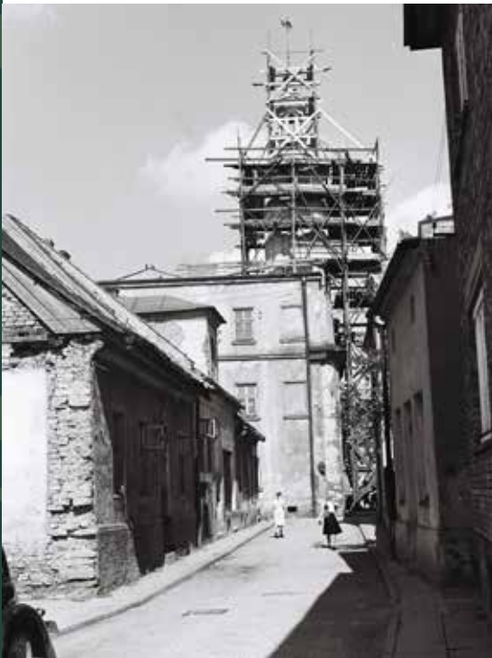
Ulica Mennicza – remont Ratusza, 1956 rok