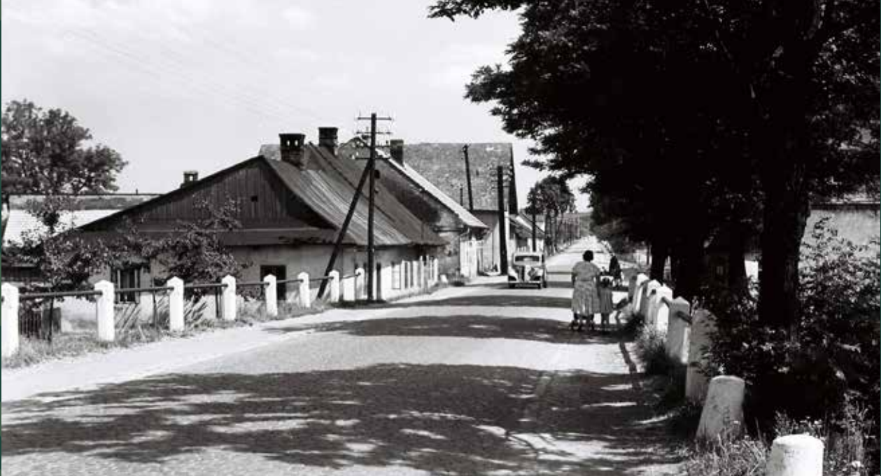
Zabawa, ulica Bielska w stronę Pogórza, 1957 rok