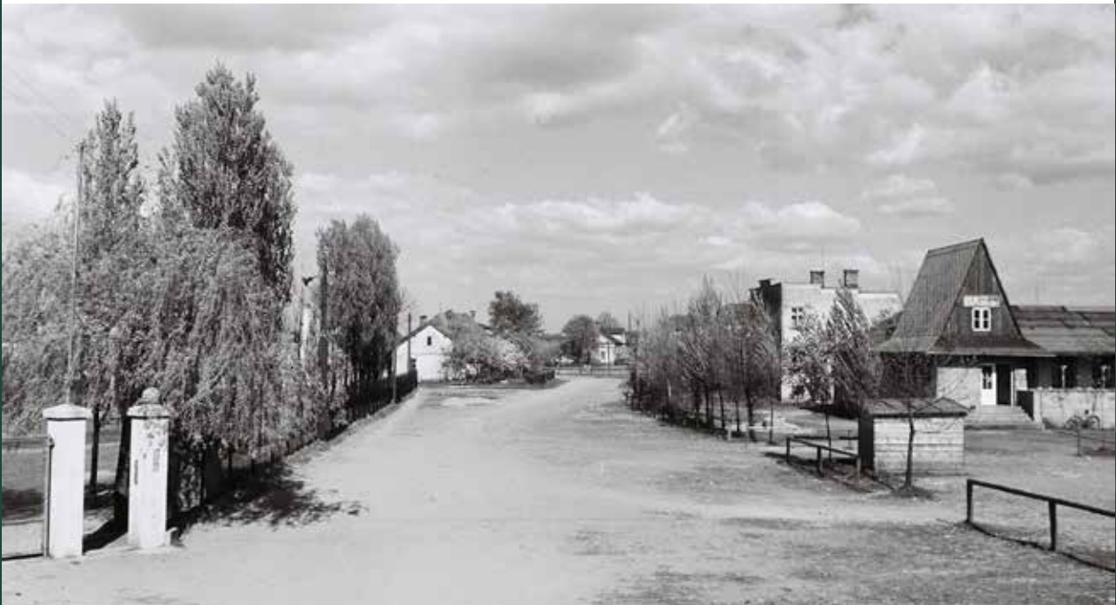
Ulica Sportowa – po prawej restauracja „Strzecha”, 1959 rok