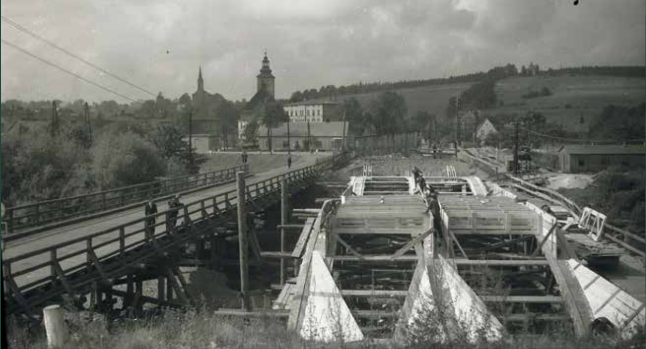
Budowa nowego mostu drogowego na Wiśle, 1959 rok