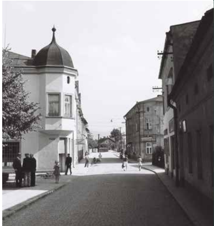
Ulica Ustrońska od Rynku w stronę mostu na rzece Bładnicy, 1961 rok