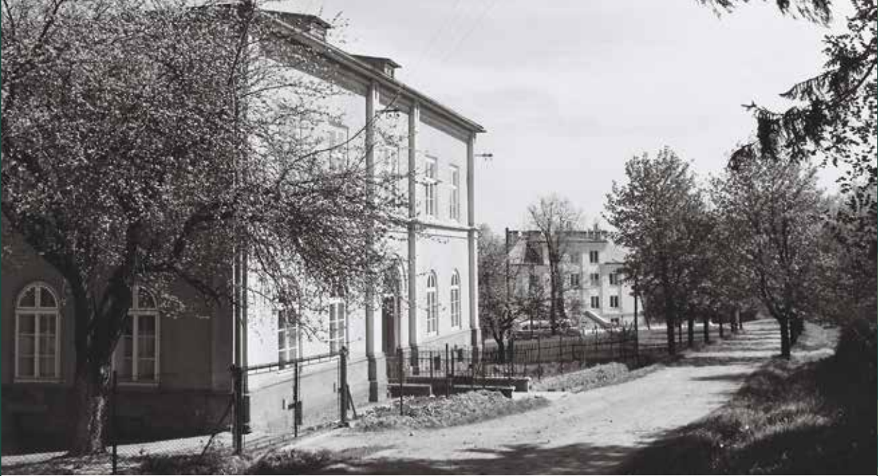
Dawna szkoła ewangelicka „Na Kępie”, 1960 rok