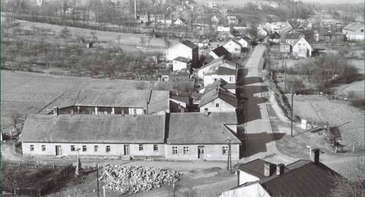
Widok z wieży kościoła katolickiego na ulicę Stalmacha i Groszówkę, 1967 rok