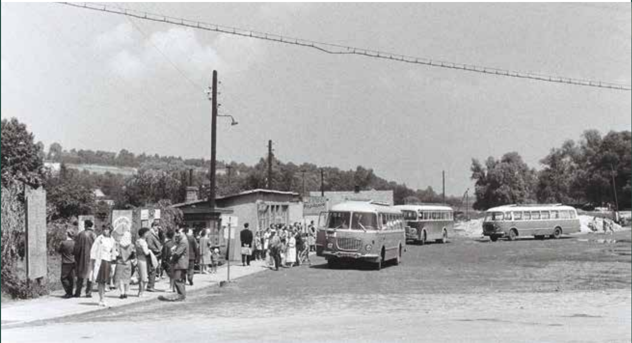
Dworzec autobusowy (PKS) przy ulicy Bielskiej i Katowickiej, 1964 rok