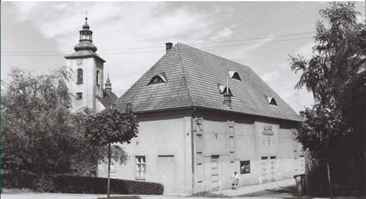
Kino „Podhale” przy ulicy Mickiewicza, 1965 rok