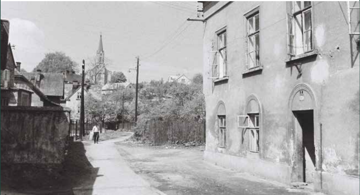
Ulica Szpitalna, 1964 rok