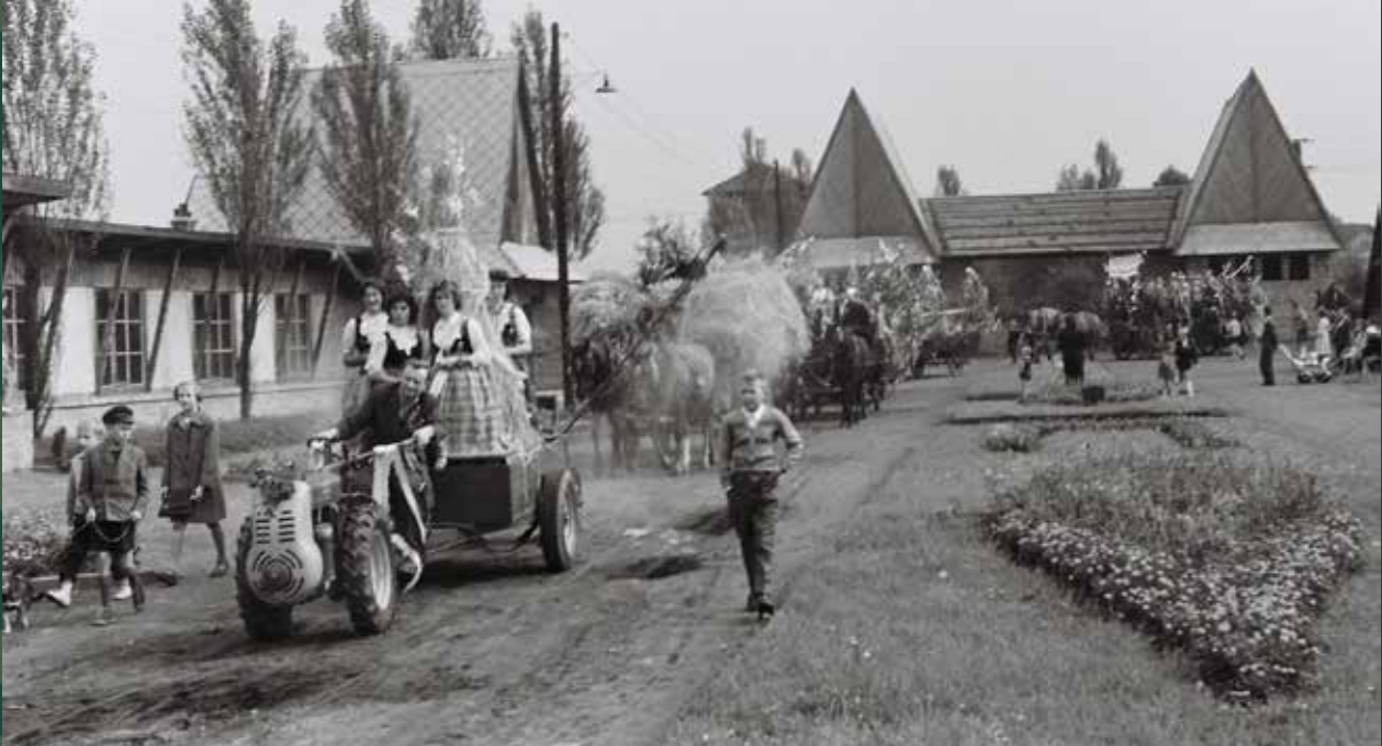
Pochód dożynkowy przed amfiteatrem, 1960 rok