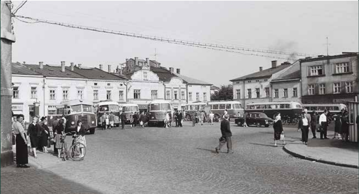
Widok z ulicy Cieszyńskiej na Rynek i dworzec autobusowy, 1962 rok