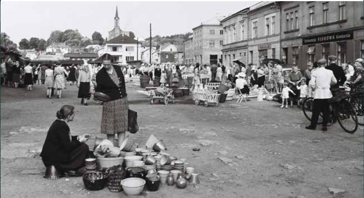
Targ na Małym Rynku – I Dni Skoczowa, 1967 rok