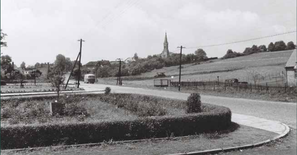
Ulica Objazdowa – po prawej niezabudowana Kaplicówka, 1963 rok