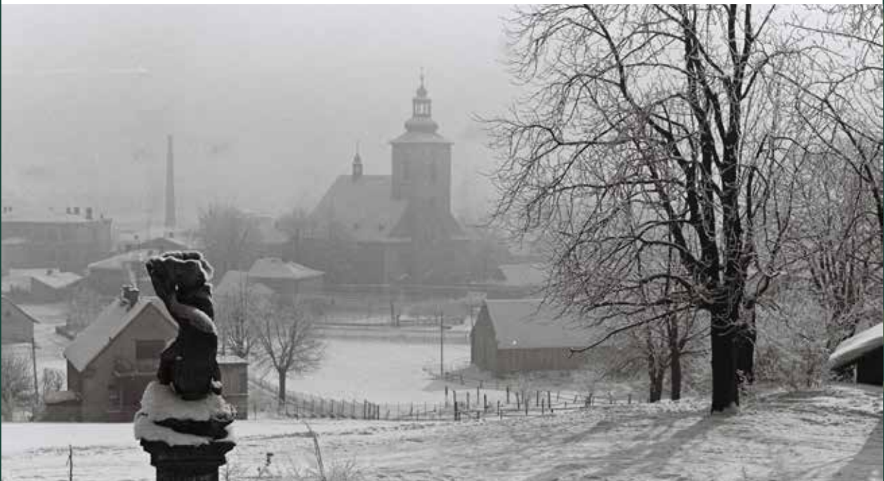
Figura Neptuna na Kaplicówce, 1956 rok