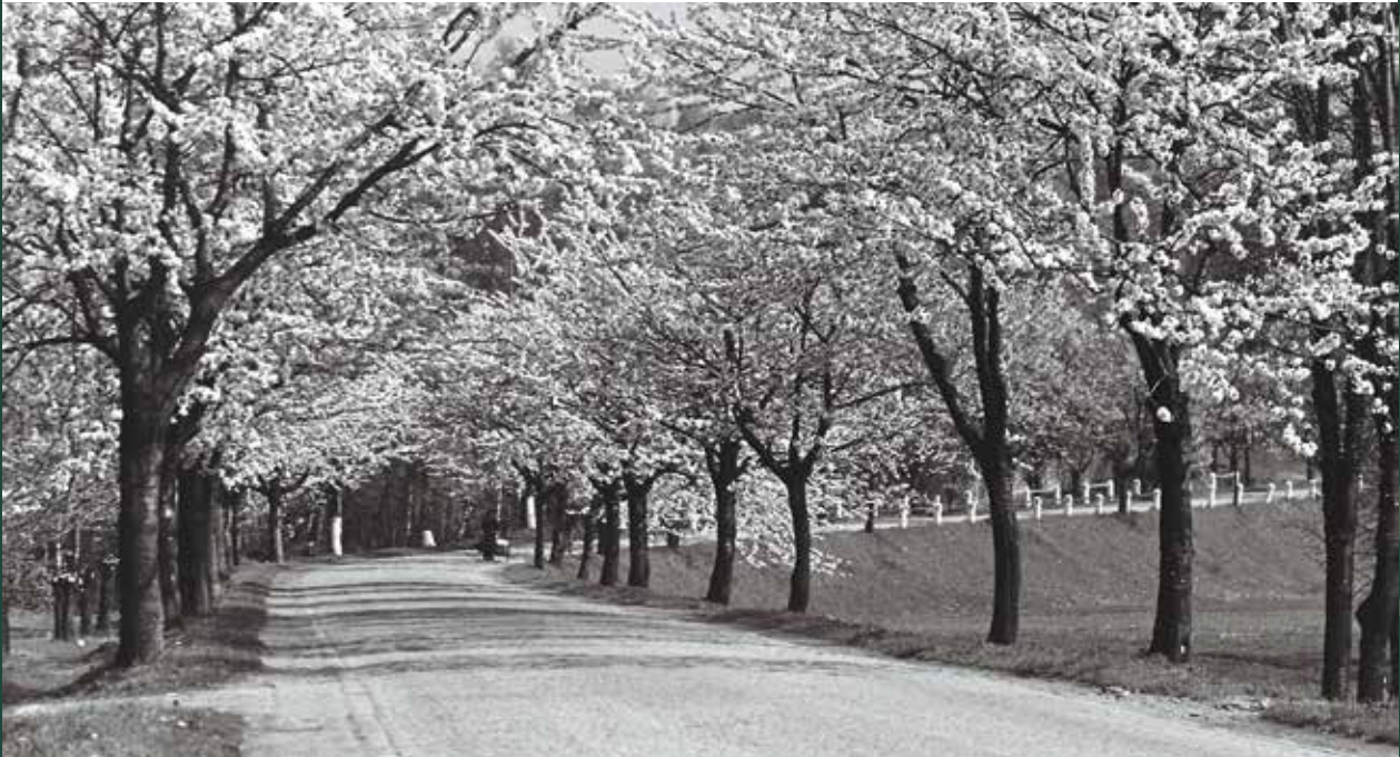
Ulica Katowicka, w kierunku na Katowice, z rzędami czereśni, 1958 rok