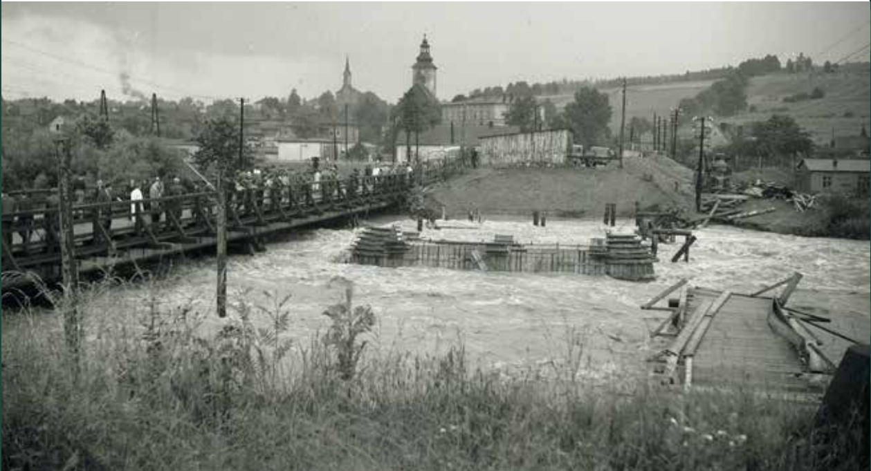
Zniszczenia nowo budowanego mostu drogowego na Wiśle podczas powodzi, 1959 rok