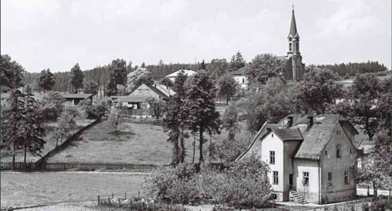
Widok na kościół ewangelicki Świętej Trójcy z ulicy Łęgowej, 1956 rok