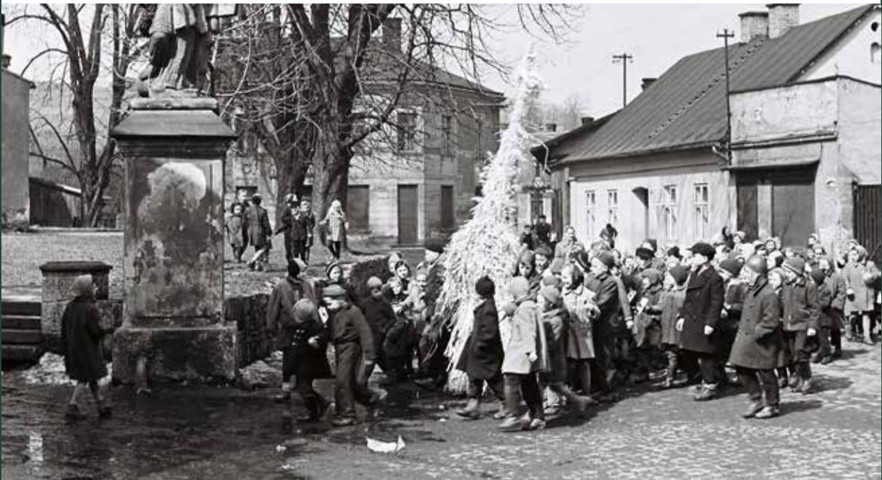
Pochód z „Judoszem”, ulica Kościelna, 1957 rok