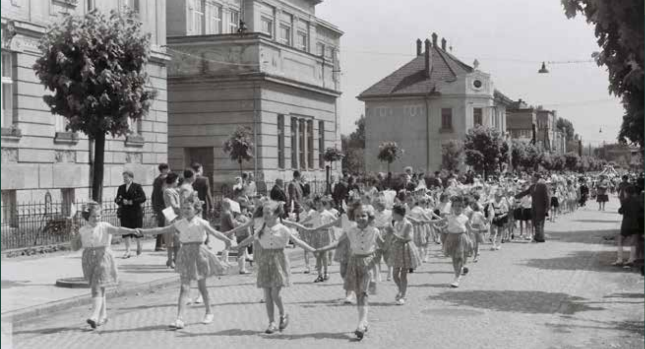
Pochód dzieci na festyn szkolny na ulicy Mickiewicza, 1961 rok