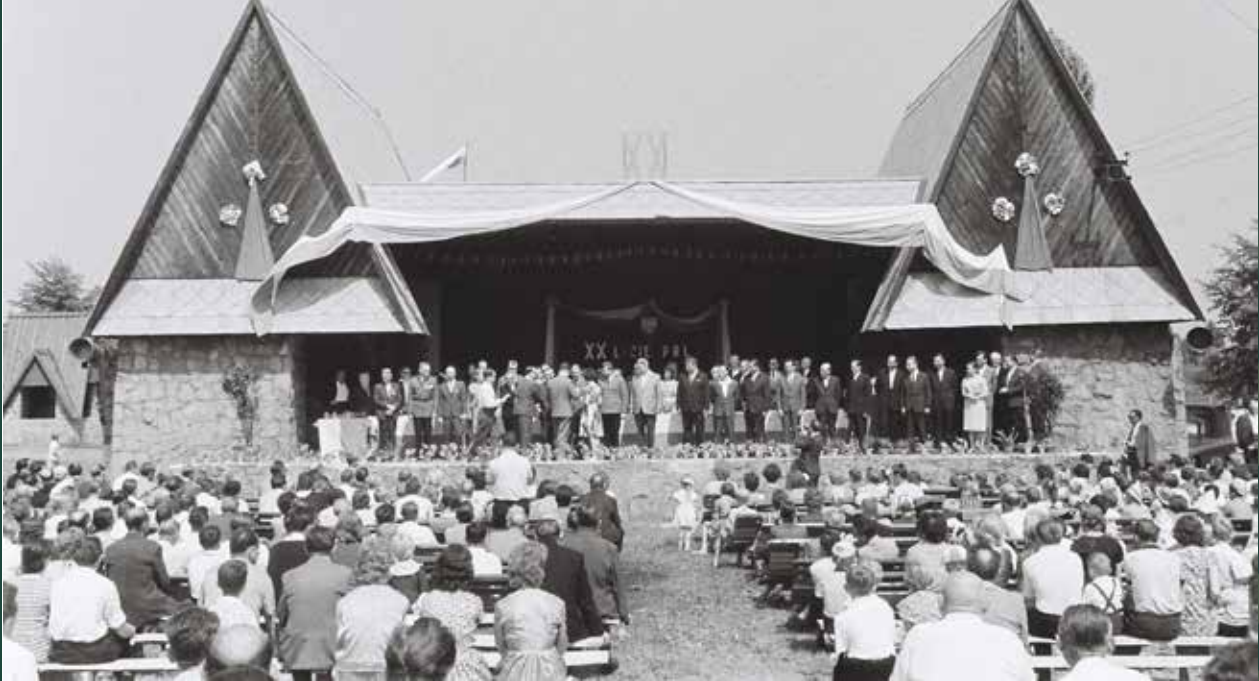
Obchody 20-lecia PRL w amfiteatrze w parku „Nad Wisłą”, 1964 rok