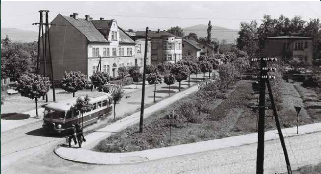
Widok na ulicę Mickiewicza i drogę na Górny Bór (widok z Domu Pomocy Społecznej Caritas), 1963 rok