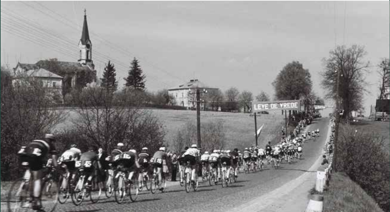
XIII Wyścig Pokoju na ulicy Cieszyńskiej, 1960 rok