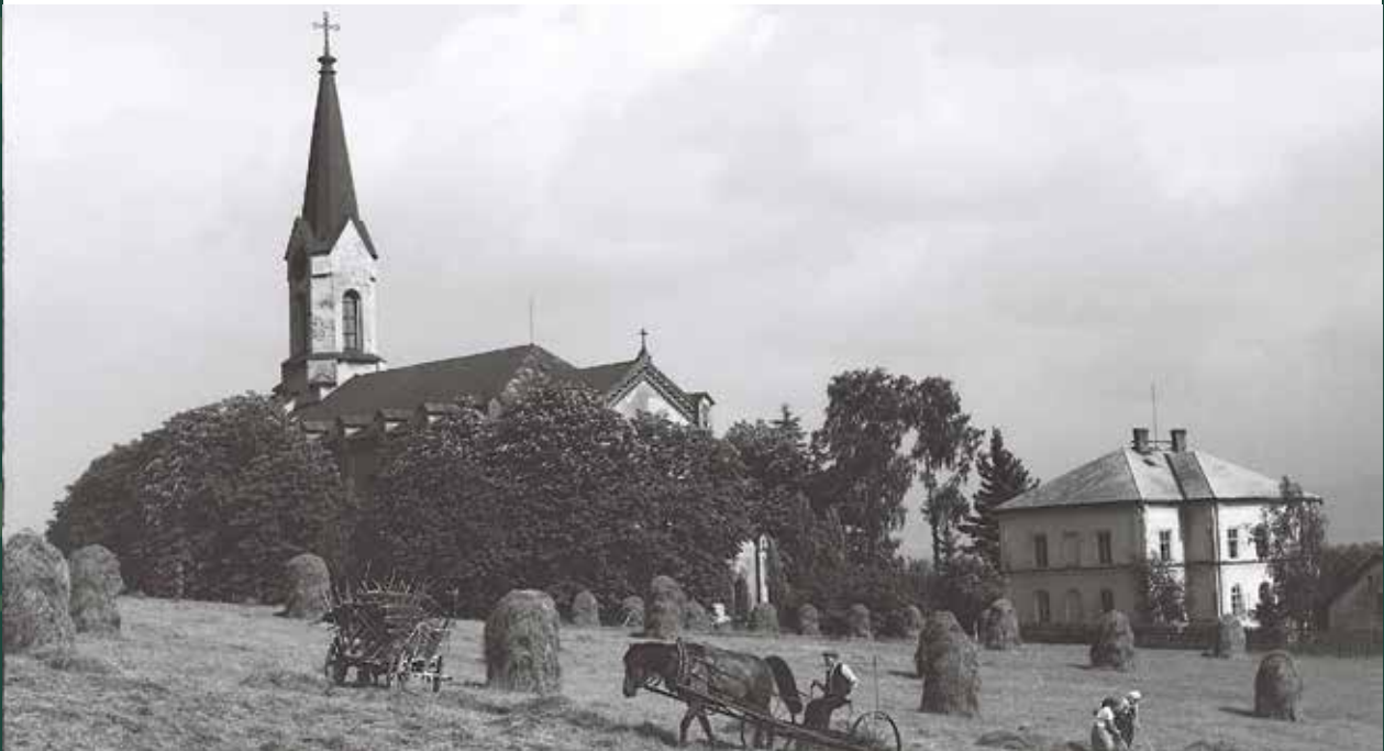
Kaplicówka – kościół ewangelicki Świętej Trójcy, 1958 rok