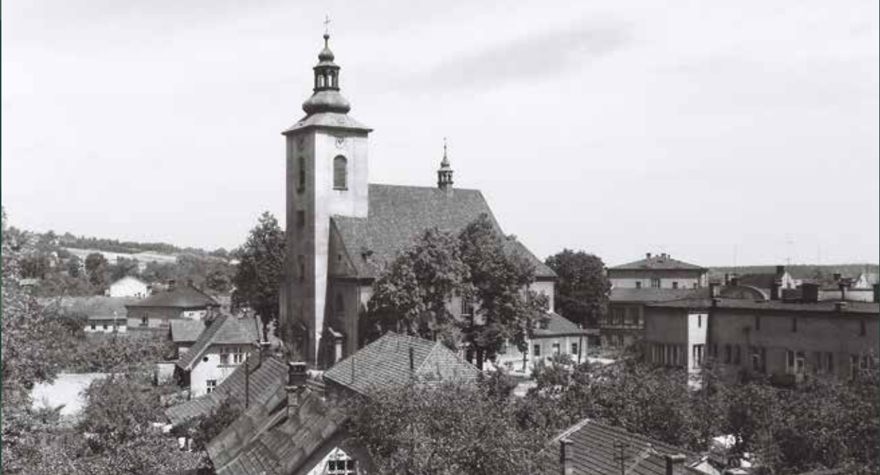
Widok z wieży strażnicy OSP na kościół pw. św. Ap. Piotra i Pawła, 1965 rok