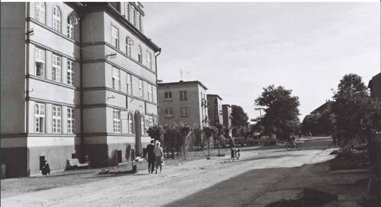
Ulica Targowa w stronę ulicy Mickiewicza, 1964 rok