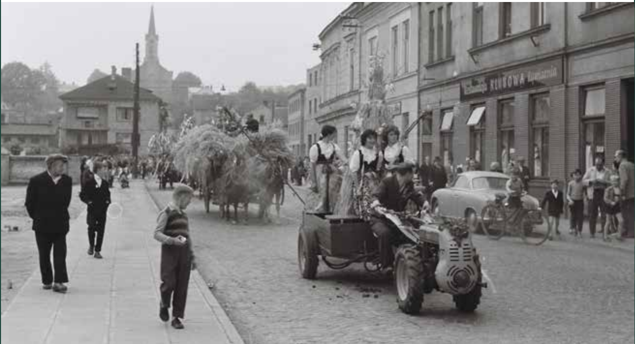
Pochód dożynkowy na ulicy Cieszyńskiej, 1960 rok