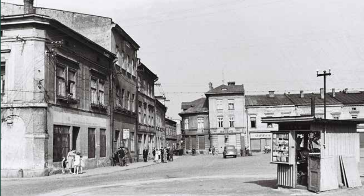
Widok na Rynek od ulicy Cieszyńskiej, północno-wschodnia pierzeja, 1958 rok