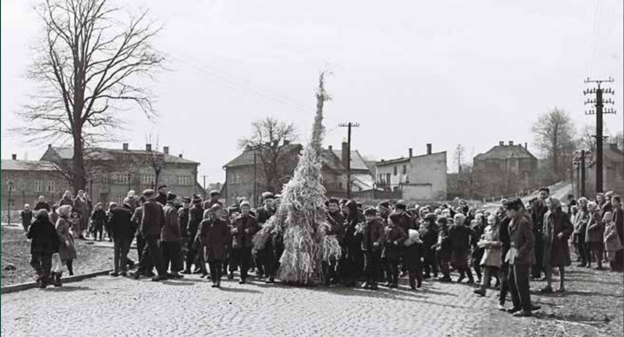
Pochód z „Judoszem”, ulica Objazdowa, 1957 rok