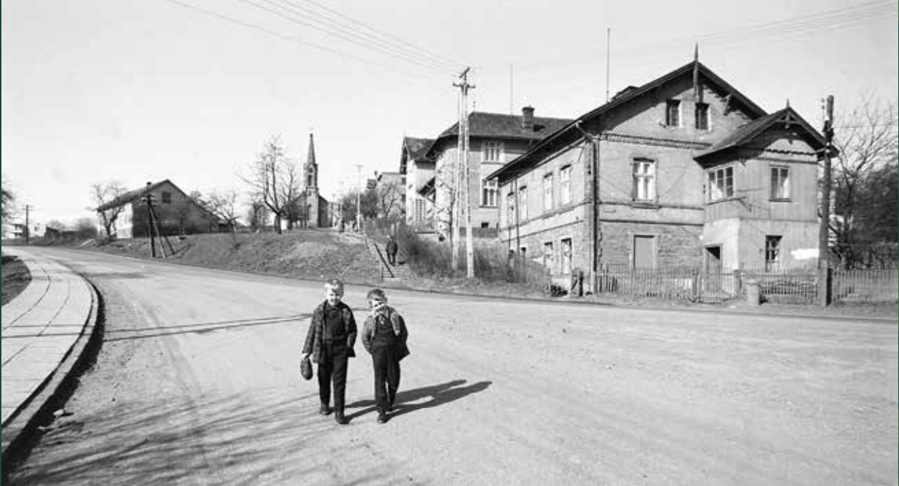
Ulica Cieszyńska – widok na kościół ewangelicki Świętej Trójcy, 1972 rok