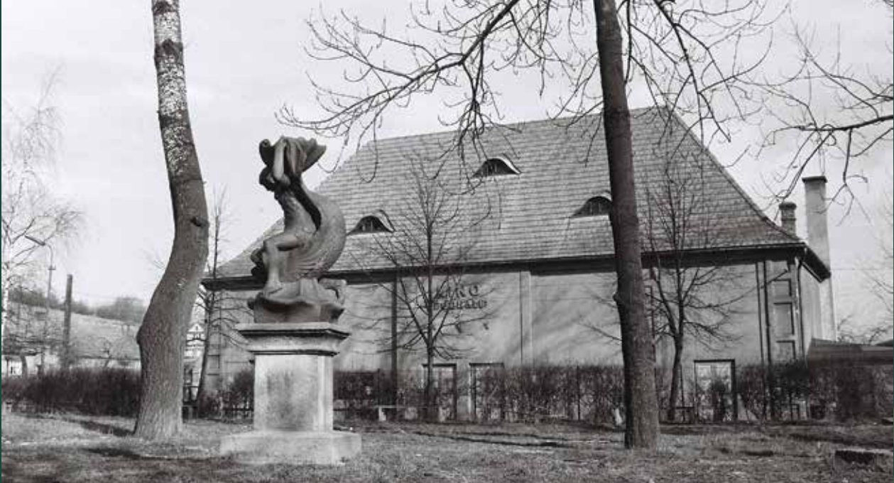
Widok na kino „Podhale” z parku za strażnicą OSP (na pierwszym planie figura Neptuna), 1967 rok