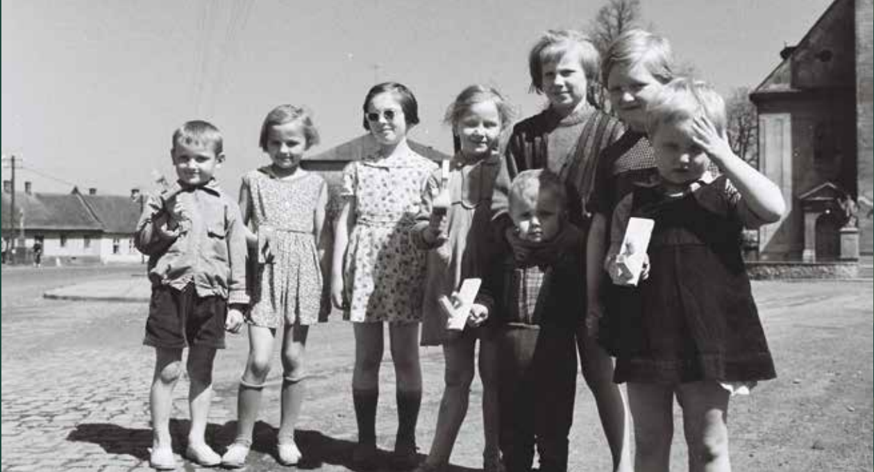
Dzieci z kłopotkami przed kościołem katolickim w czasie pochodu z „Judoszem”, 1962 rok