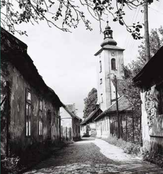
Ulica Wałowa, 1957 rok