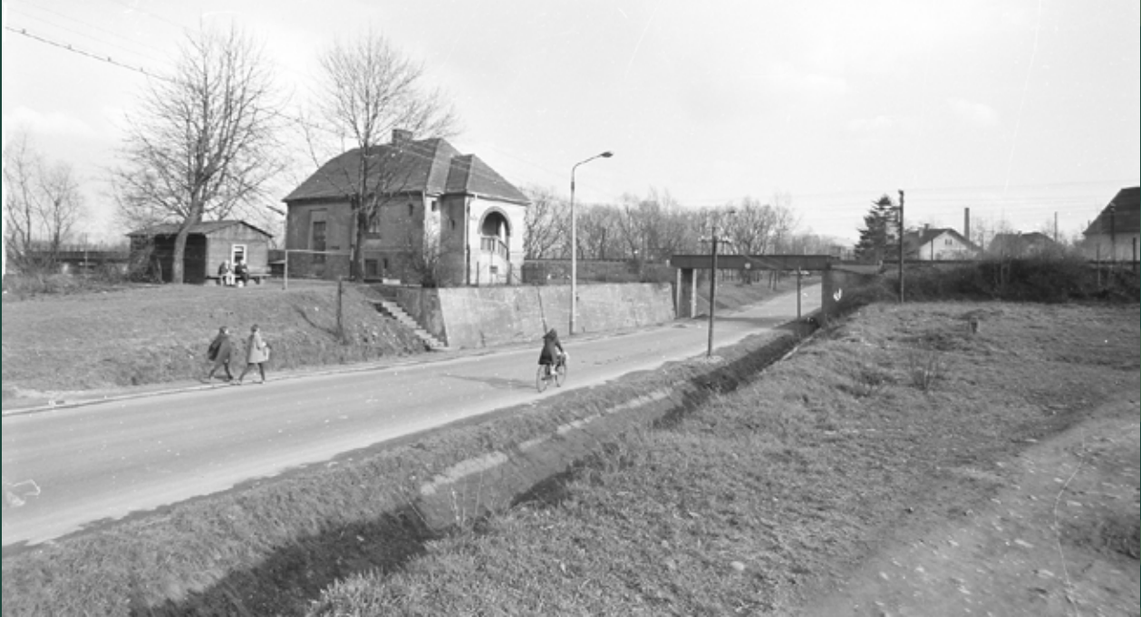
Ulica Wiślańska i wiadukt kolejowy, 1971 rok