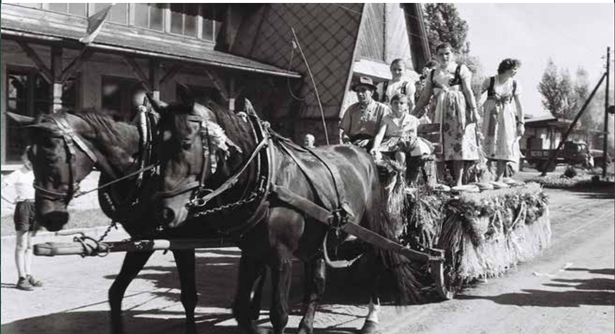
Pochód dożynkowy w parku „Nad Wisłą”, 1961 rok