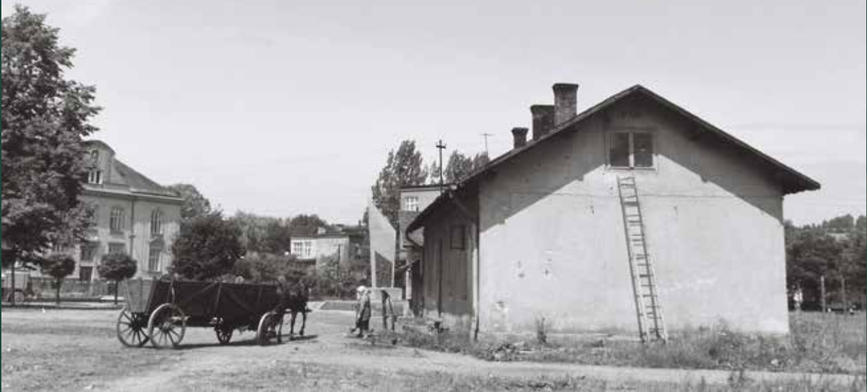
Zabudowania na targowisku przy ulicy Mickiewicza niedaleko dworca kolejowego, 1965 rok