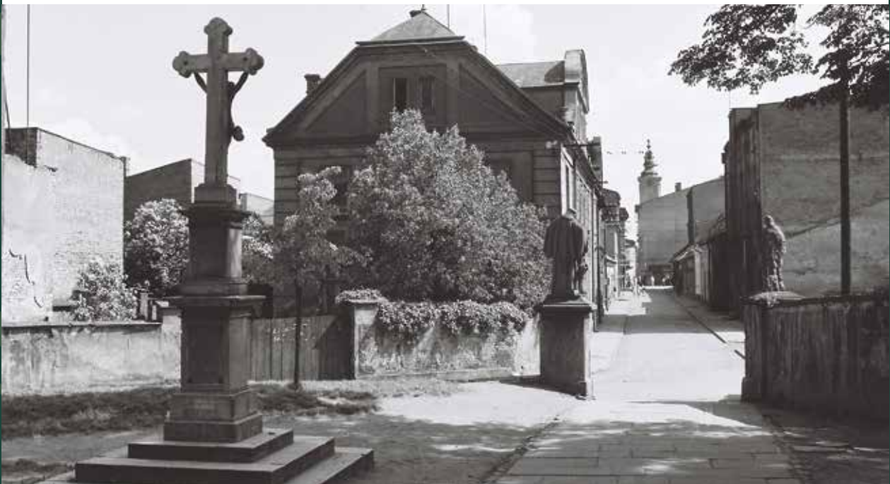
Plac kościelny – widok na ulicę Kościelną, 1956 rok