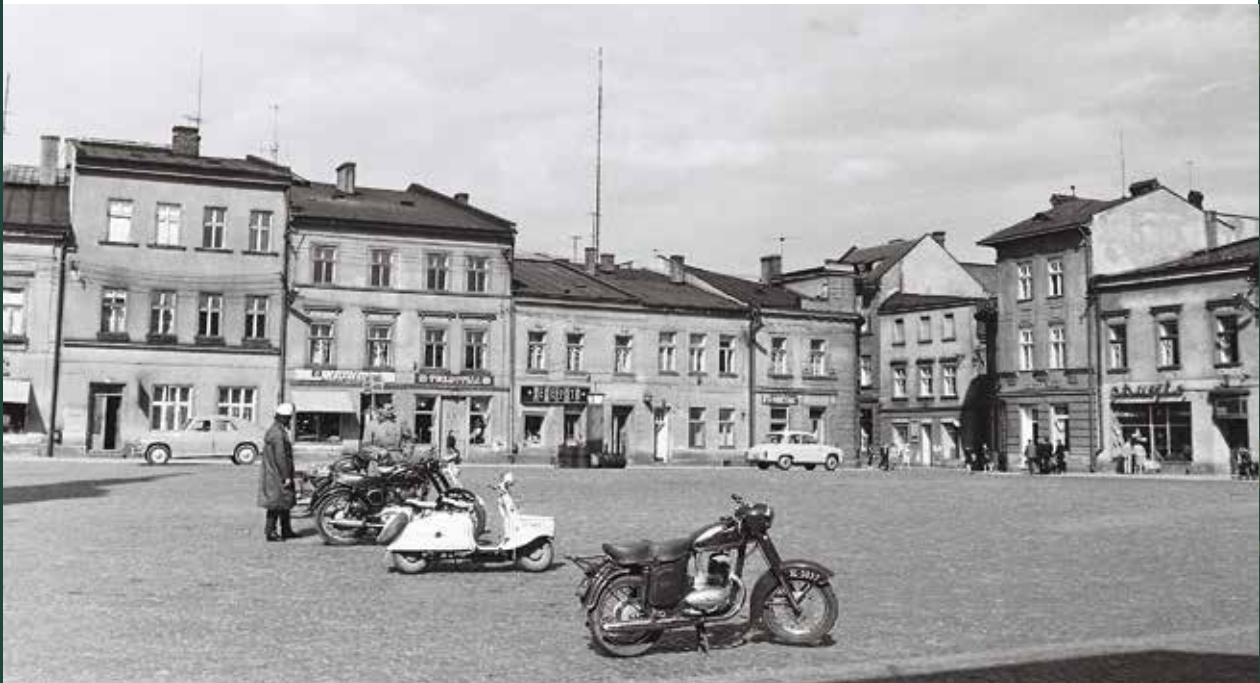
Widok na Rynek – północno-wschodnia pierzeja, 1965 rok