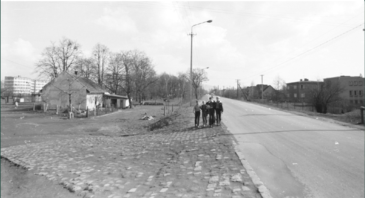
Ulica Wiślańska, 1971 rok