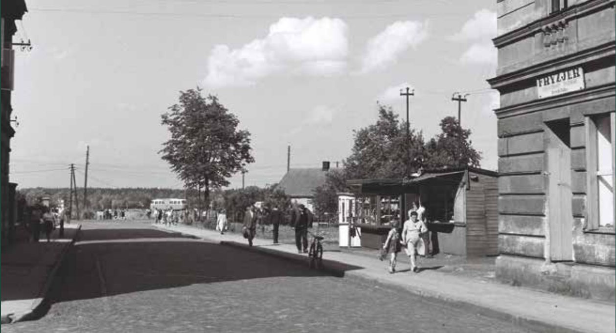
Ulica Bielska w stronę dworca autobusowego (PKS), 1965 rok