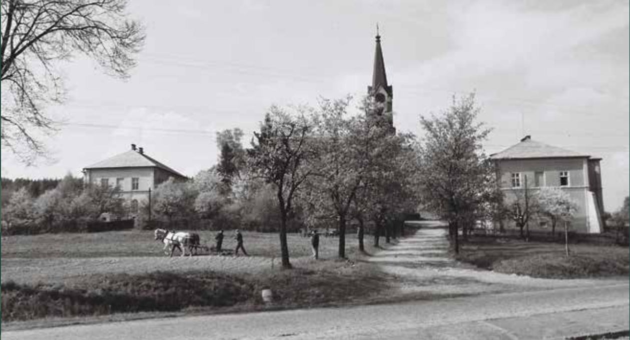
Ulica Cieszyńska – kościół ewangelicki Świętej Trójcy i szkoła (po prawej), 1960 rok