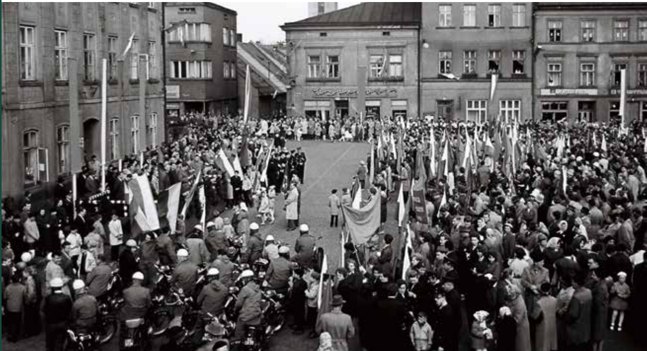
Obchody 1 Maja – wiec na Rynku, 1965 rok