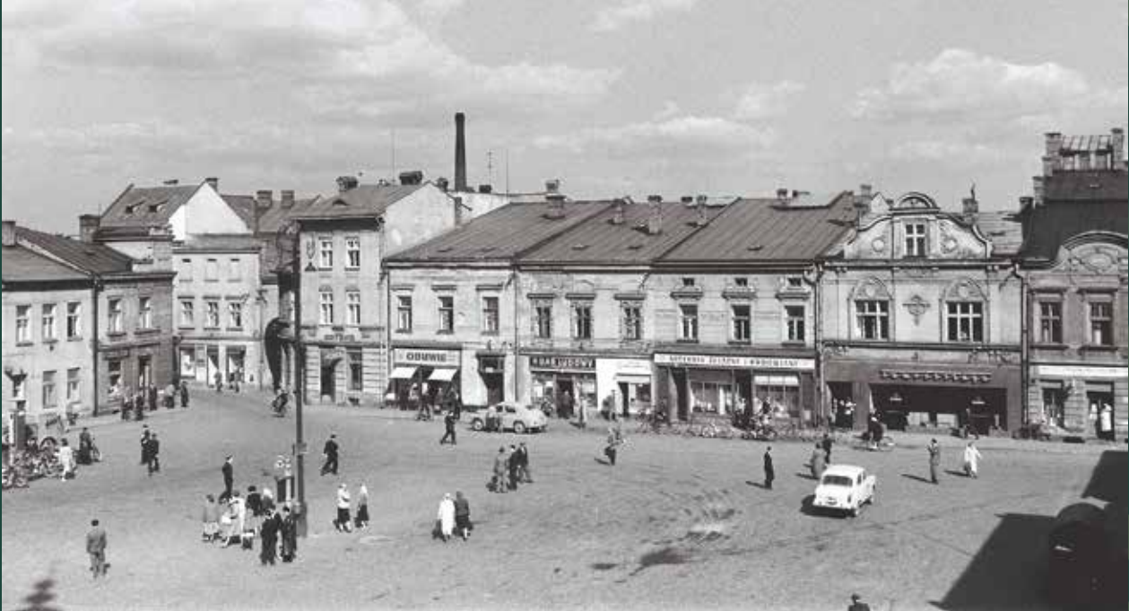
Rynek – północno-wschodnia pierzeja, widok z Ratusza, 1959 rok