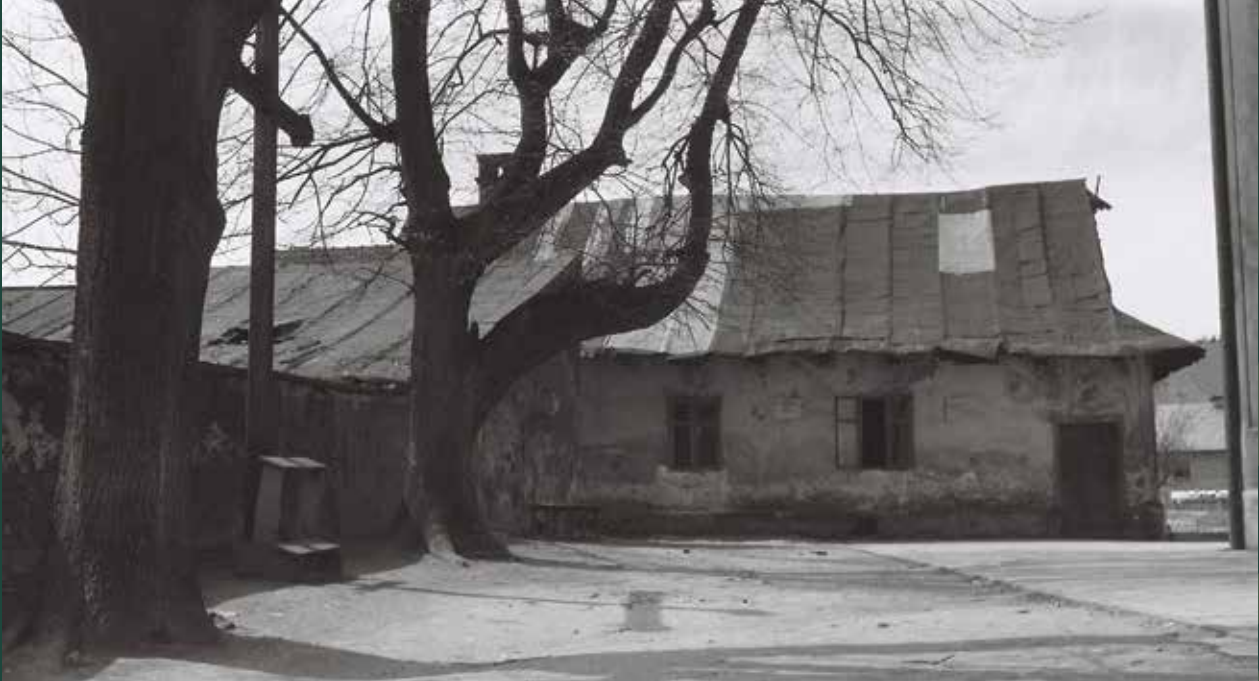
Ulica Wałowa od strony kościoła – dom kościelnego (dawna szkoła), 1957 rok