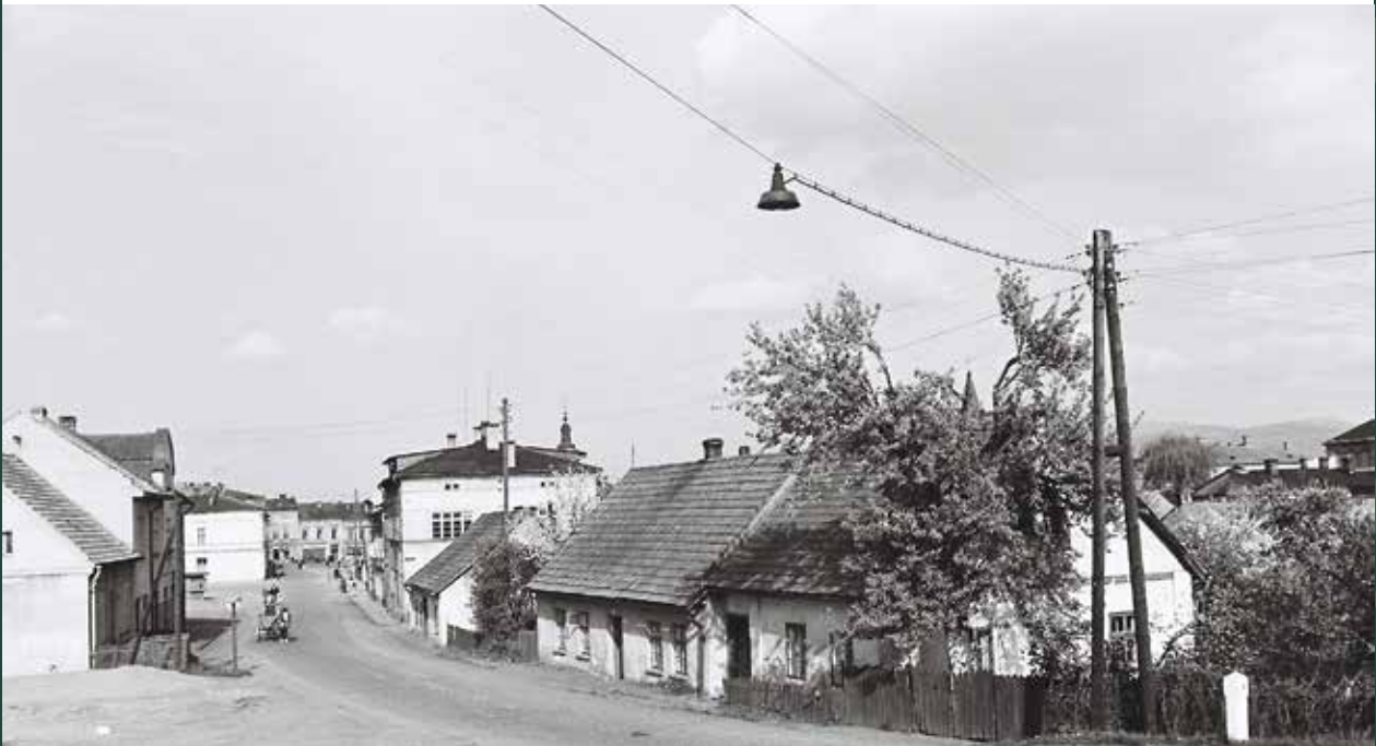
Ulica Cieszyńska – widok w kierunku Rynku, 1958 rok