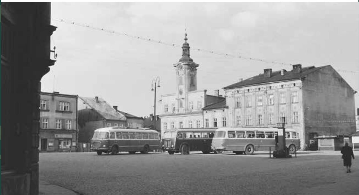
Widok na Rynek od ulicy Bielskiej, 1960 rok