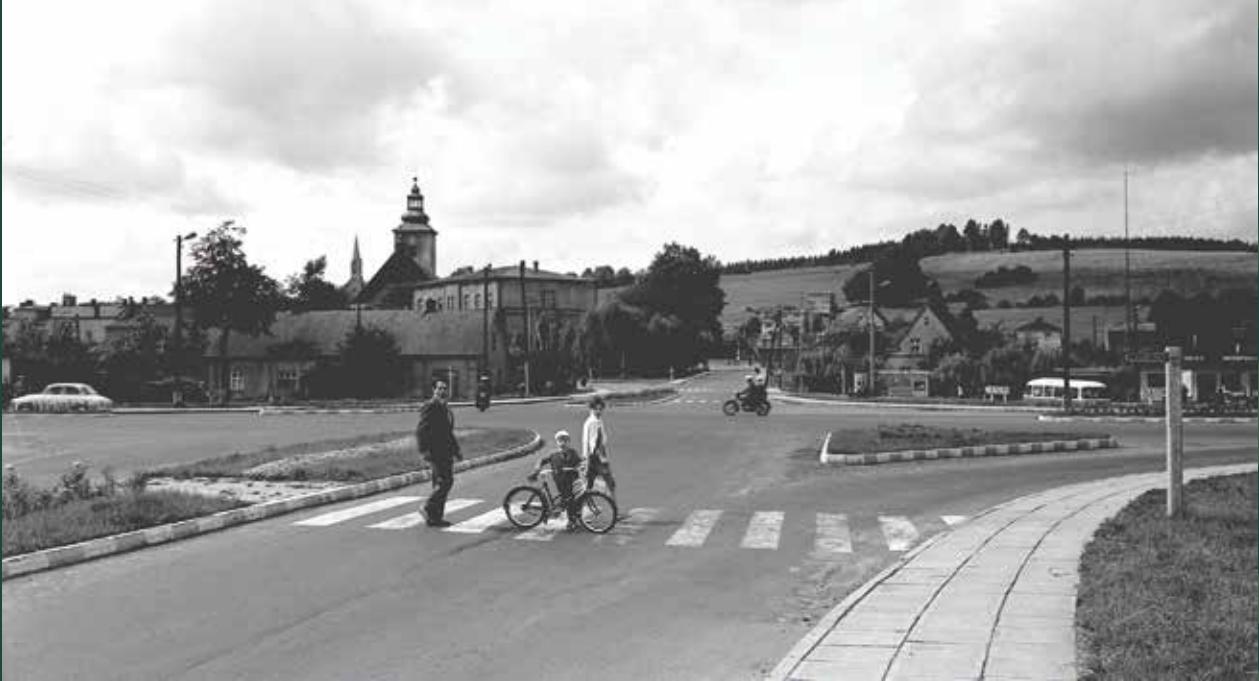
Skrzyżowanie dróg: Cieszyn-Bielsko, Katowice-Wisła, 1968 rok