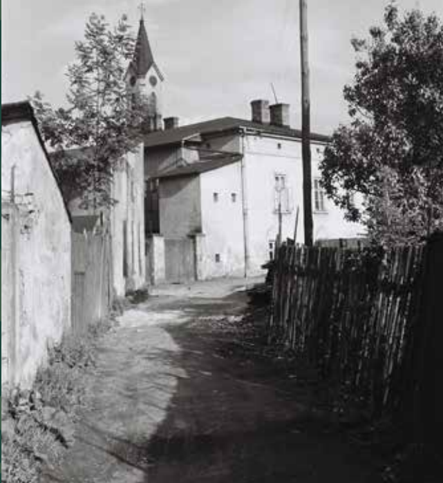
Ulica Szpitalna na tyłach kościół katolickiego, 1961 rok