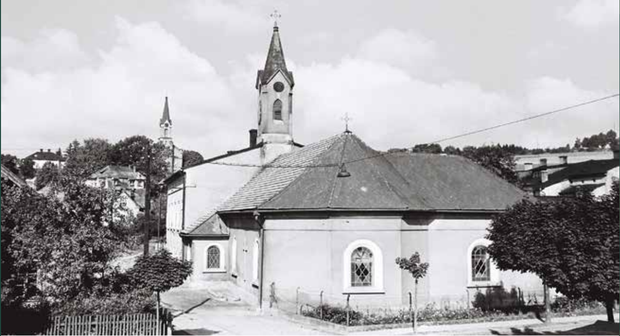
Ulica Mickiewicza – kościół katolicki pw. św. Krzyża – „Szpitalik”, 1957 rok