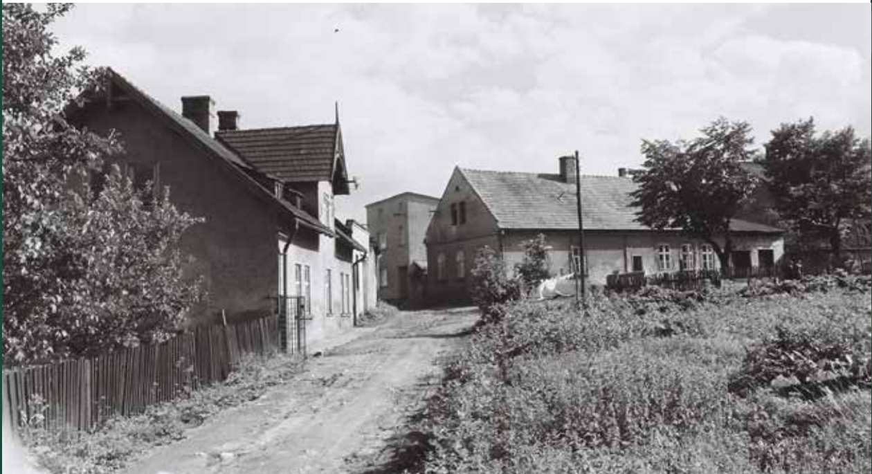
Ulica Zamkowa, 1961 rok