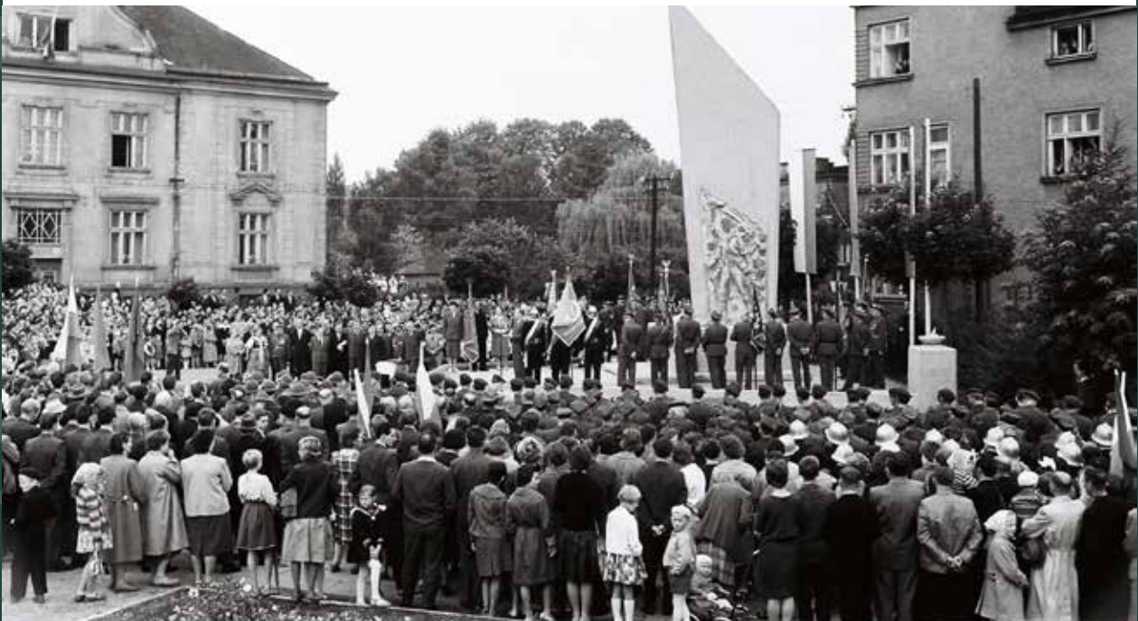
Uroczyste odsłonięcie pomnika przy ulicy Mickiewicza, 1961 rok