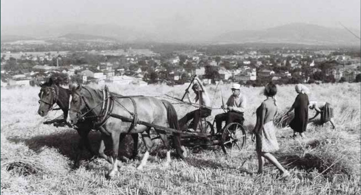
Żniwa na wzgórzu Kaplicówka, 1963 rok