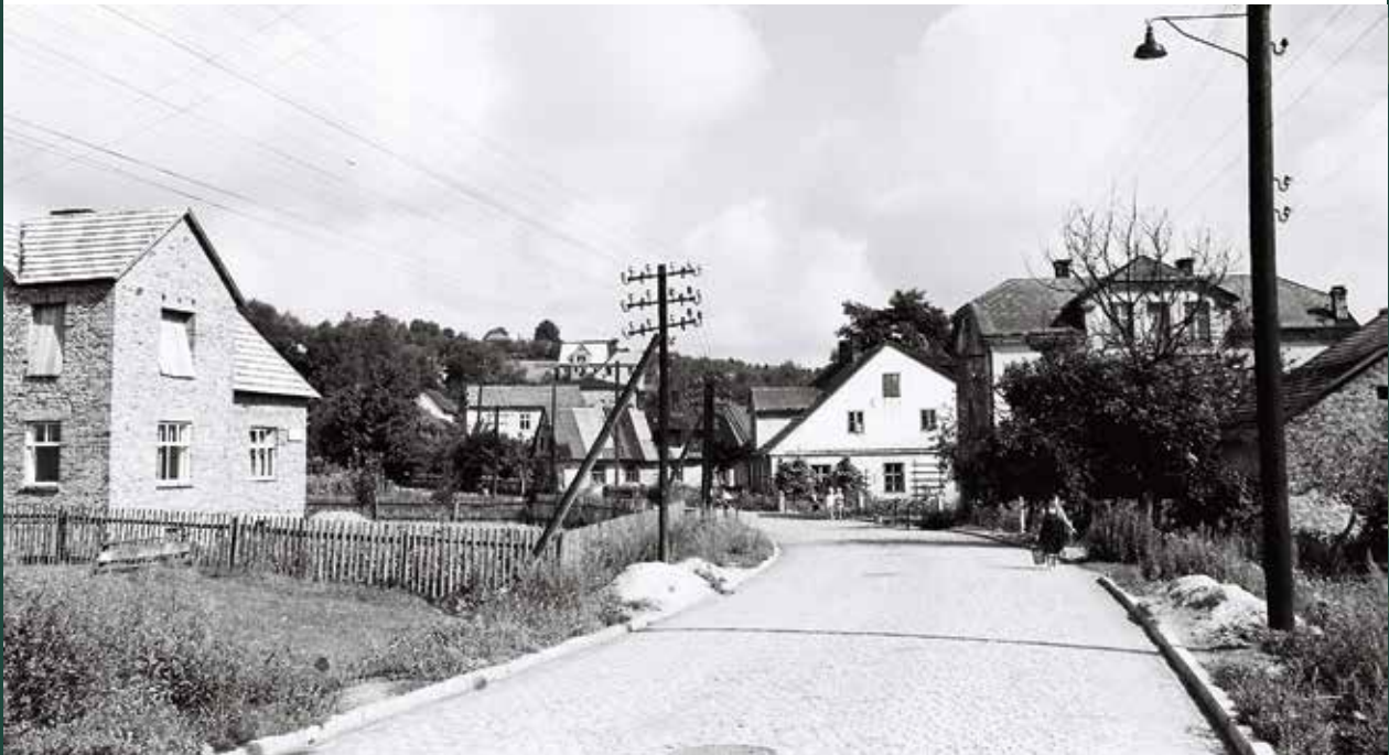
Ulica Stalmacha w stronę Kopca Wiślickiego, 1957 rok