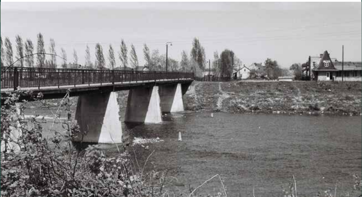
„Ława” nad Wisłą, 1960 rok