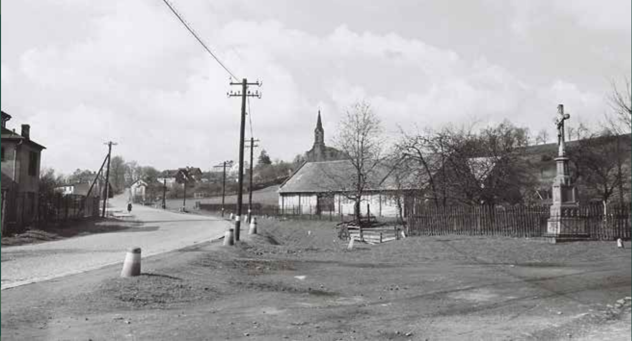
Ulica Objazdowa – po prawej Groszówka, 1961 rok