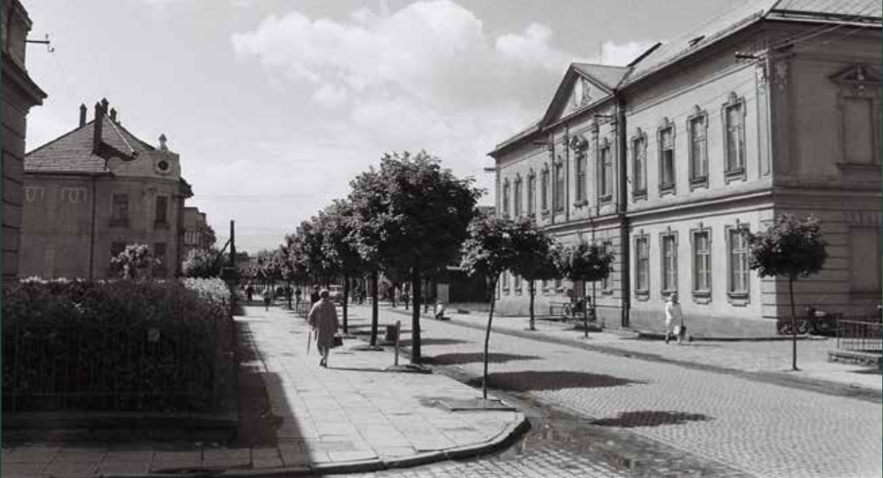
Ulica Mickiewicza w kierunku dworca kolejowego. Po prawej budynek poczty, 1963 rok