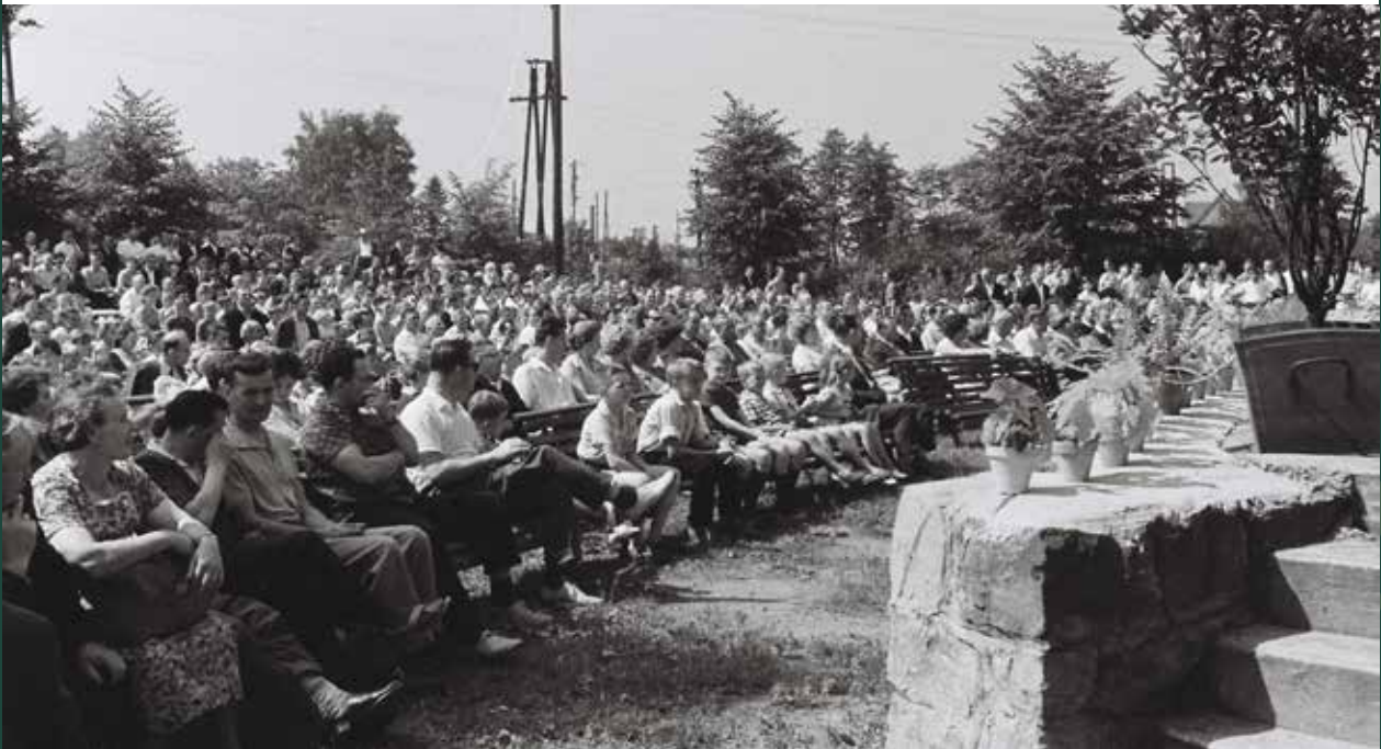
Obchody 20-lecia PRL w nieistniejącym amfiteatrze, 1964 rok