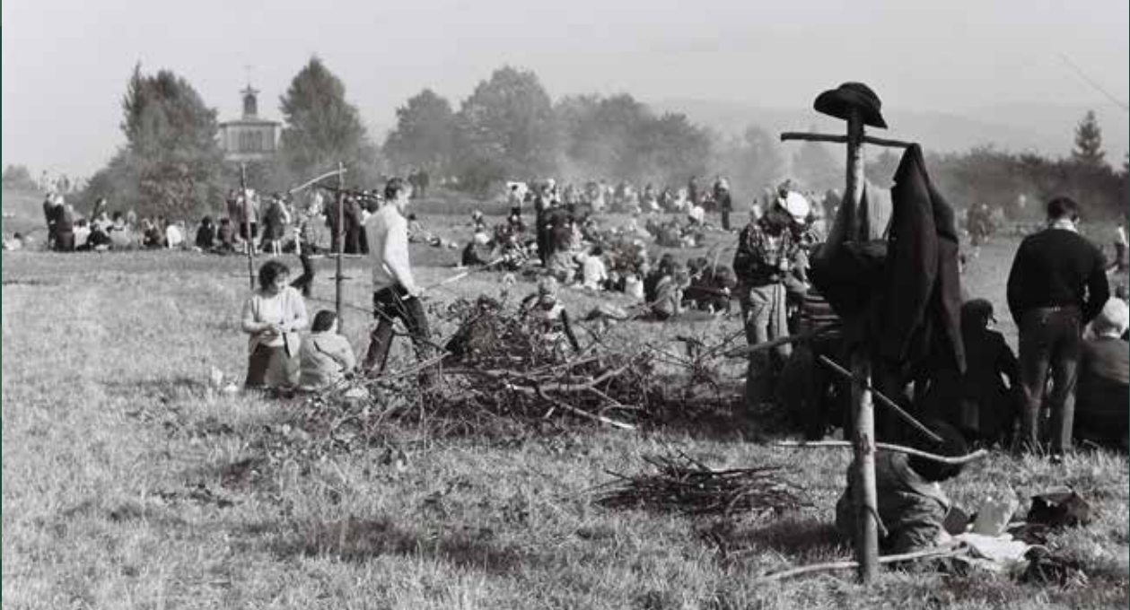
„Pieczenie Barana” na Kaplicówce, 1969 rok