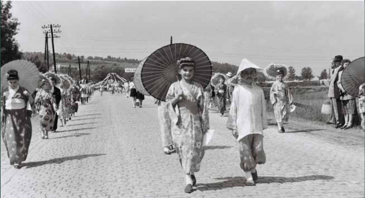
Pochód dzieci na festyn szkolny na ulicy Wiślańskiej, 1961 rok