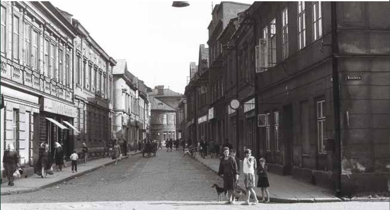
Ulica Bielska w stronę Rynku, 1965 rok