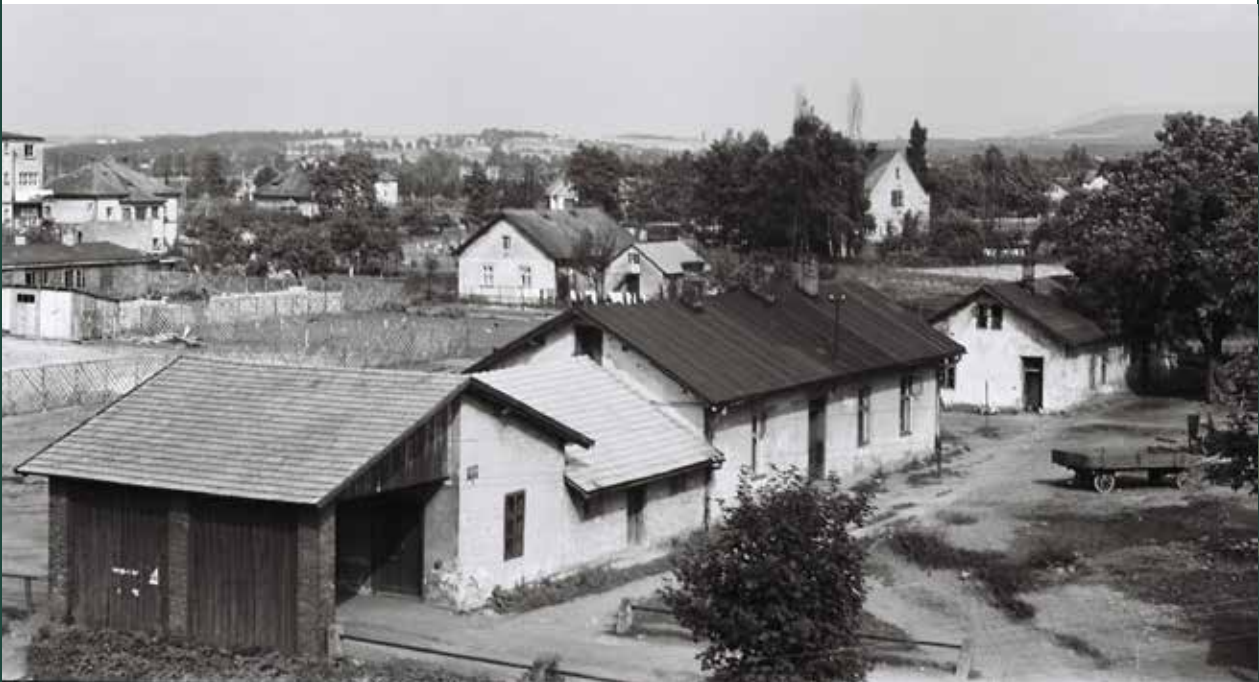
Zabudowania byłej restauracji Jana Drabiny przy targowisku, 1957 rok