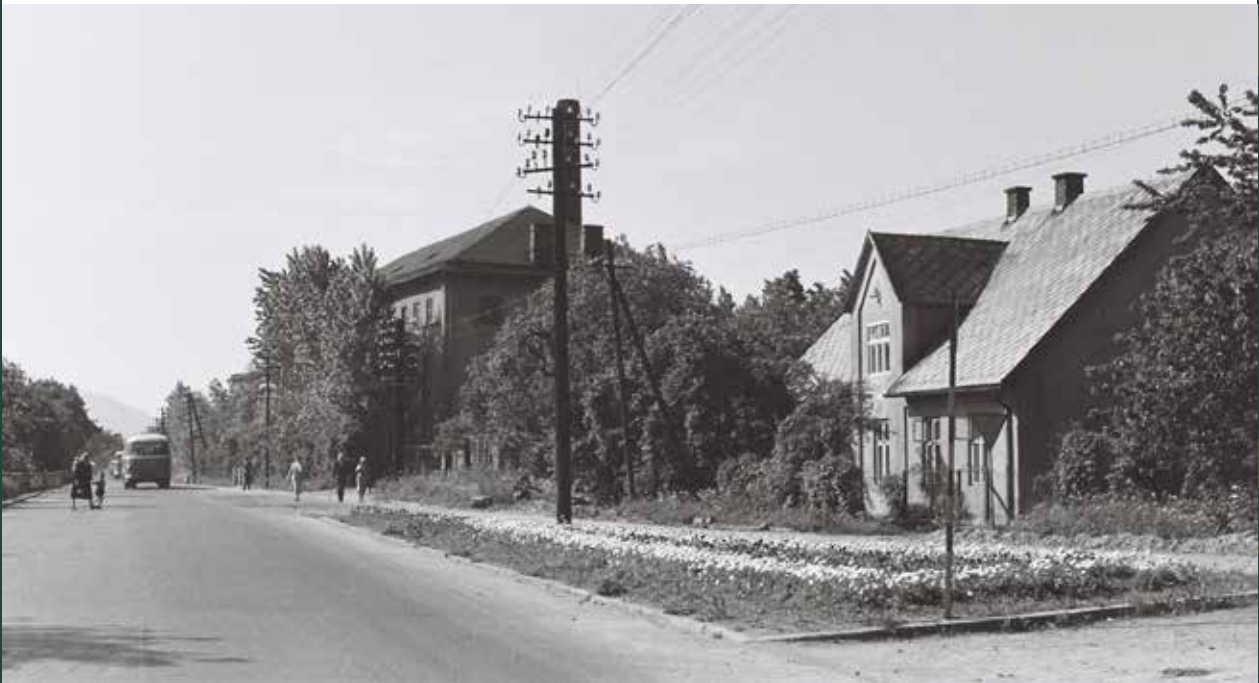
Ulica Wiślańska w stronę Harbutowic, 1965 rok