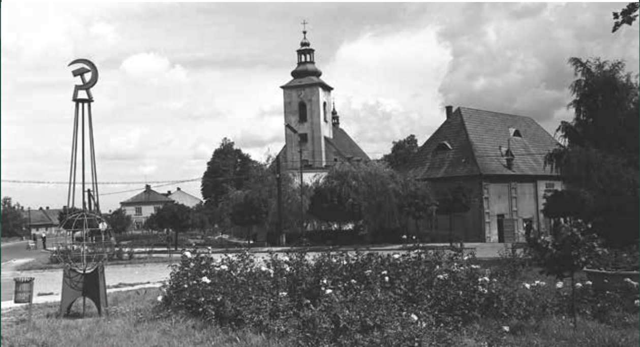
Skwer przy ulicy Objazdowej – widok na kościół katolicki i kino „Podhale”, 1968 rok