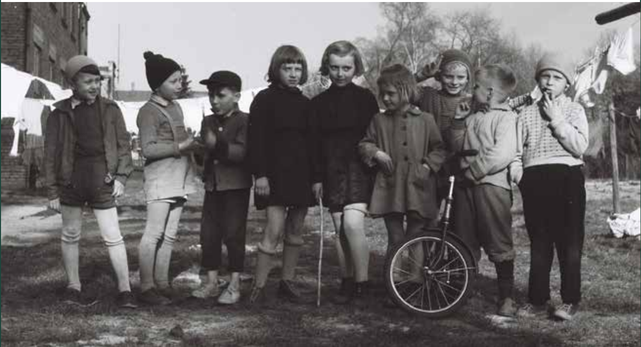
Dzieci z ulicy Łęgowej, 1965 rok