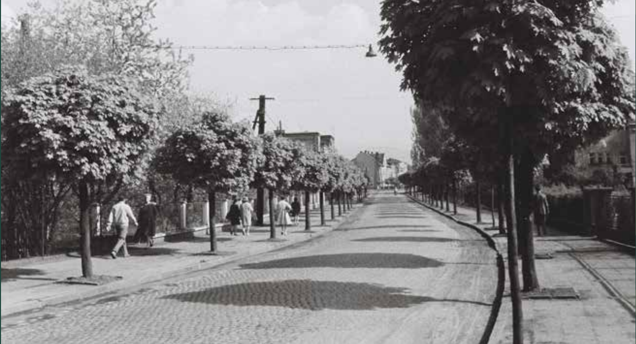
Ulica Mickiewicza w stronę dworca kolejowego, 1964 rok