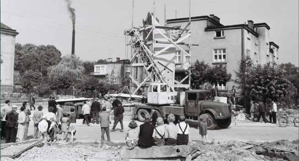
Budowa pomnika „Poległym za polskość Śląska” przy ulicy Mickiewicza, 1961 rok