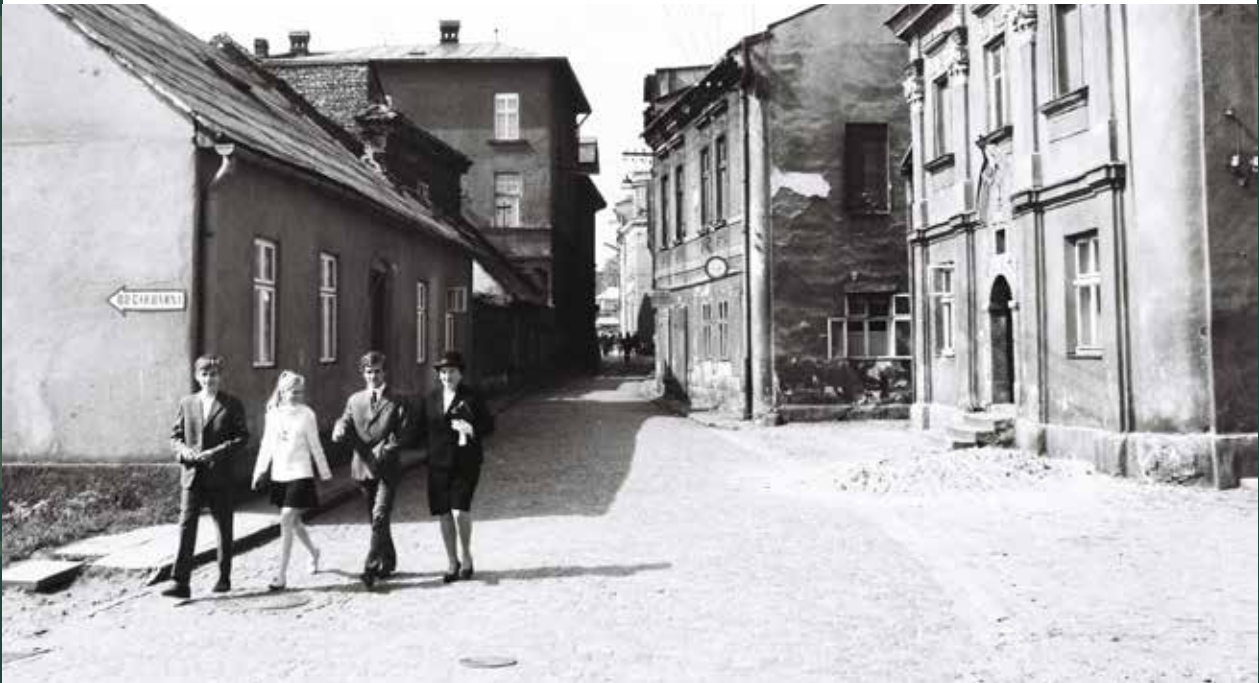
Ulica Fabryczna w stronę Rynku, 1968 rok