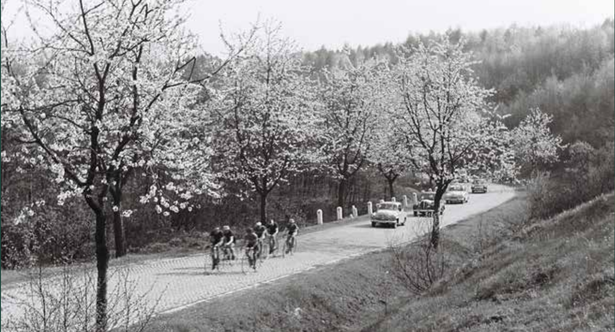
Wyścig kolarski ulicą Katowicką, 1958 rok