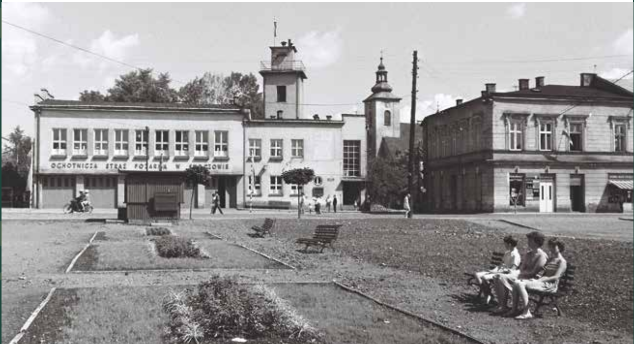
Ulica Cieszyńska, skwer na Małym Rynku, 1965 rok