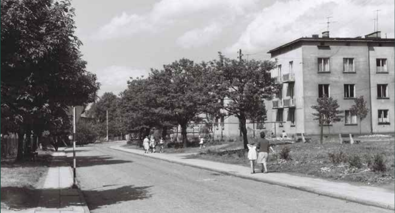
Bloki przy ulicy Targowej, 1965 rok