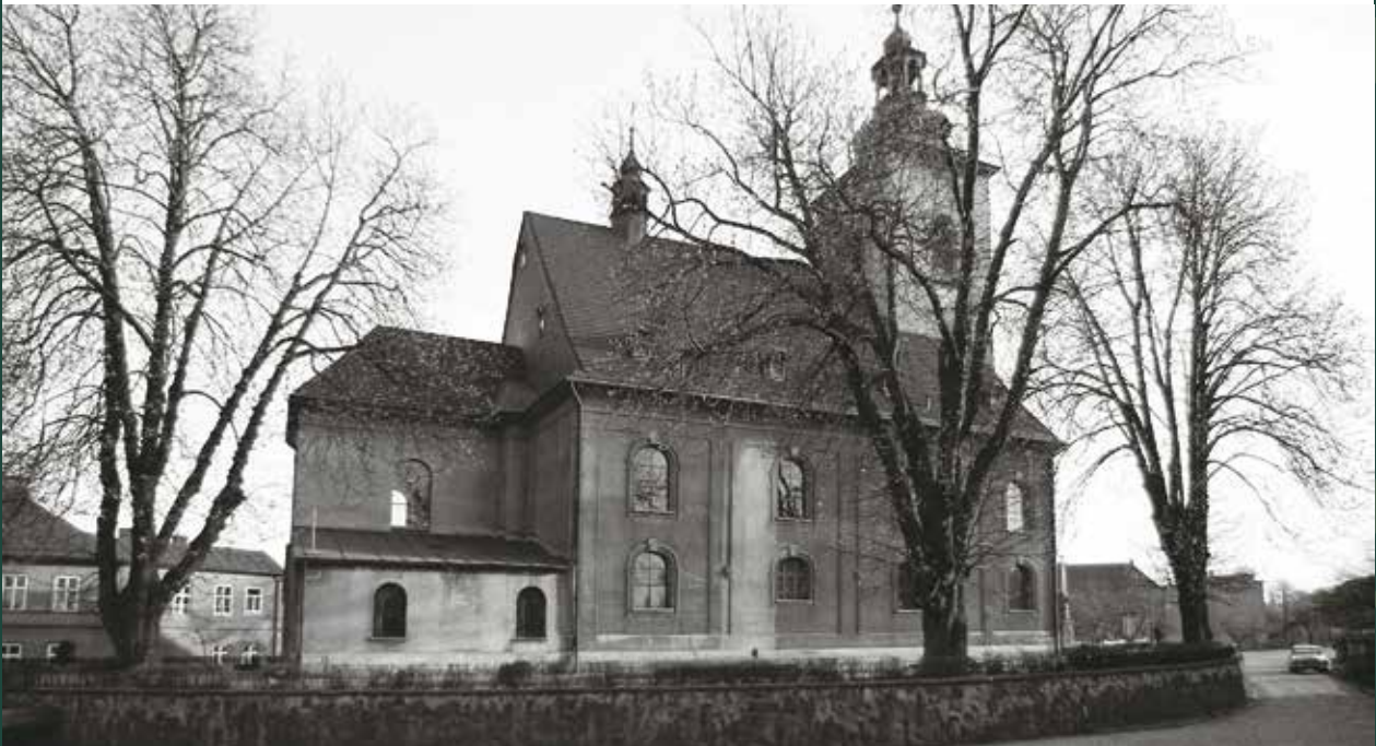
Kościół katolicki pw. św. Ap. Piotra i Pawła, 1970 rok