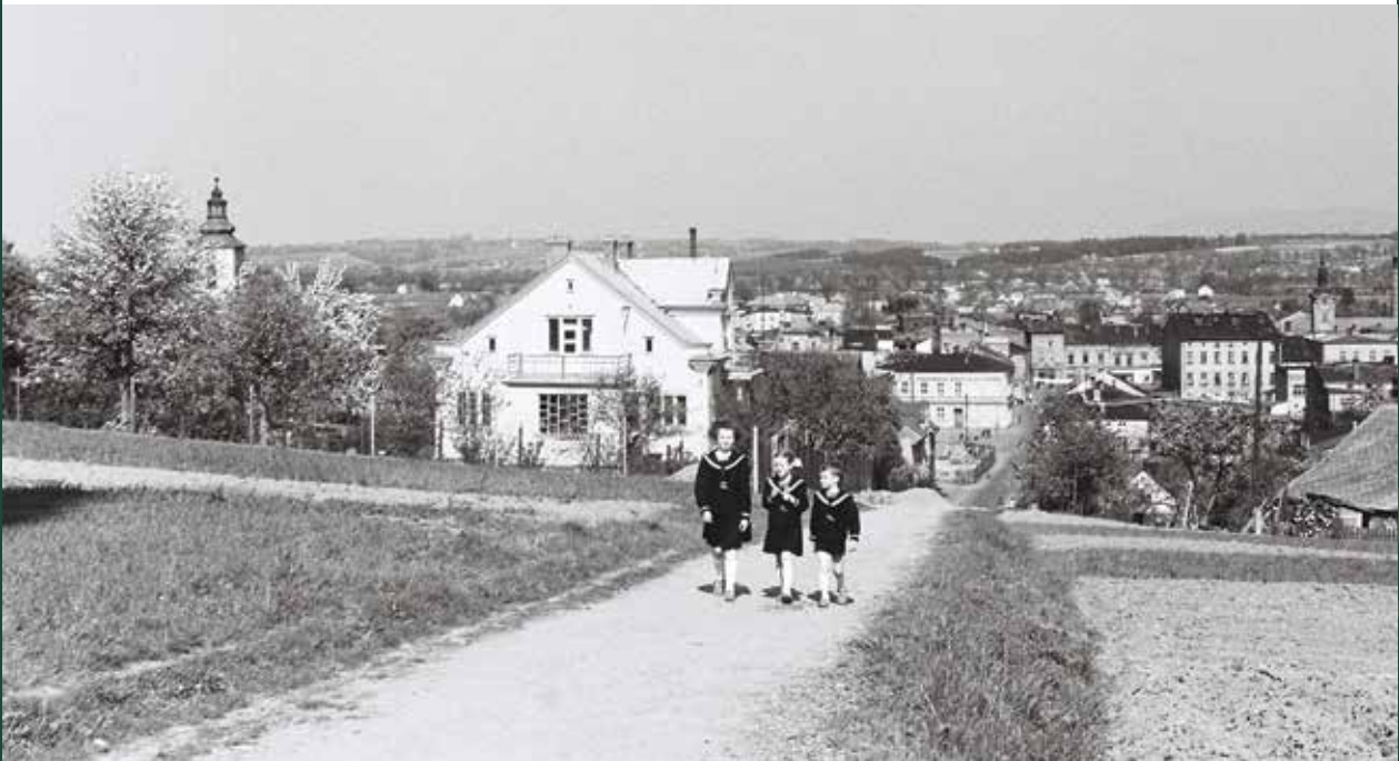
Widok na Skoczów od kościoła ewangelickiego Świętej Trójcy, 1960 rok