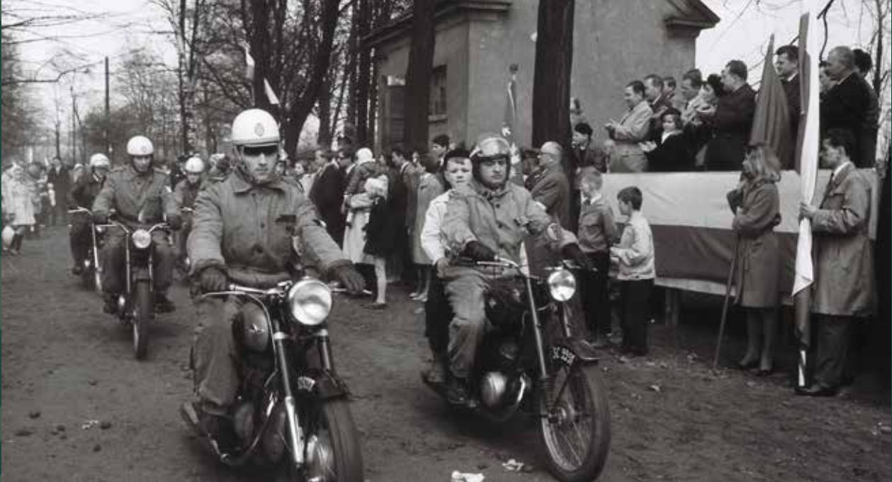
Obchody 1 Maja w parku „Nad Wisłą”, 1965 rok