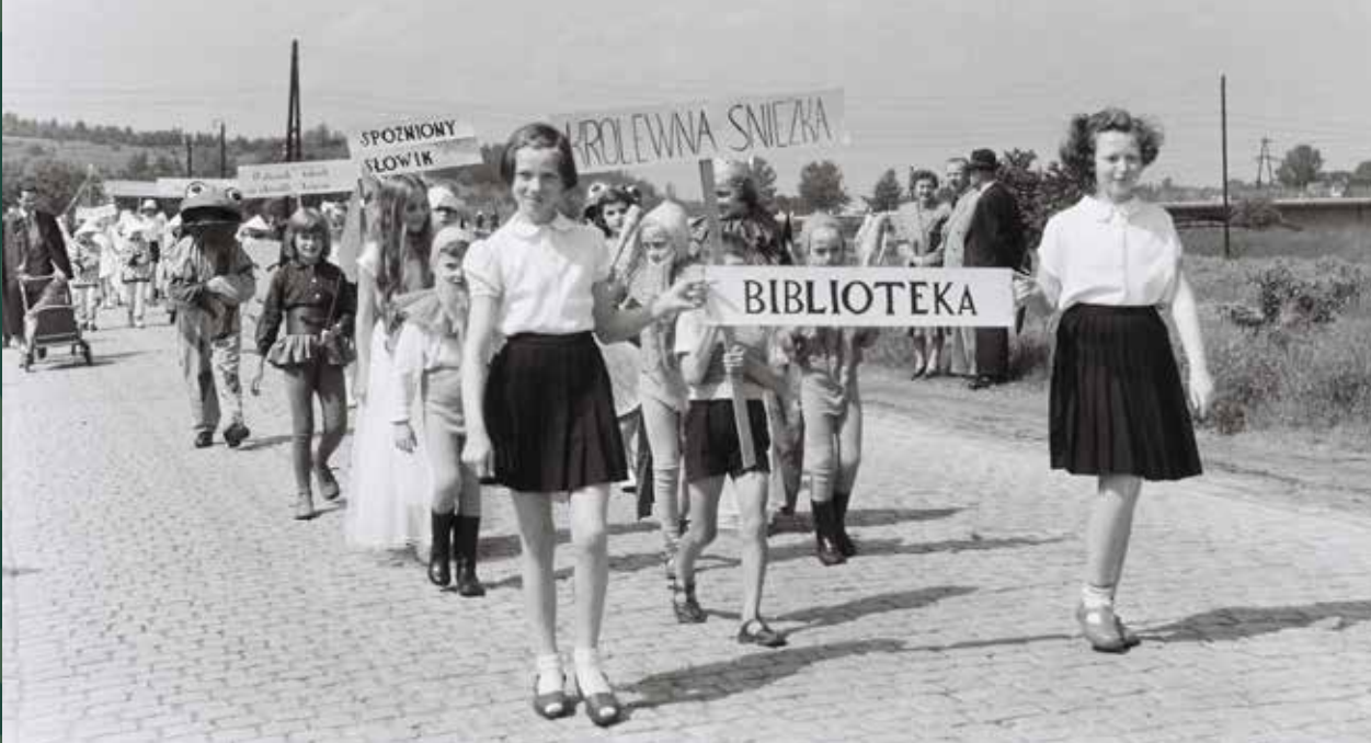
Pochód dzieci na festyn szkolny na ulicy Wiślańskiej, 1961 rok