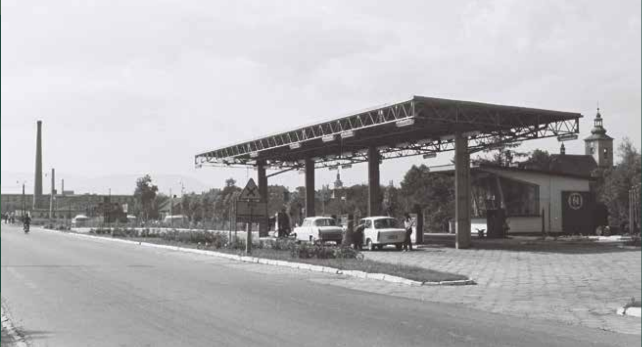
Ulica Katowicka, stacja benzynowa, 1969 rok