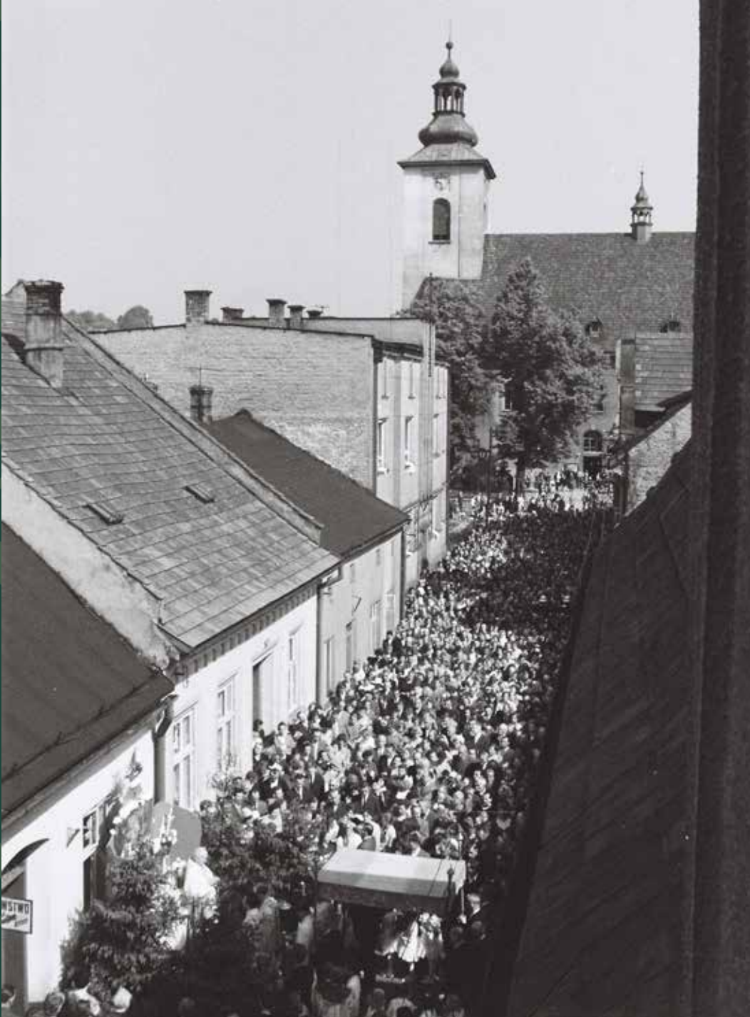
Uroczystość Bożego Ciała – procesja na ulicy Kościelnej, 1963 rok