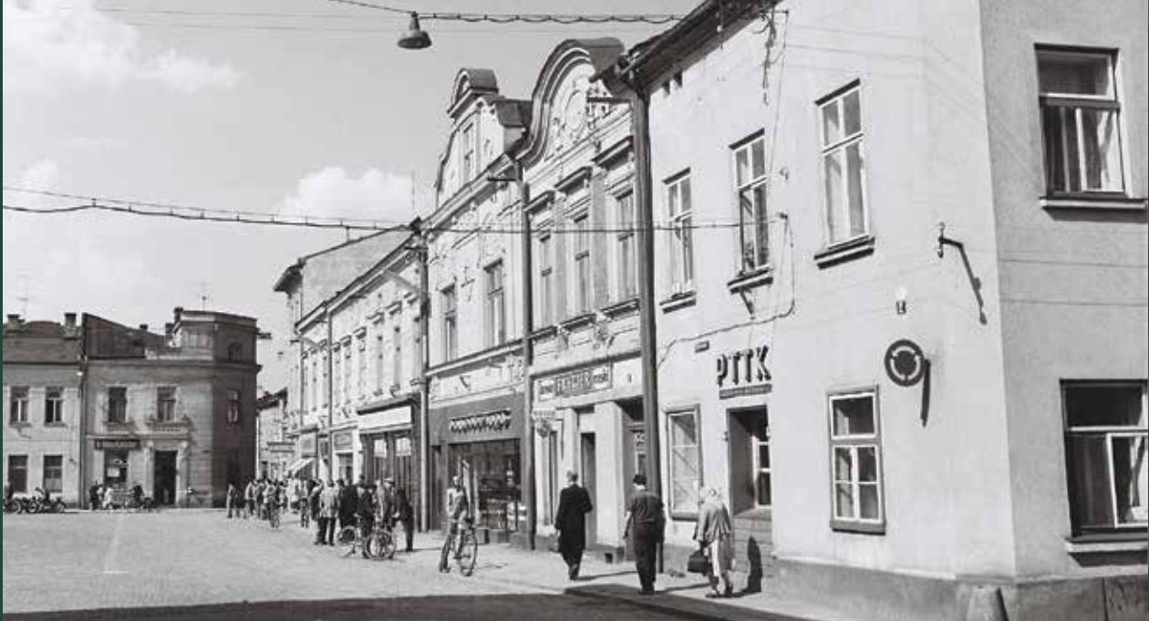
Widok na Rynek od ulicy Ustrońskiej, 1969 rok