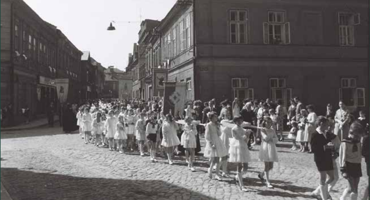
Uroczystość Bożego Ciała – procesja na ulicy Bielskiej, 1963 rok