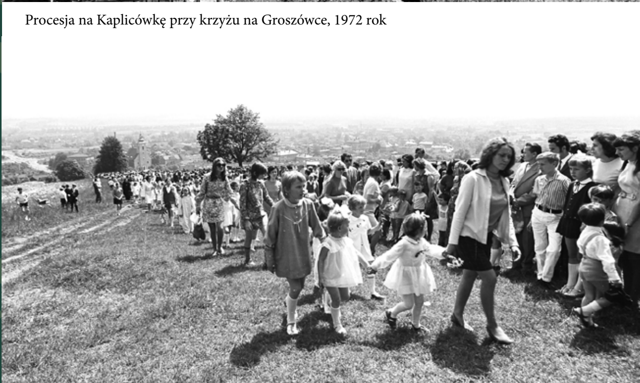
Procesja na wzgórzu Kaplicówka, 1972 rok