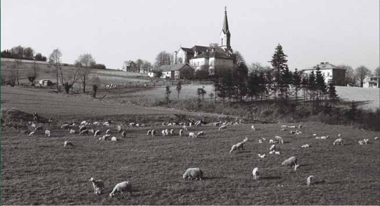
Widok na kościół ewangelicki Świętej Trójcy z Łęgu koło cmentarza katolickiego, 1970 rok