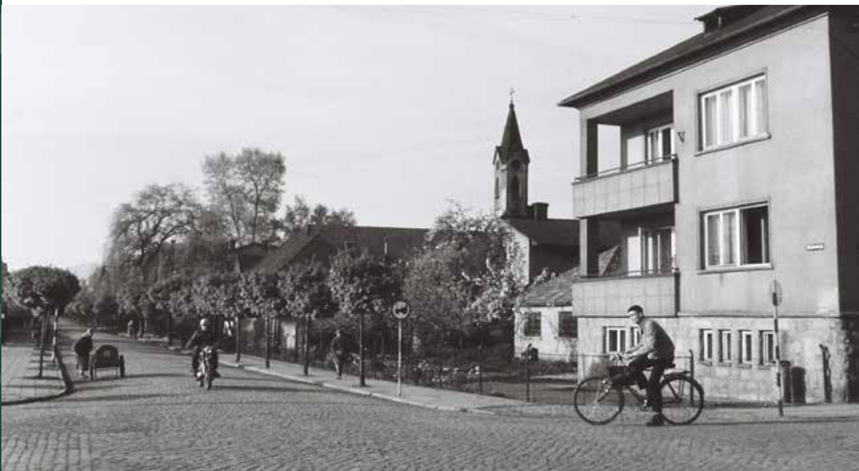
Ulica Mickiewicza w kierunku dworca kolejowego, 1965 rok