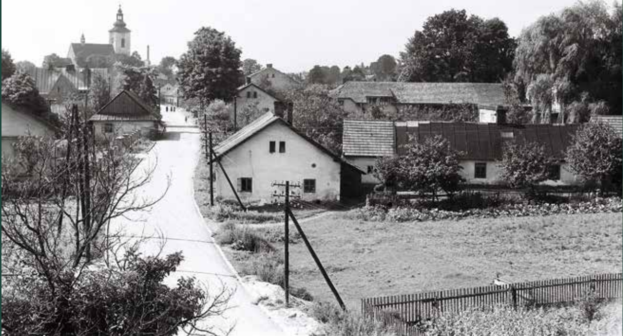
Ulica Stalmacha w stronę miasta, 1957 rok