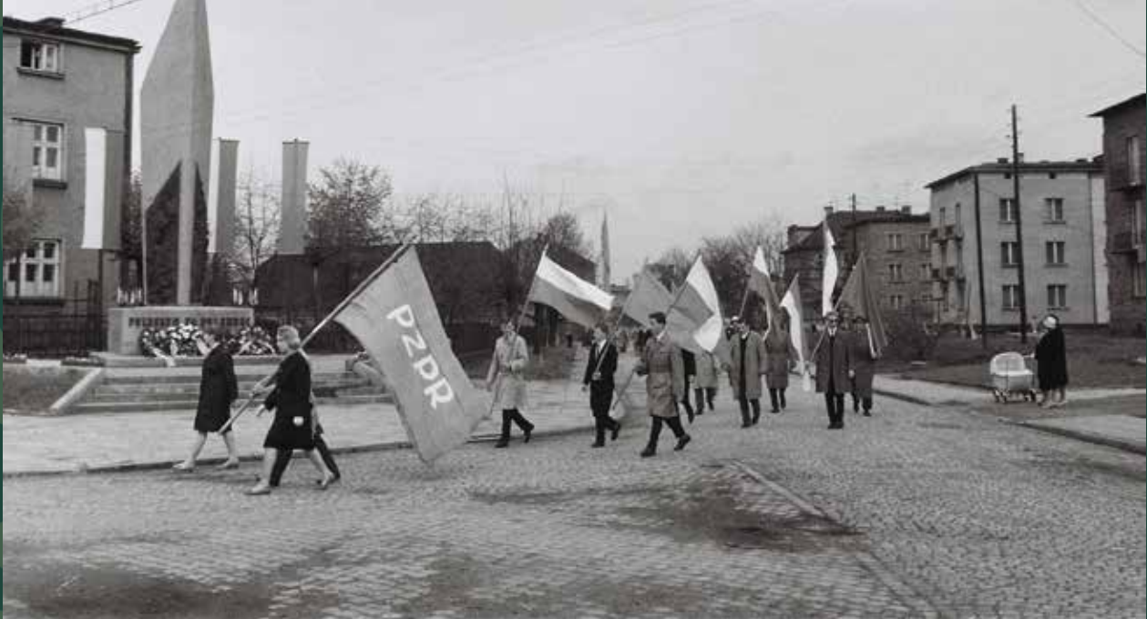
Obchody 1 Maja, pochód na skrzyżowaniu ulic Mickiewicza i Targowej, 1963 rok