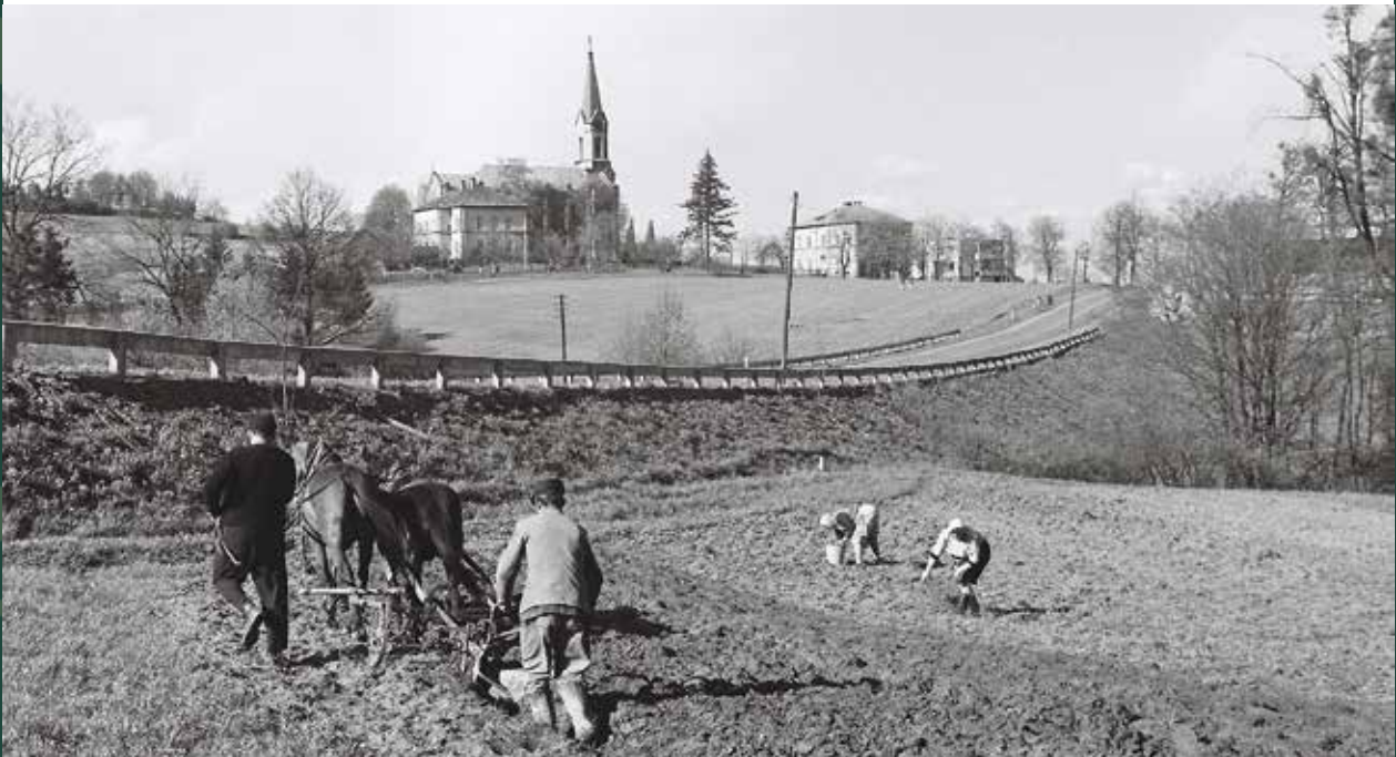
Widok na ulicę Cieszyńską i kościół ewangelicki Świętej Trójcy od strony cmentarza katolickiego, 1970 rok