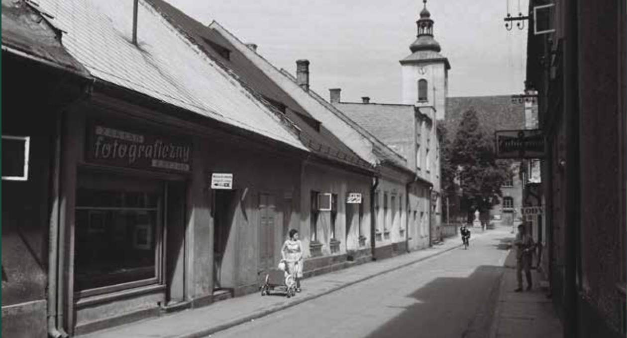
Ulica Kościelna, 1961 rok