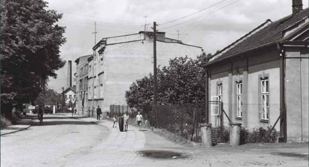
Ulica Targowa w stronę ulicy Ustrońskiej, 1965 rok