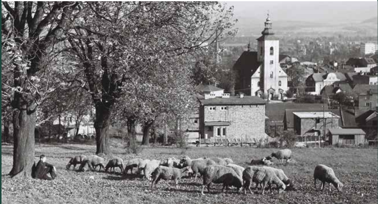
Widok z Kaplicówki na kościół katolicki pw. św. Ap. Piotra i Pawła, 1969 rok