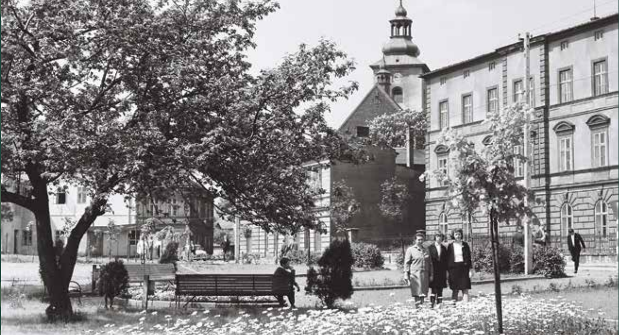
Park przy ulicy Bielskiej (obecnie im. Pawła Tendery). Z prawej Szkoła Podstawowa nr 2, 1967 rok