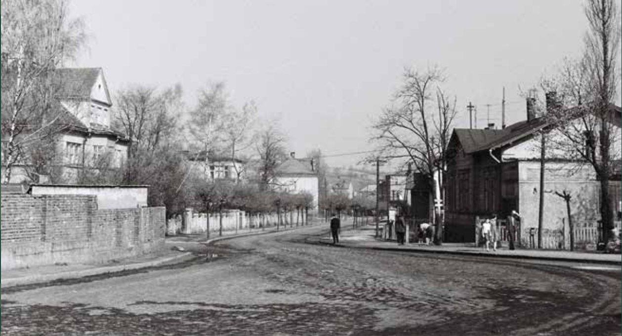
Widok na ulicę Mickiewicza od dworca kolejowego, 1961 rok