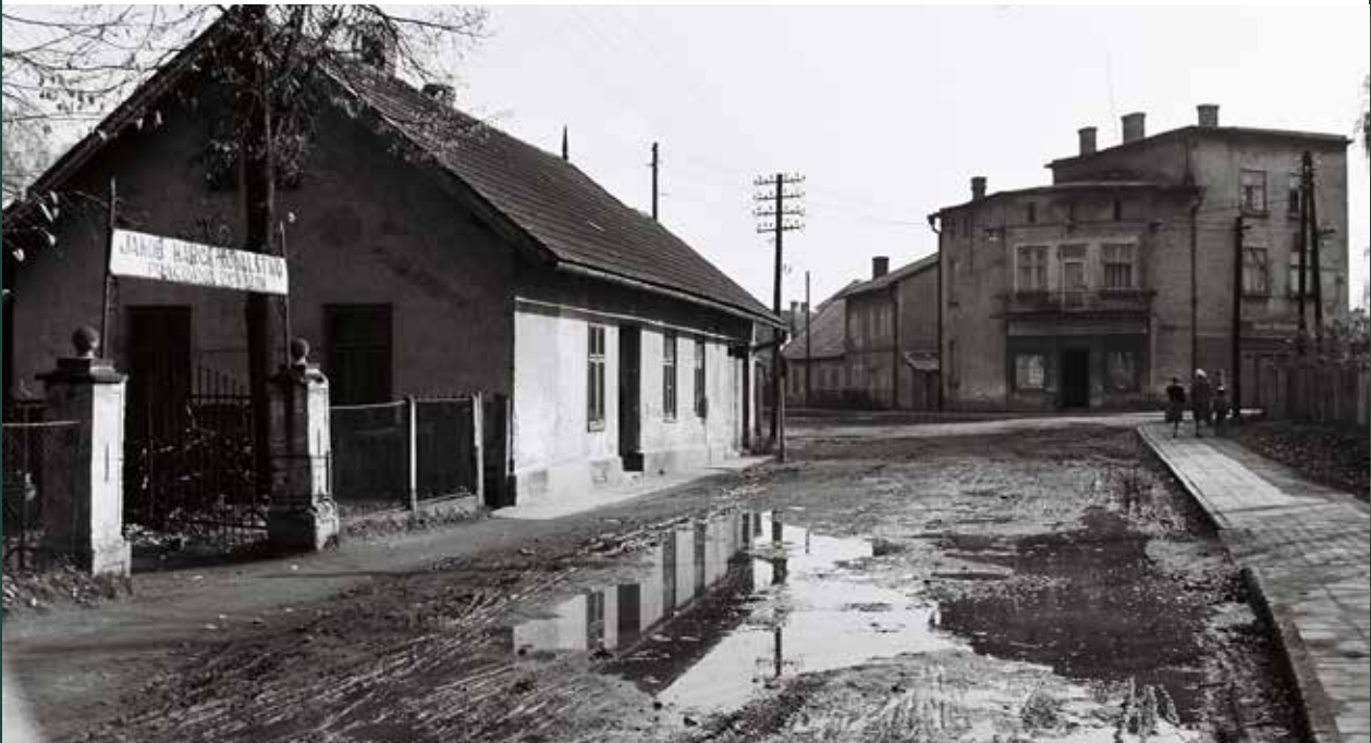
Ulica Ustrońska, 1957 rok