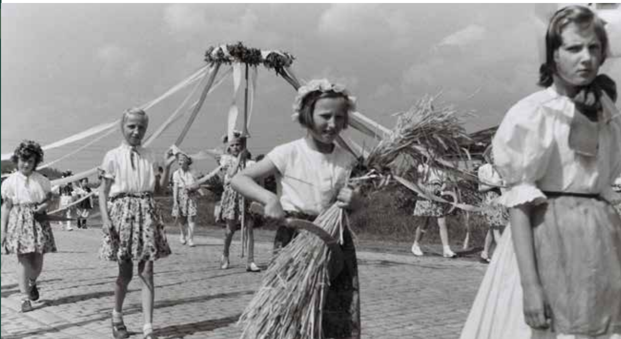
Pochód dzieci na festyn szkolny, 1961 rok