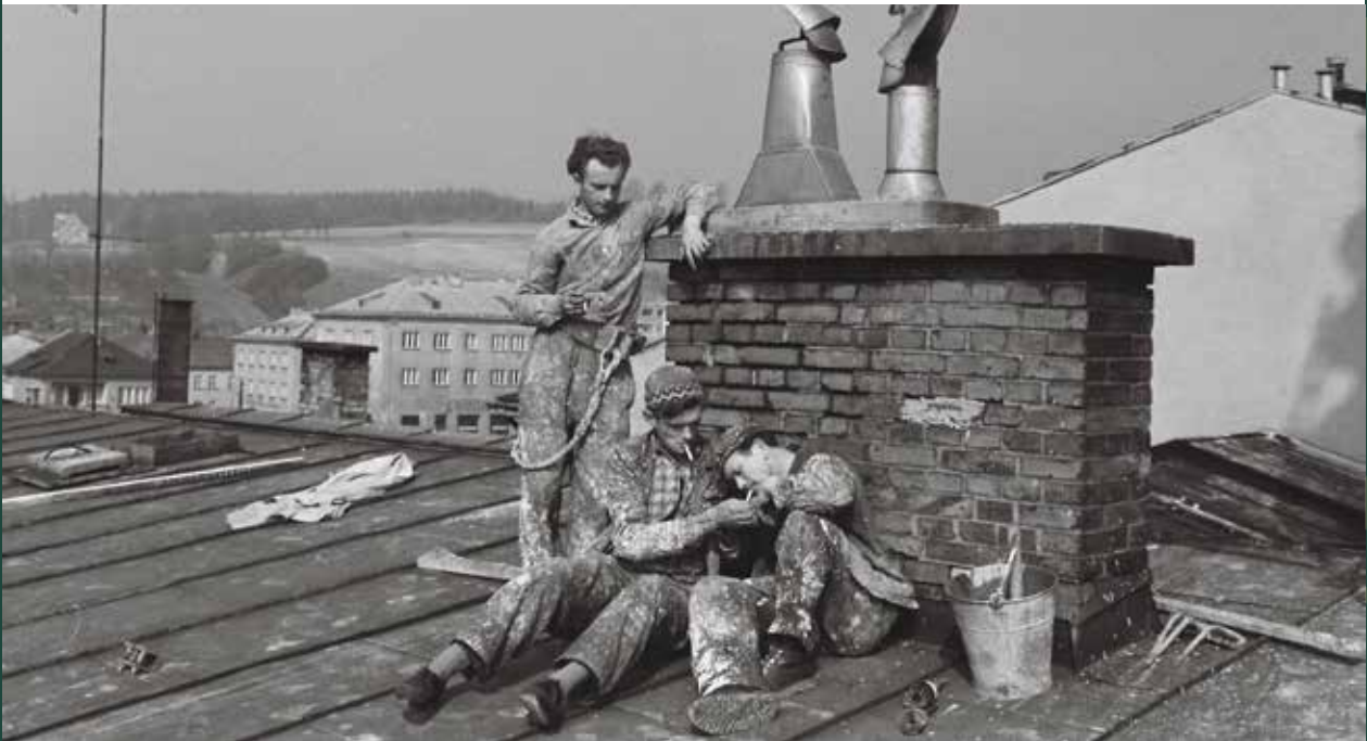
Remont Ratusza – naprawa dachu, 1967 rok