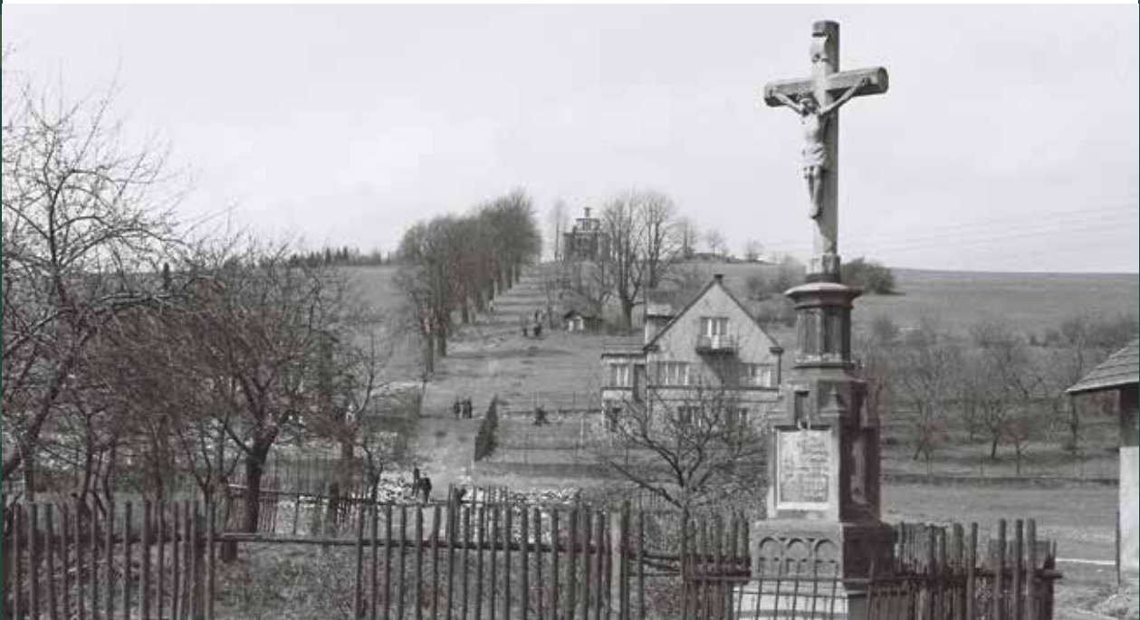
Widok na Kaplicówkę – krzyż na Groszówce, 1967 rok