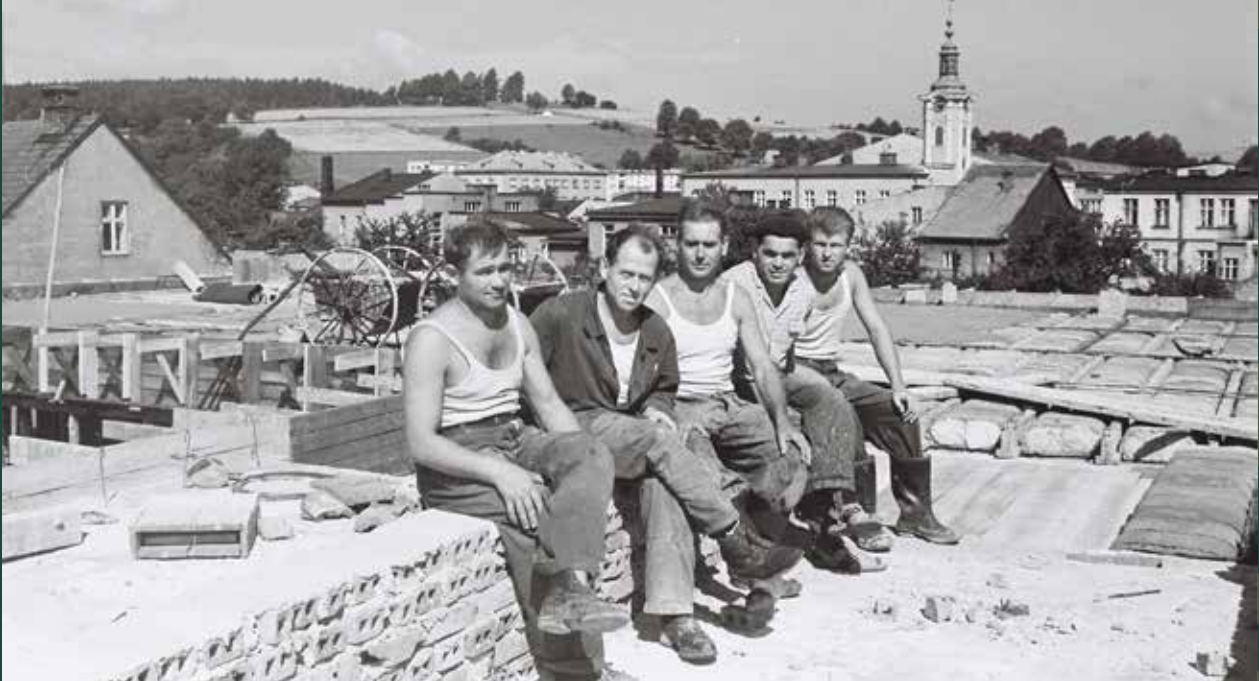
Budowa hotelu przy ulicy Ustrońskiej, 1967 rok