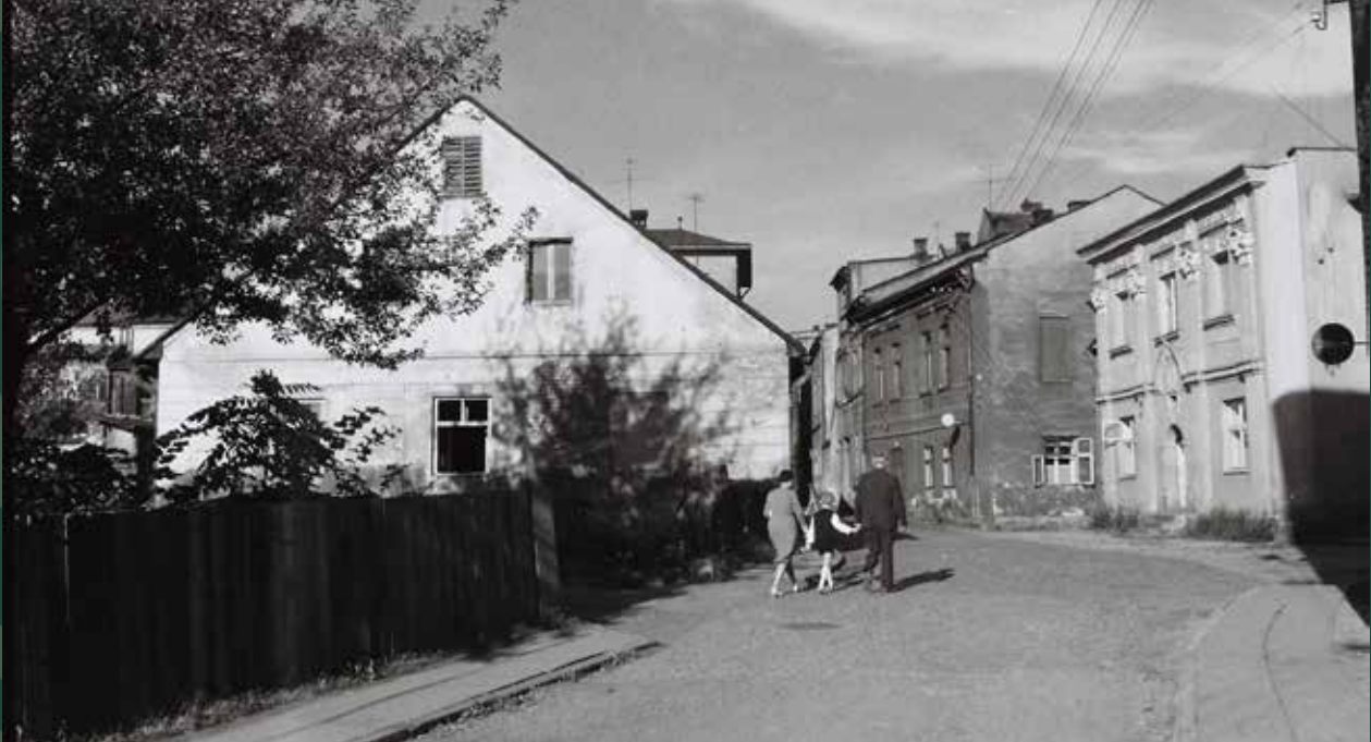
Ulica Fabryczna, 1963 rok