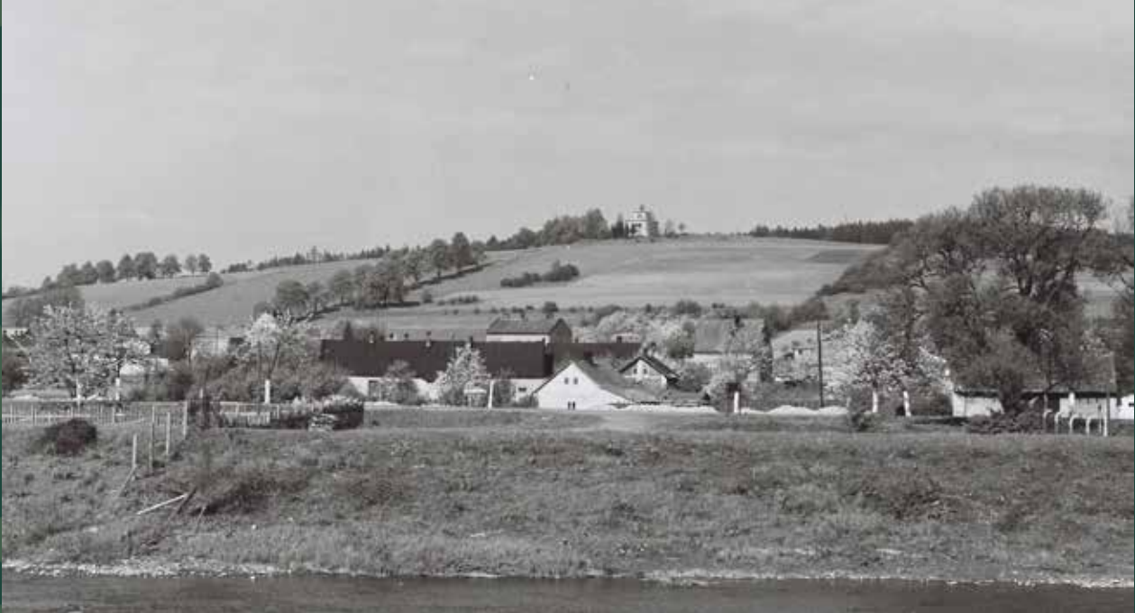
Widok na miasto z wału nad Wisłą, 1960 rok