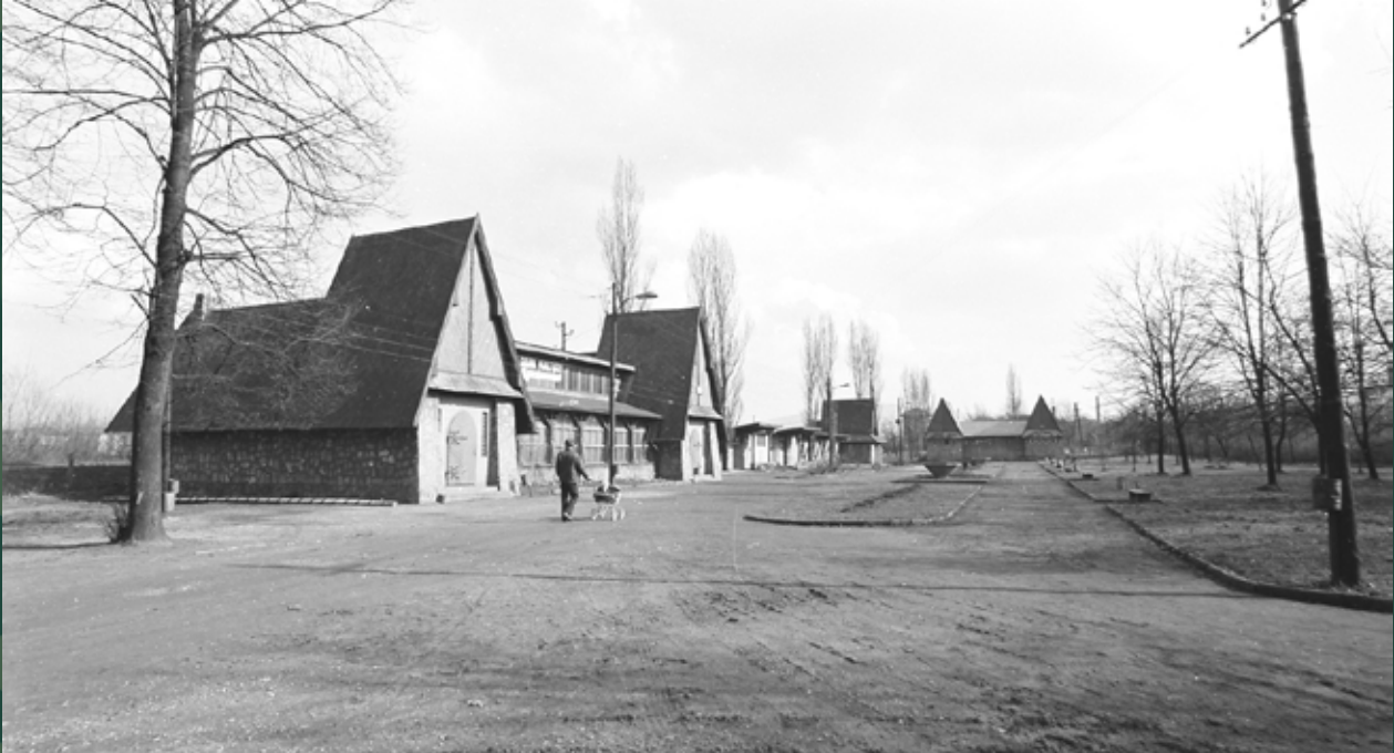
Park nad Wisłą – Dom Kultury „Tryton”, 1971 rok