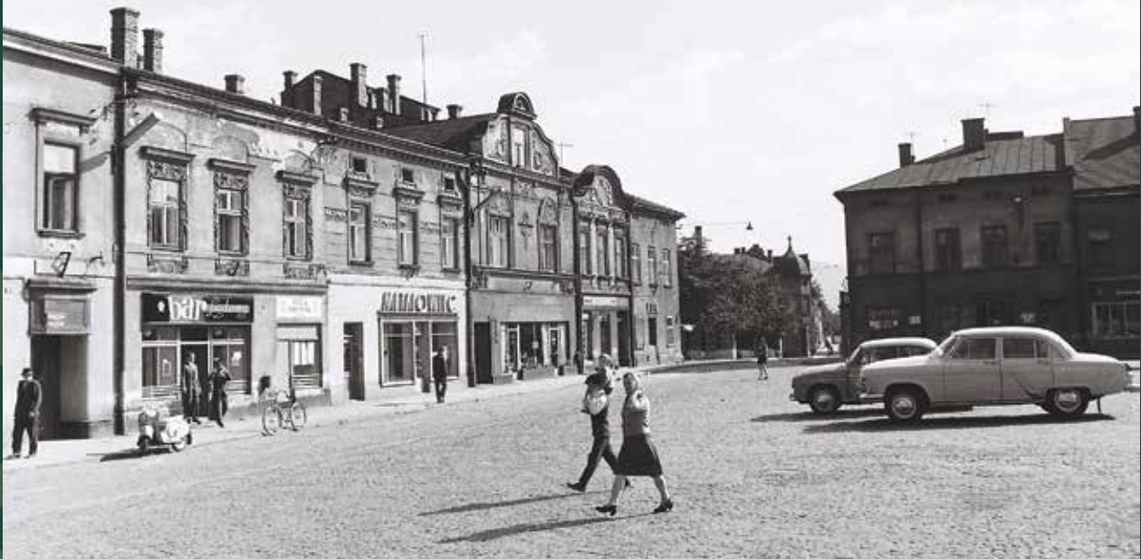
Rynek – południowo-wschodnia pierzeja – widok na ulicę Ustrońską, 1965 rok