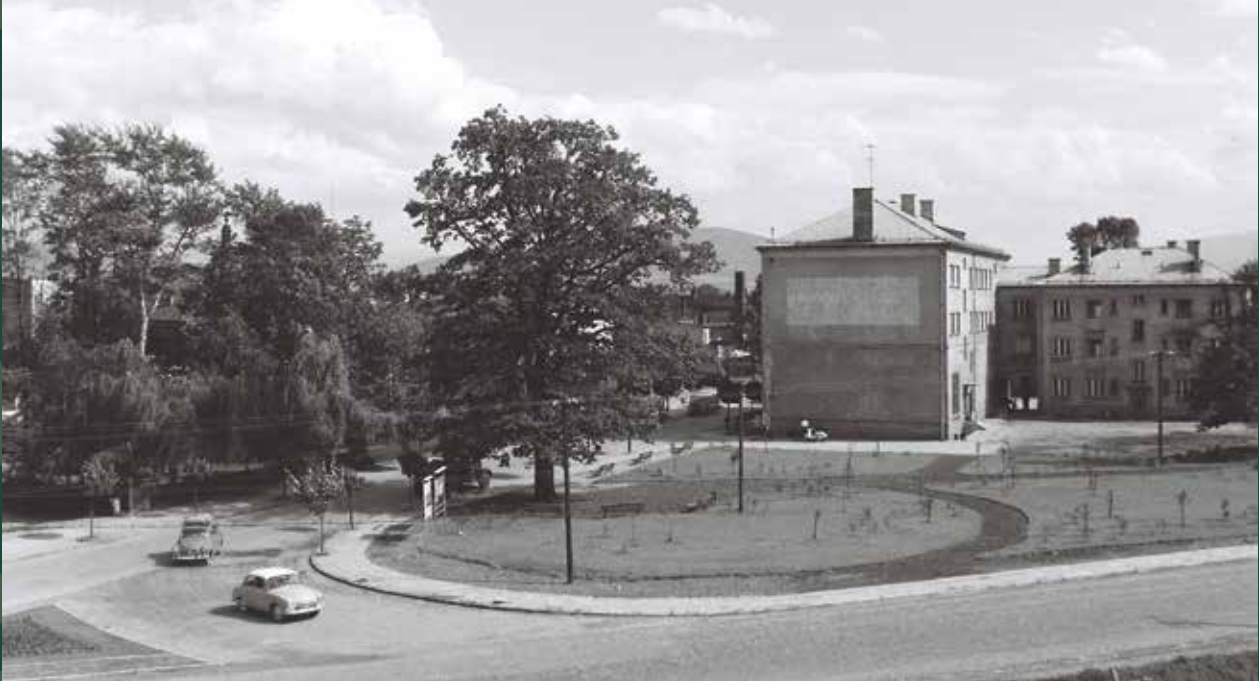
Ulica Objazdowa – park naprzeciwko kina, 1965 rok