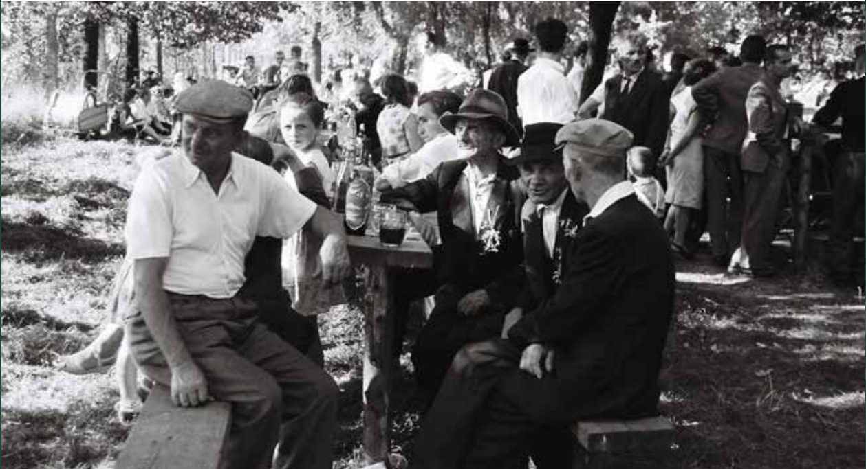
Zabawa dożynkowa w parku „Nad Wisłą”, 1961 rok