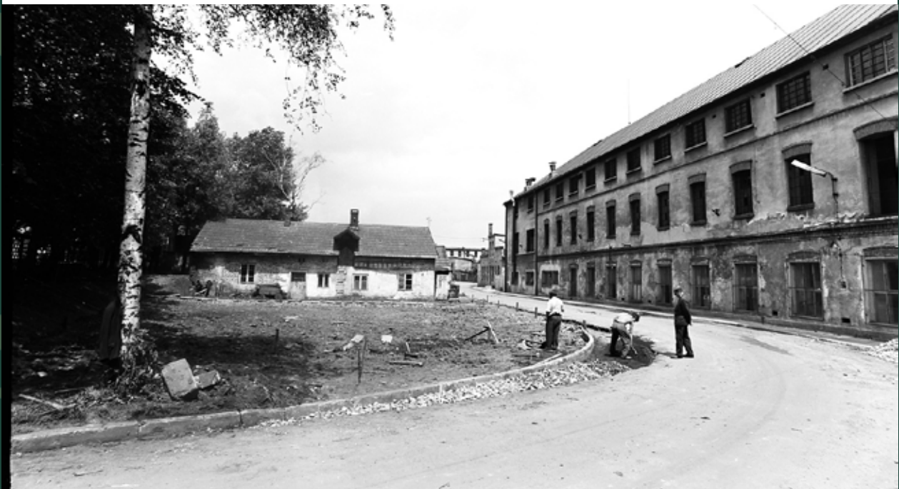
Ulica Garbarska – po prawej budynku garbarni, 1972 rok