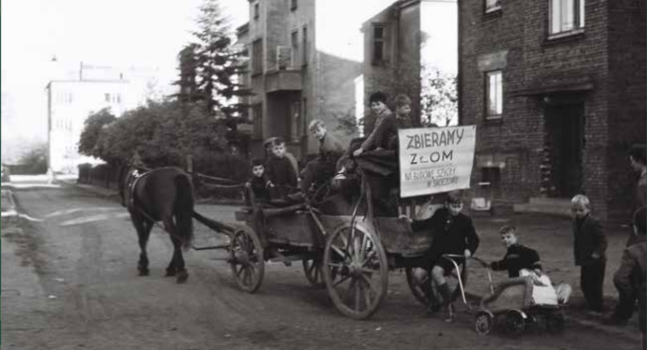
Dzieci na ulicy Łęgowej zbierające złom na rzecz budowy Szkoły Podstawowej nr 3, 1970 rok