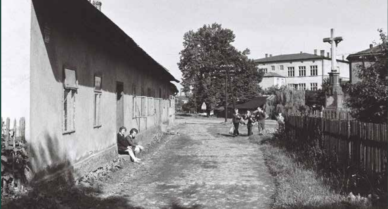
Groszówka przy ulicy Stalmacha, 1964 rok