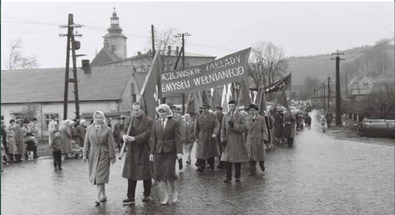
Obchody 1 Maja. W pochodzie pracownicy Skoczowskich Zakładów Przemysłu Wełnianego, 1960 rok