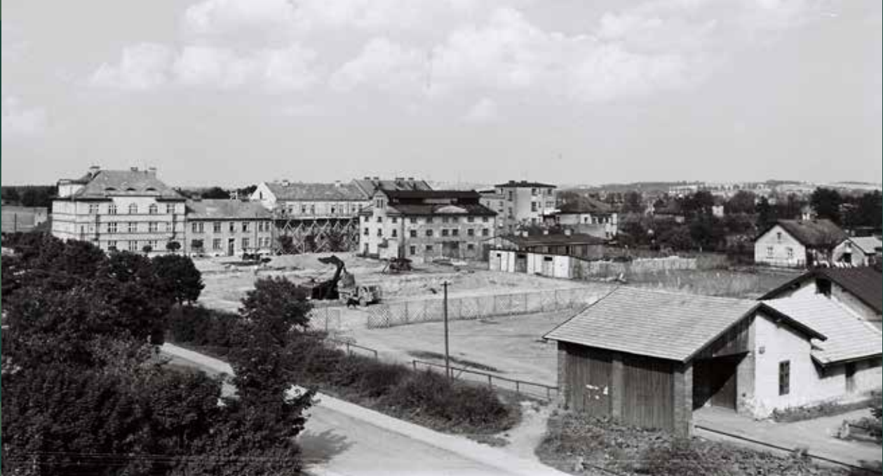
Budowa osiedla „Targowa”, widok od ulicy Mickiewicza, 1957 rok