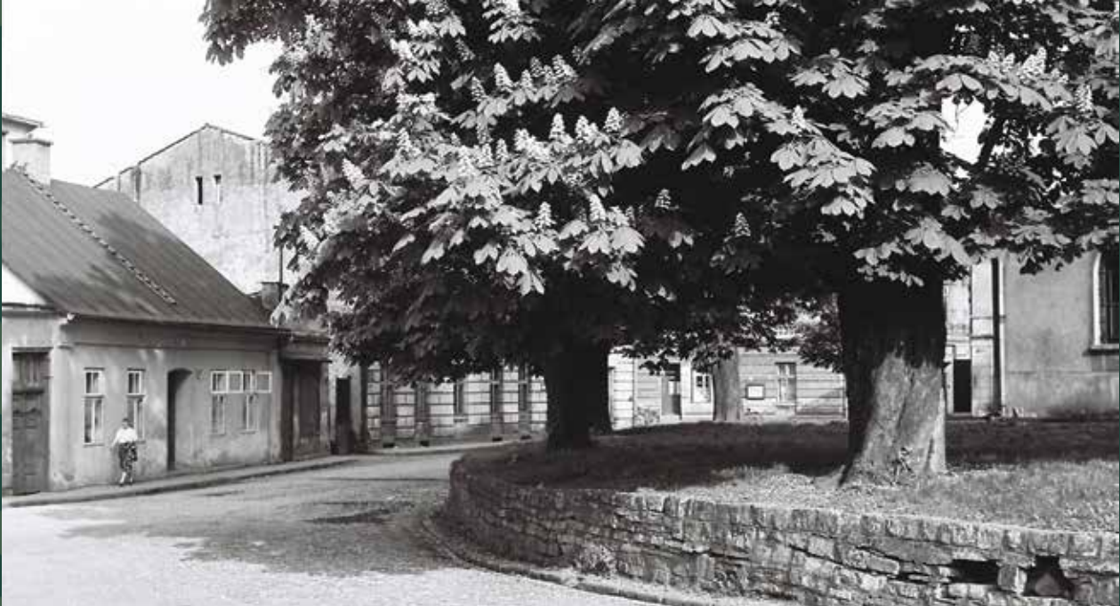
Ulica Stalmacha, 1958 rok