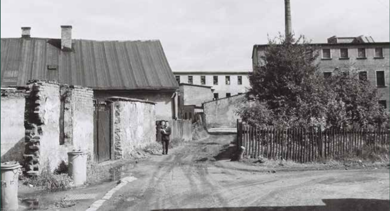
Ulica Garbarska w stronę ulicy Fabrycznej, 1964 rok