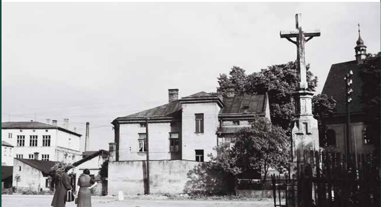
Krzyż na Groszówce, 1957 rok