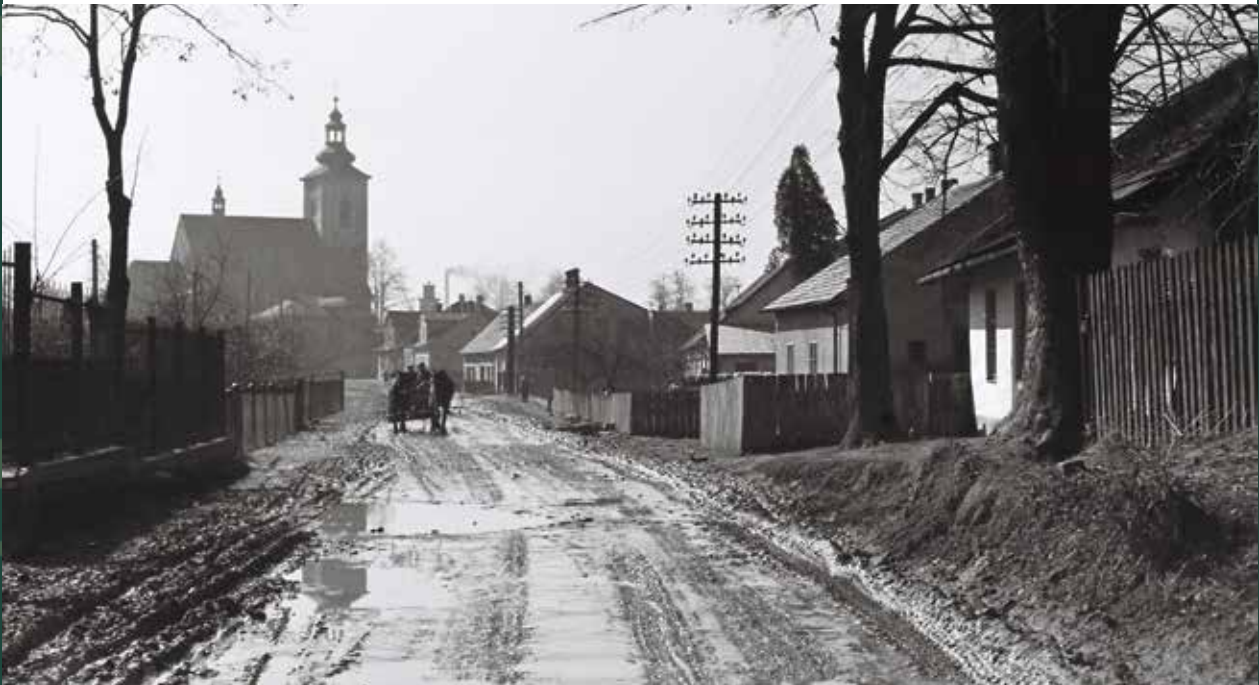
Ulica Stalmacha, 1956 rok