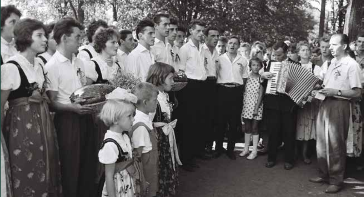
Uroczystości dożynkowe w parku „Nad Wisłą”, 1961 rok