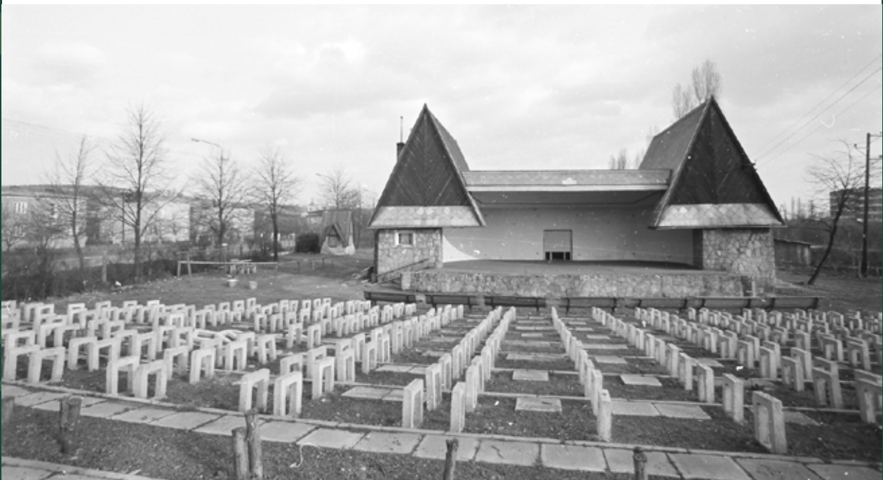
Amfiteatr w parku „Nad Wisłą”, 1971 rok