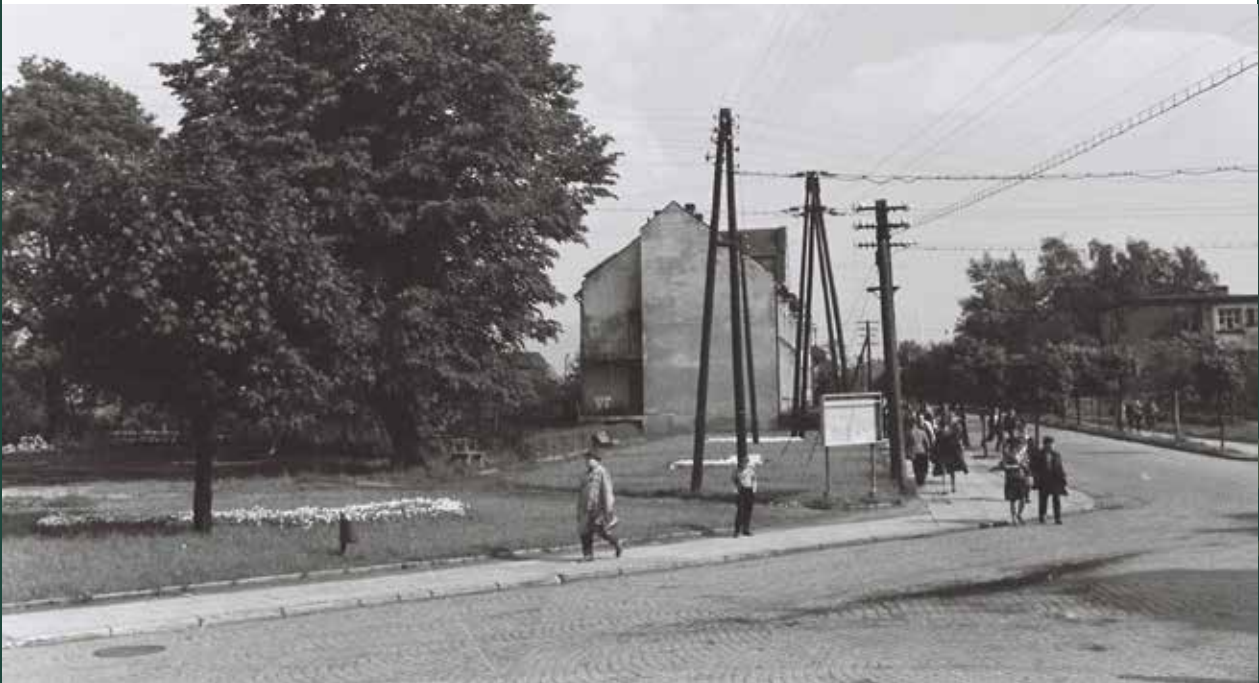
Ulica Mickiewicza do dworca kolejowego, skrzyżowanie z ulicą Targową, 1965 rok