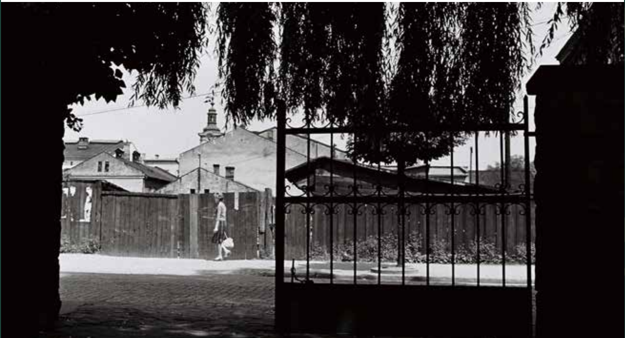
Widok na ulicę Mickiewicza z budynku Stritzkich, nieistniejąca brama przy budynku nr 10, 1959 rok