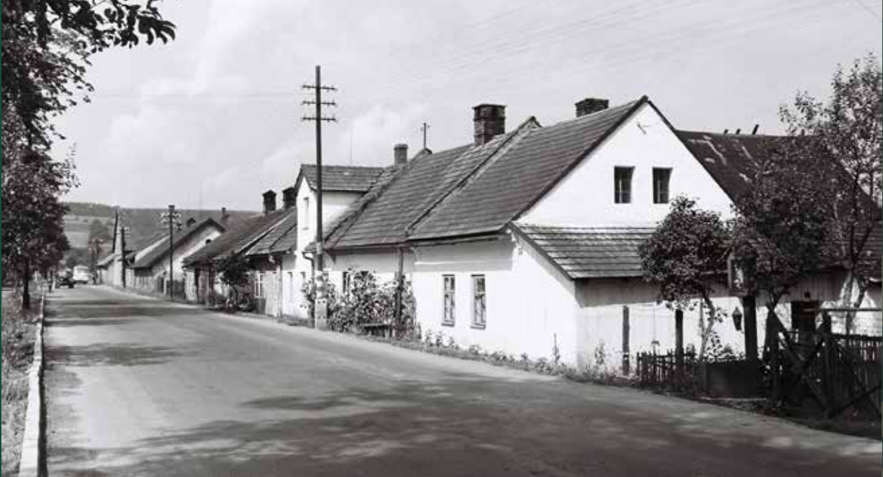
Zabawa, ulica Bielska w stronę miasta, 1960 rok