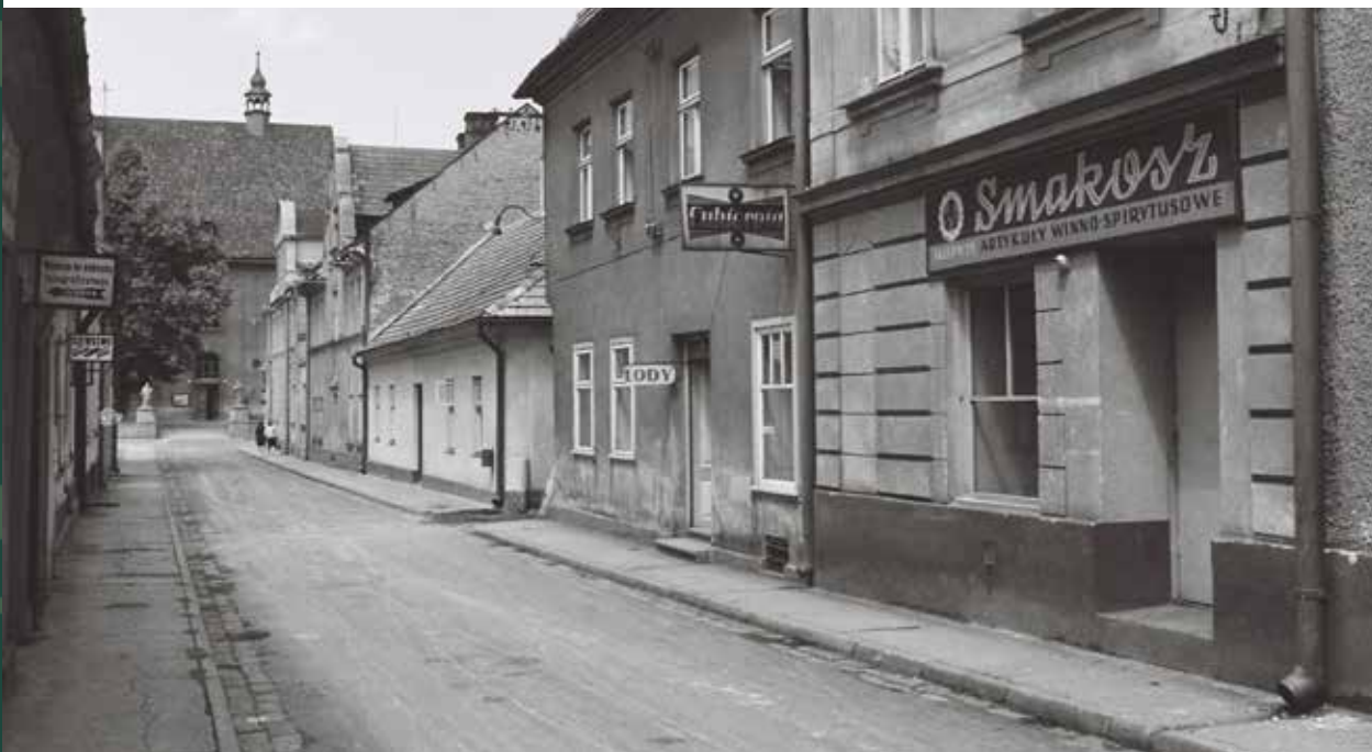
Ulica Kościelna w stronę parafii i kościoła, 1959 rok