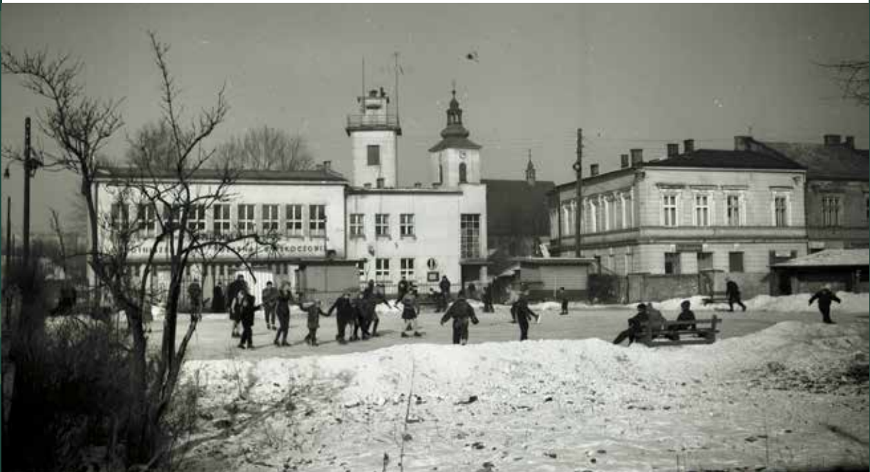
Lodowisko na Małym Rynku, 1959 rok