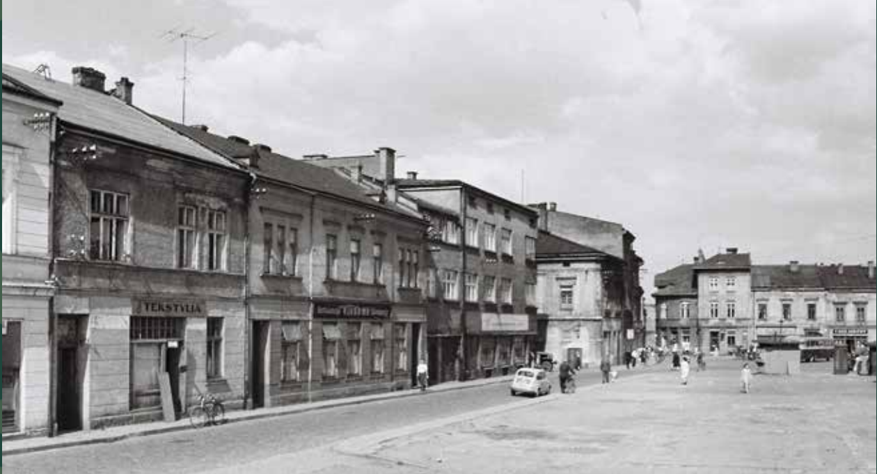
Ulica Cieszyńska w stronę Rynku, 1956 rok