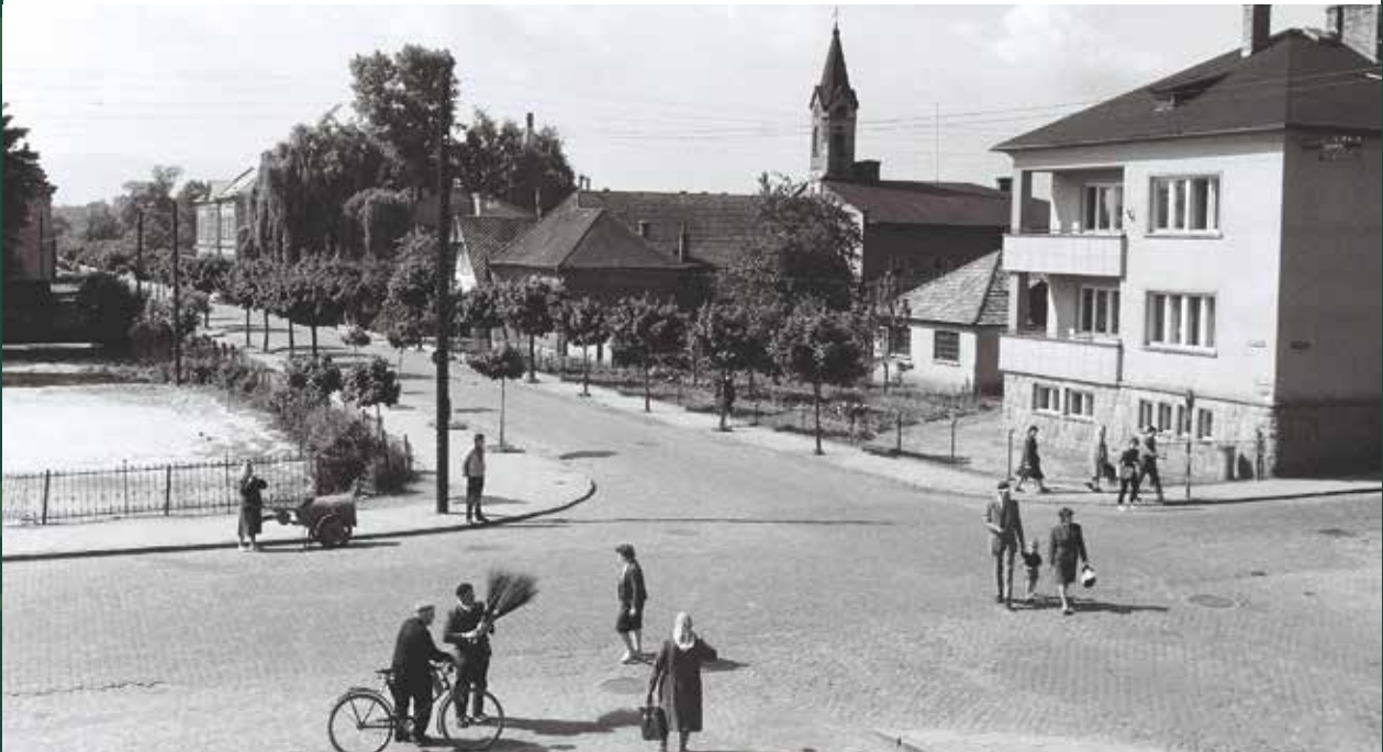
Skrzyżowanie ulic: Mickiewicza i Cieszyńskiej, 1963 rok