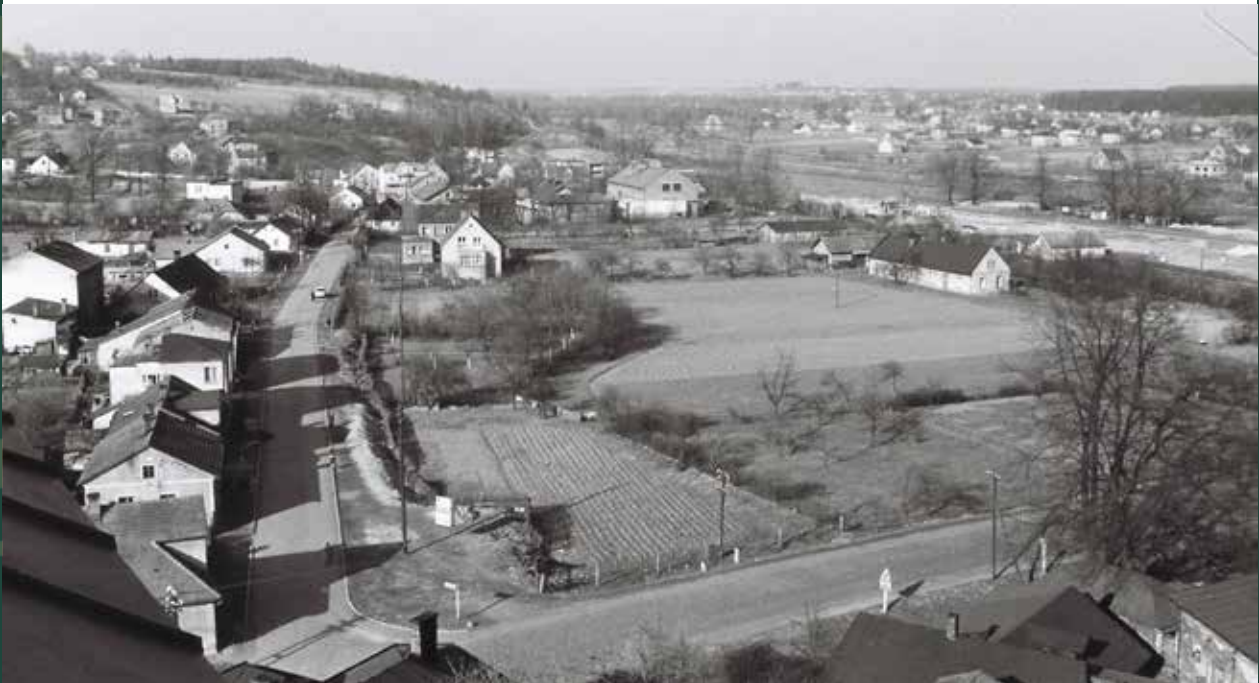
Widok z wieży kościoła katolickiego na ulicę Stalmacha, 1967 rok