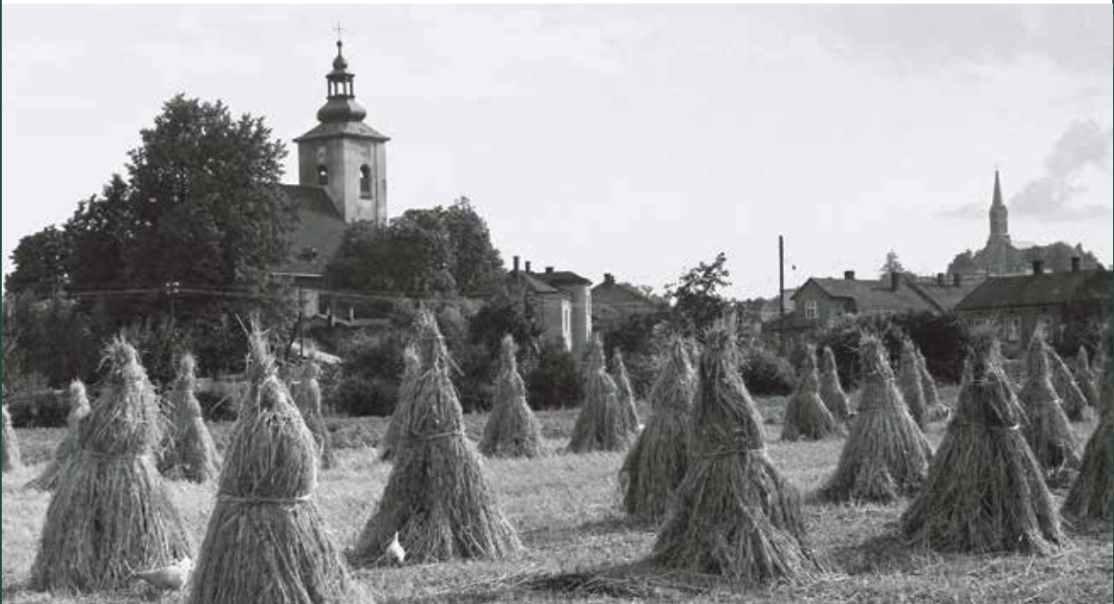
Snopki zboża na Groszówce, 1968 rok