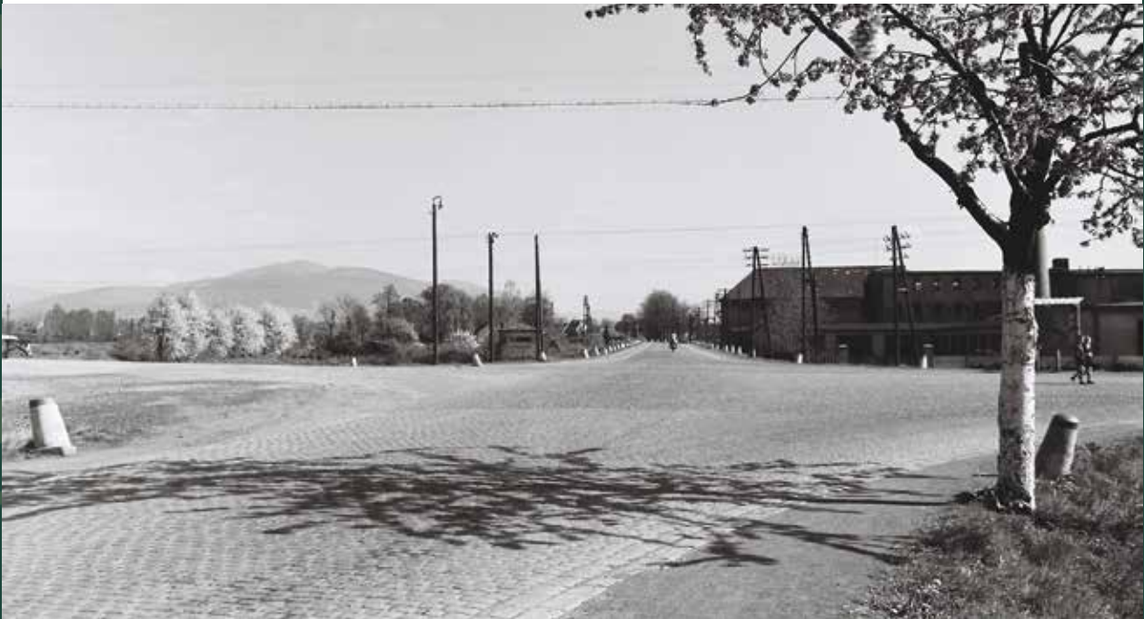
Skrzyżowanie dróg: Katowice-Wisła, Cieszyn-Bielsko, 1960 rok