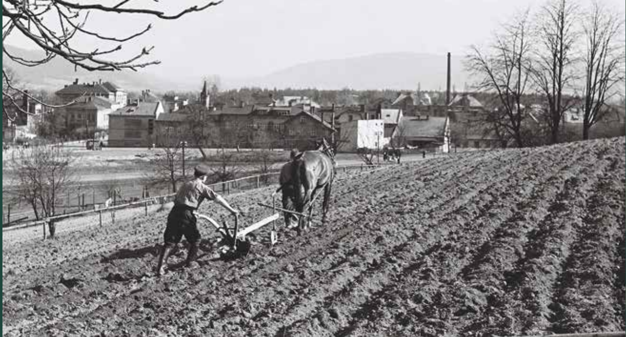
Orka pod Kaplicówką, 1958 rok