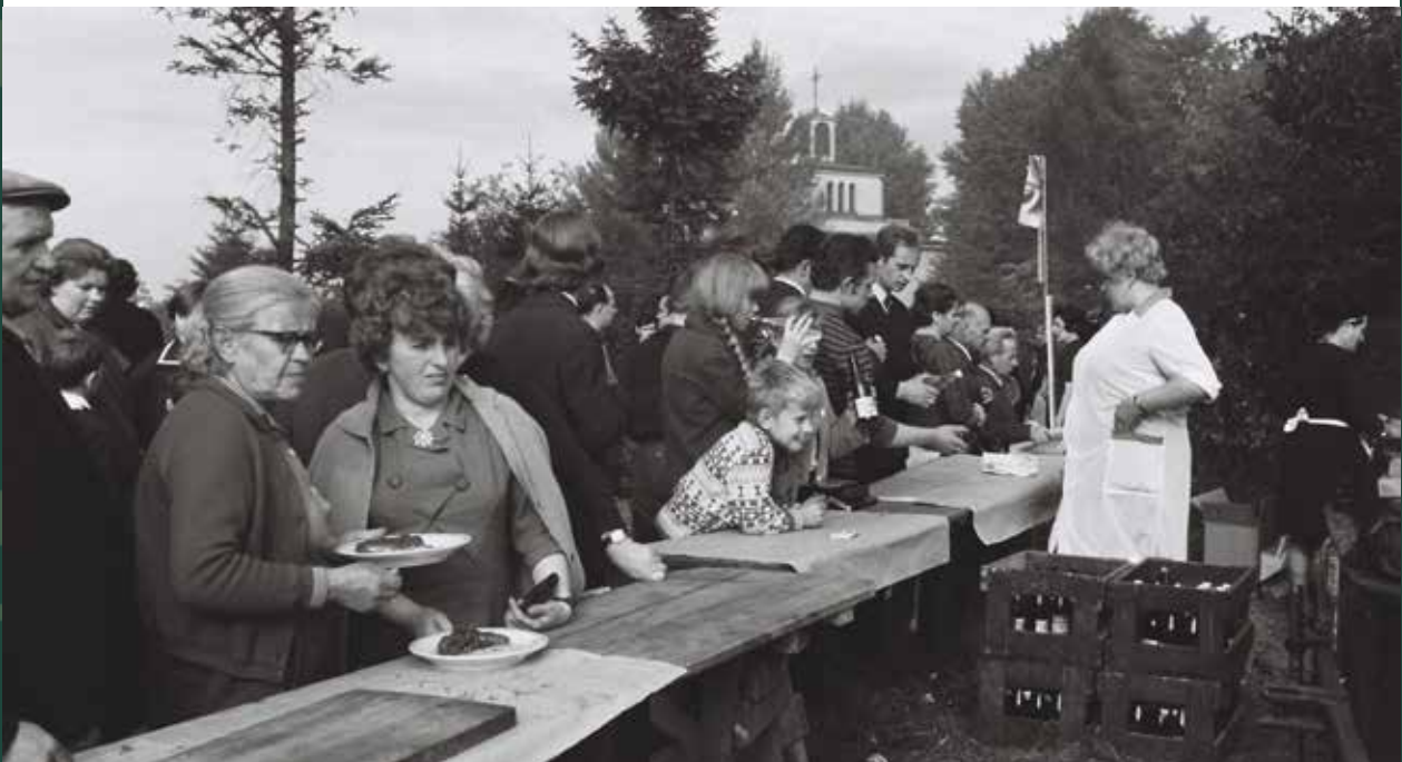
„Pieczenie Barana” na Kaplicówce, 1969 rok