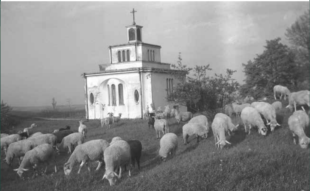
Kaplica św. Jana Sarkandra na wzgórzu Kaplicówka, 1961 rok