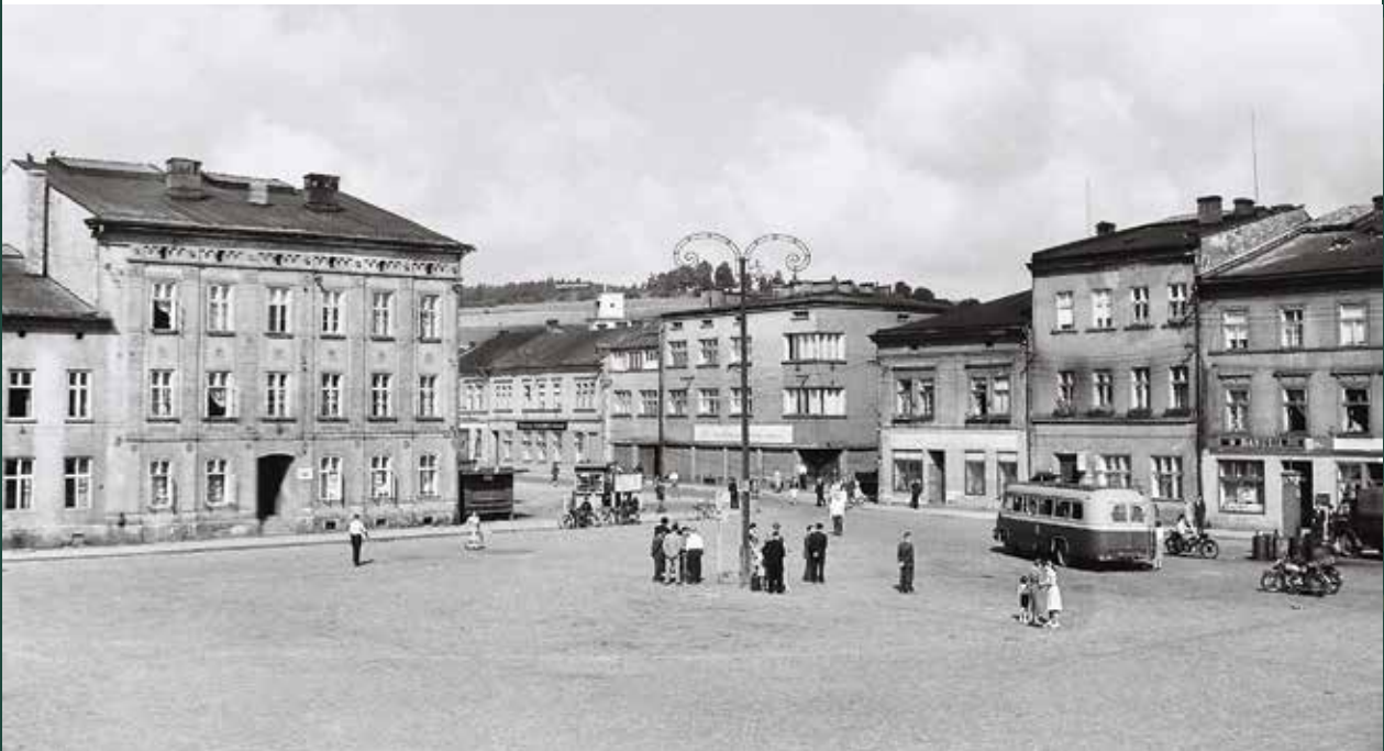
Rynek – północno-zachodnia pierzeja, wlot w ulicę Cieszyńską, 1957 rok