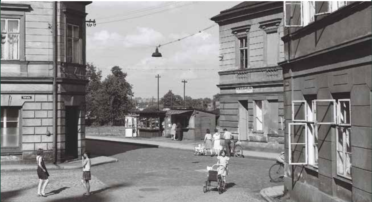
Widok na ulicę Bielską z ulicy Kościelnej, 1965 rok