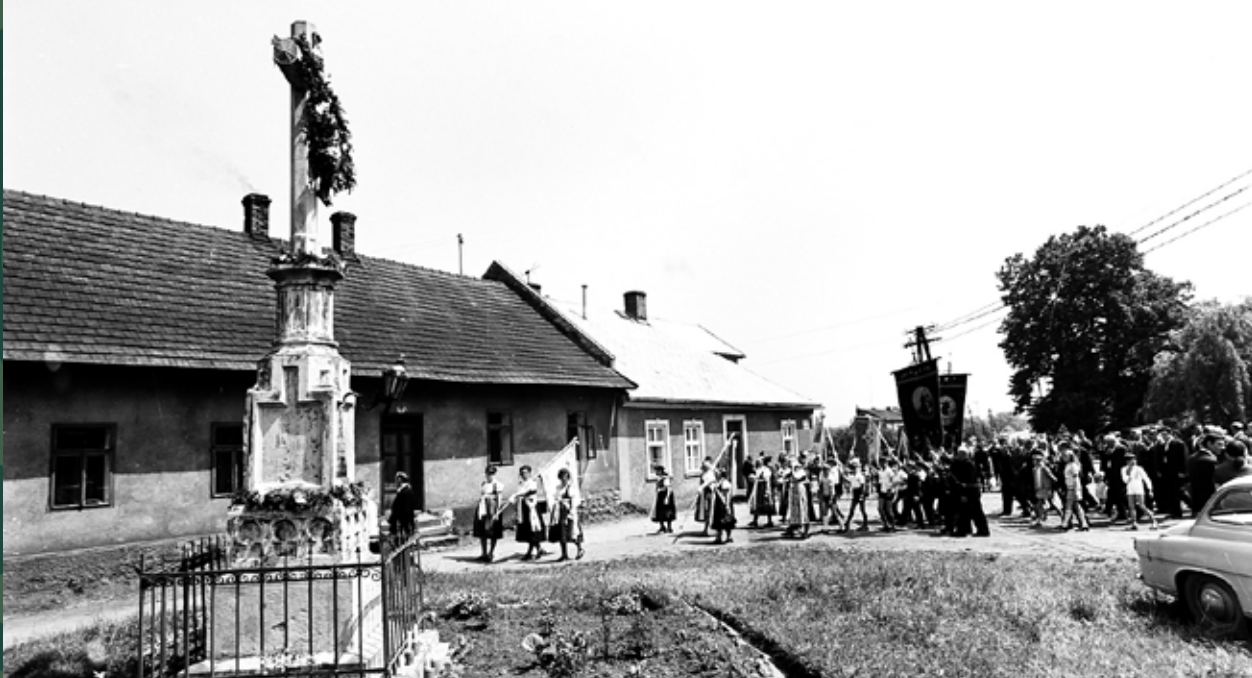
Procesja na Kaplicówkę przy krzyżu na Groszówce, 1972 rok