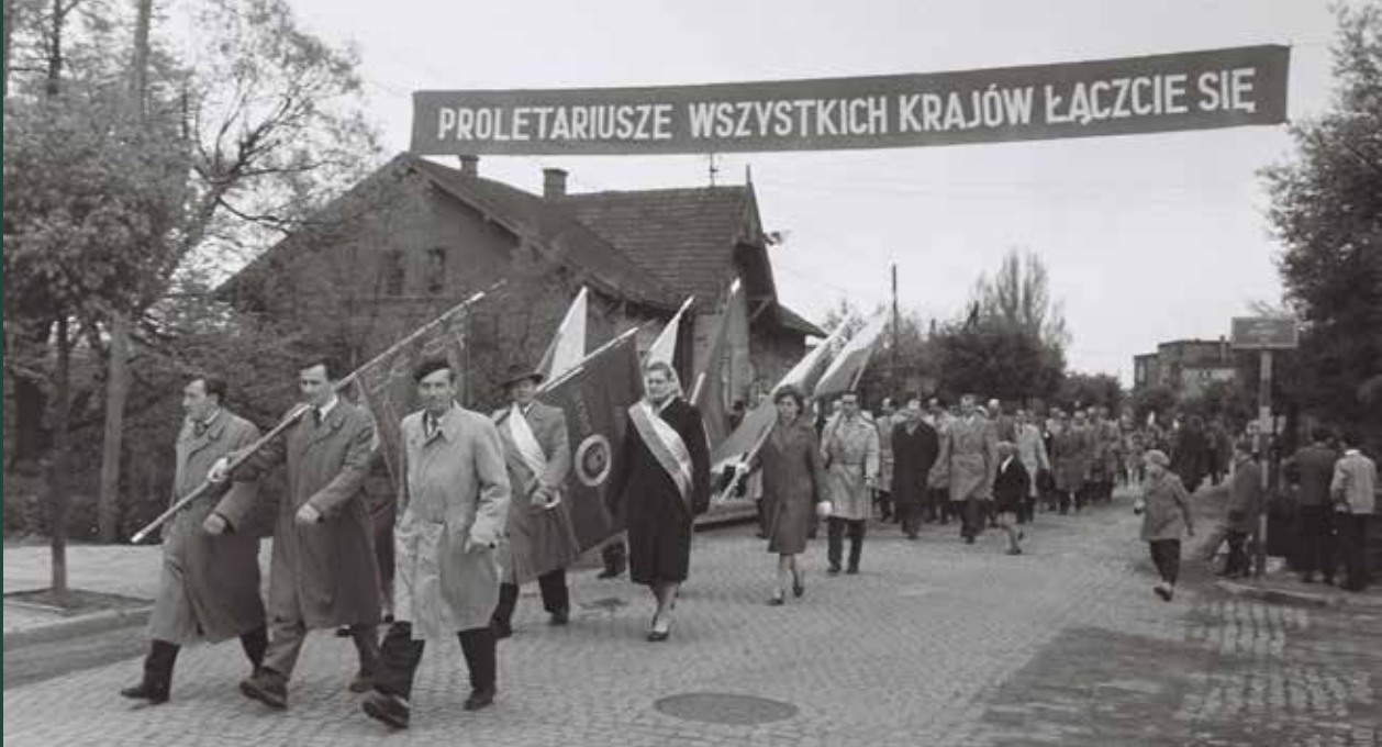
Obchody 1 Maja, manifestacja na ulicy Mickiewicza, 1962 rok