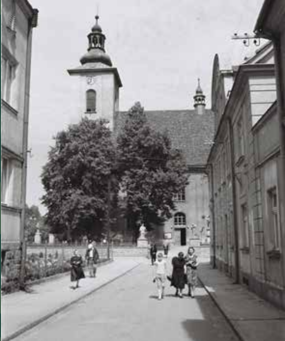
Widok na kościół katolicki z ulicy Kościelnej, 1961 rok