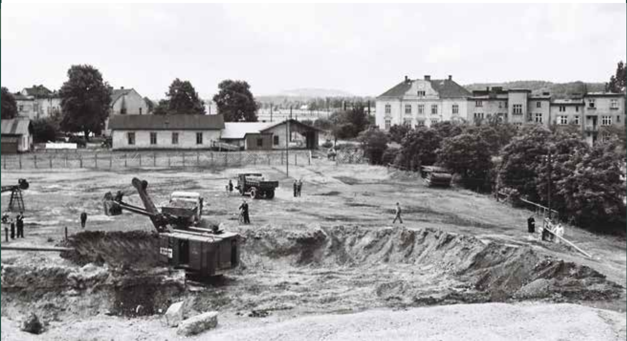
Budowa osiedla „Targowa”, 1957 rok