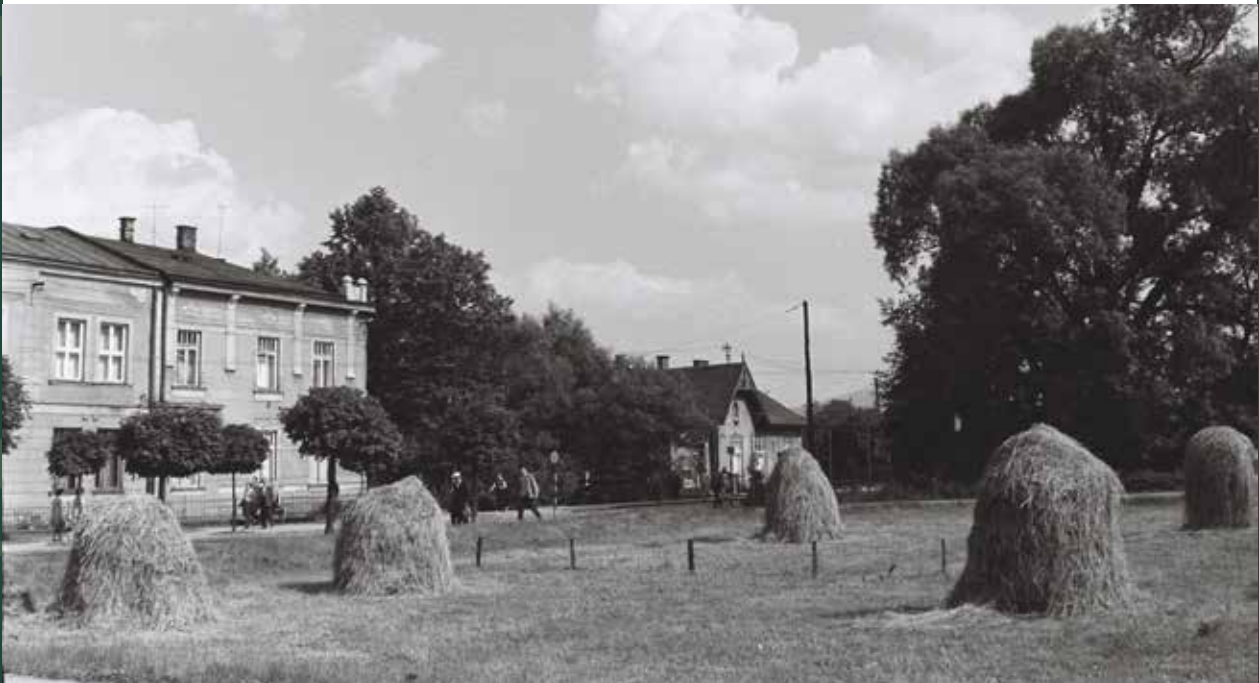
Ulica Mickiewicza i kopki siana obok mostu na Bładnicy, 1965 rok