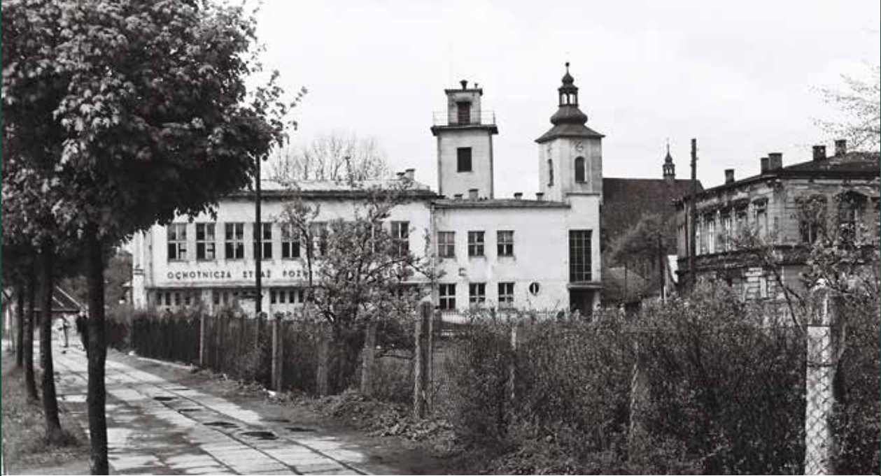
Ulica Mickiewicza – widok na strażnicę Ochotniczej Straży Pożarnej, 1956 rok