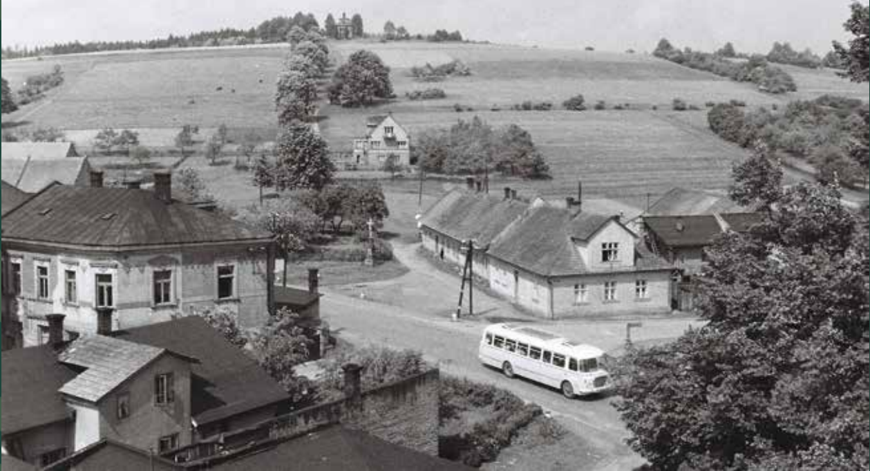
Widok na Kaplicówkę – po prawej Groszówka i skrzyżowanie z ulicą Stalmacha, 1964 rok