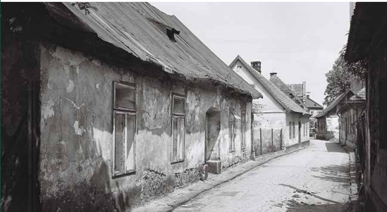
Ulica Wałowa w stronę kościoła katolickiego pw. św. Ap. Piotra i Pawła, 1958 rok