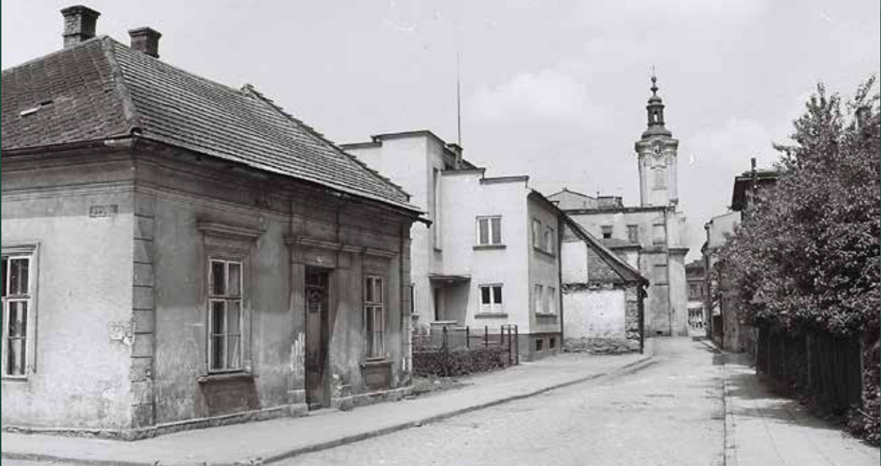
Ulica Mennicza w stronę Rynku, 1958 rok