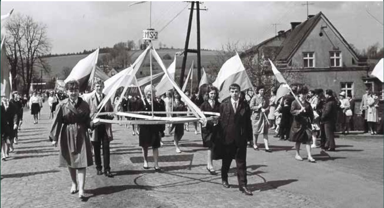
Pochód na ulicy Objazdowej, 1 maja 1965 rok