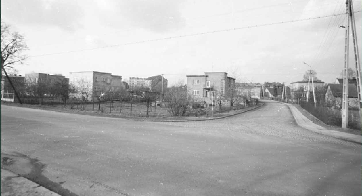
Wylot ulicy Ustrońskiej na ulicę Wiślańską, 1971 rok