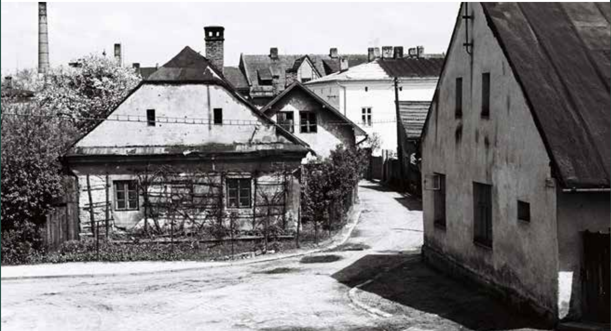
Skrzyżowanie ulic: Polnej, Szkolnej i Menniczej, 1956 rok