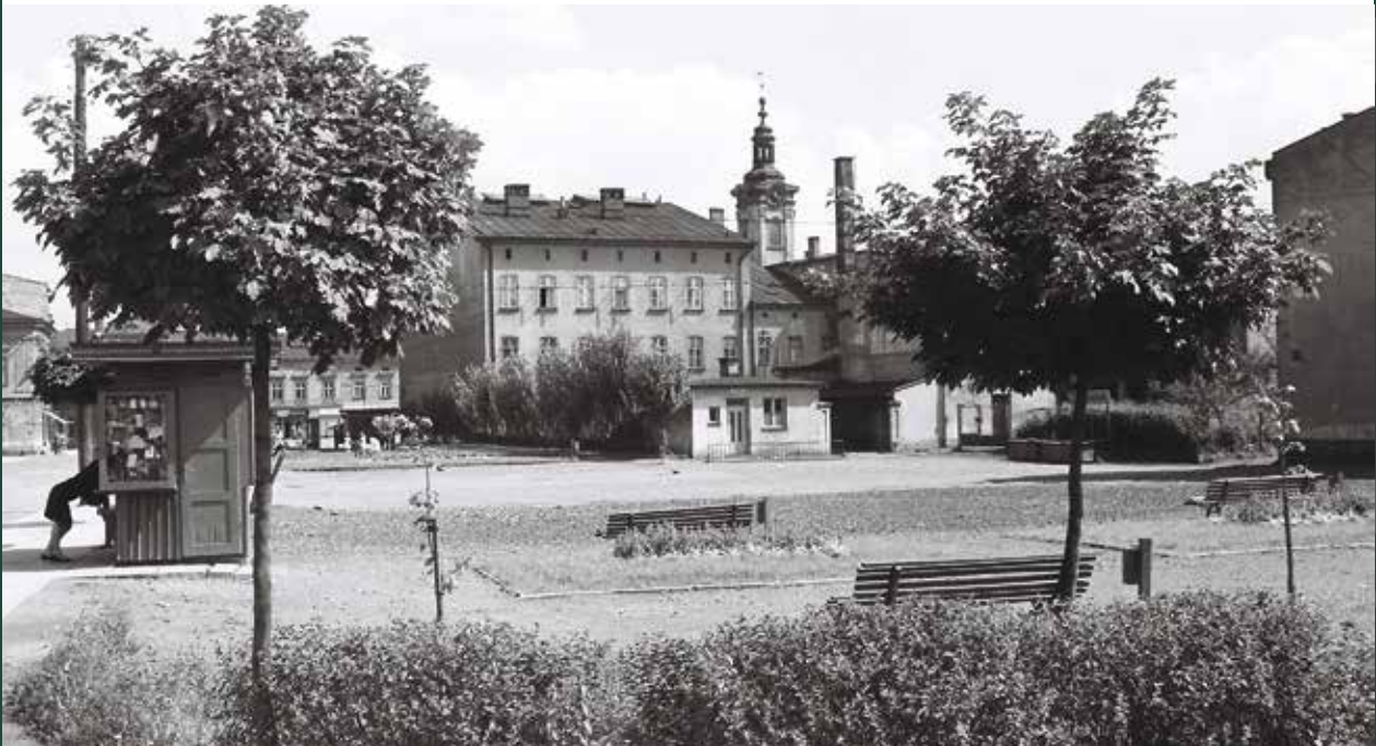
Skwer na Małym Rynku – miejsce po skoczowskiej synagodze, 1964 rok