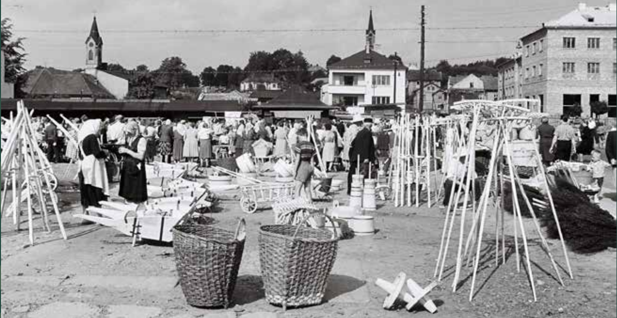
Targ na Małym Rynku podczas I Dni Skoczowa, 1967 rok