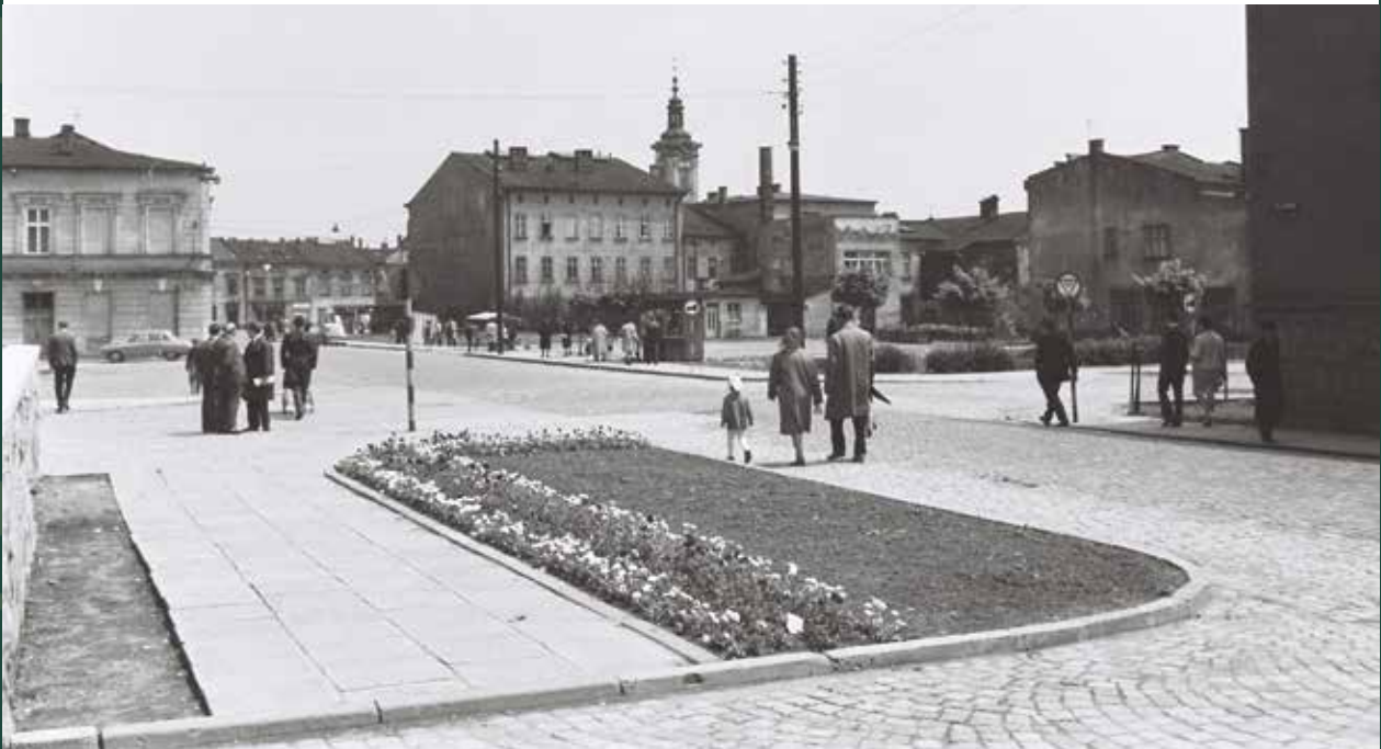
Ulica Cieszyńska – widok na Mały Rynek, 1965 rok