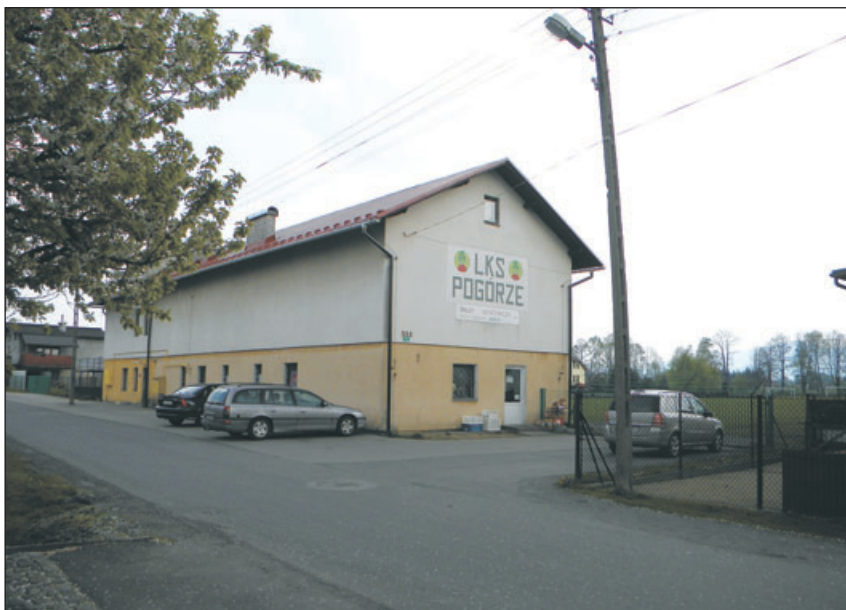
Siedziba LKS Pogórze.