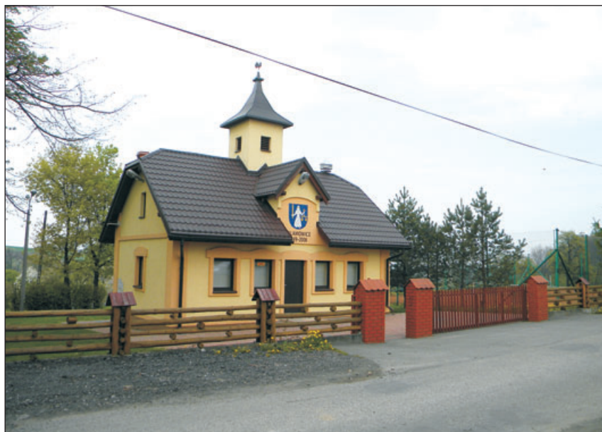
Były budynek strażnicy OSP, obecnie sala spotkań mieszkańców wsi.