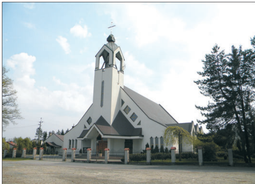
Kościół Najświętszej Marii Panny Królowej Polski.