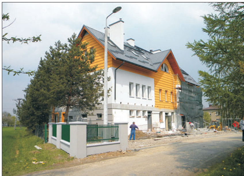
Dom Rolnika to miejsce spotkań mieszkańców wsi.