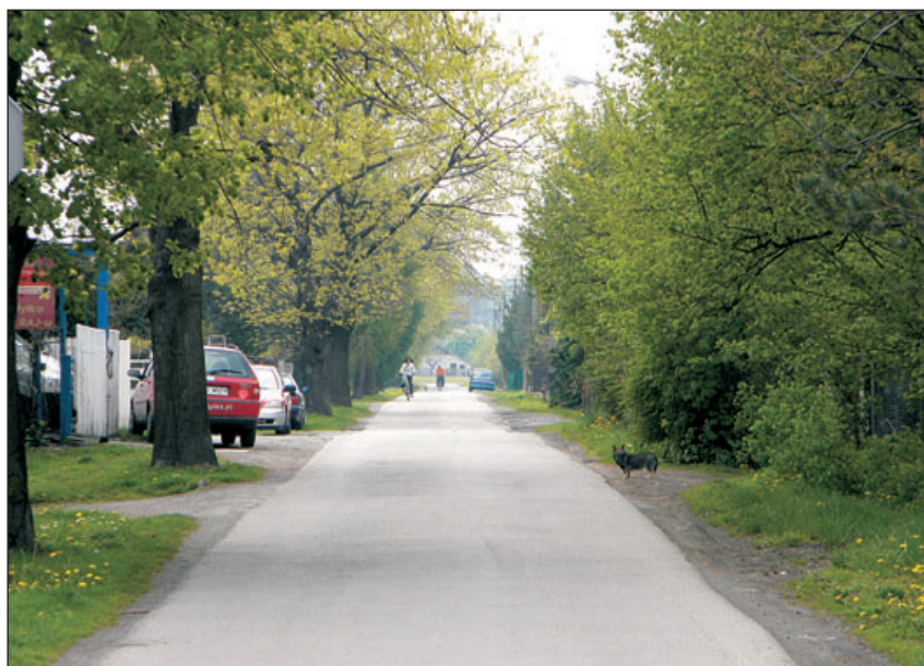
Jedna z dróg w sołectwie.