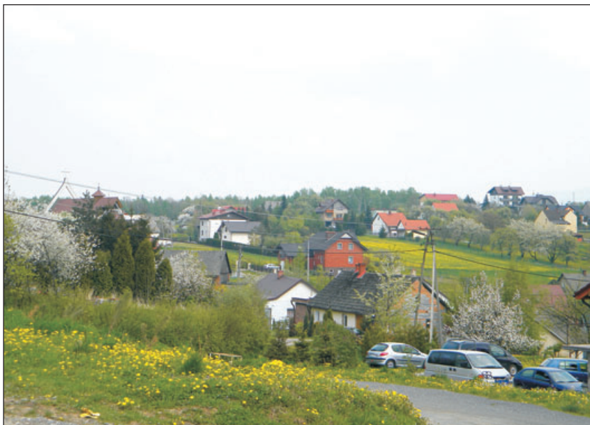
Widok na sołectwo.