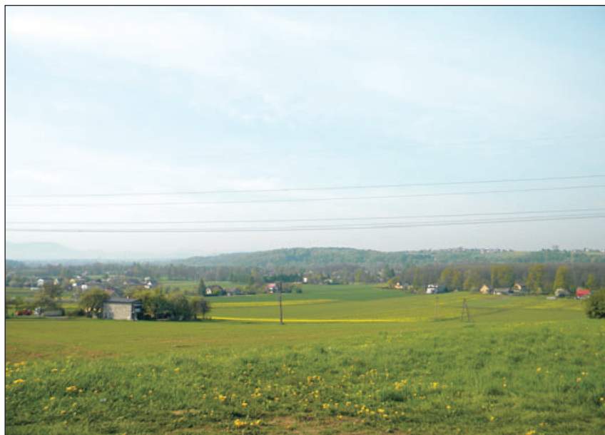
Widok na Kiczyce z Kępy Winogradzkiej.