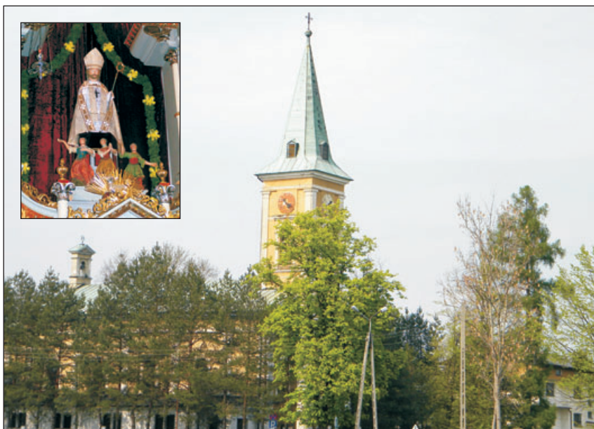
Sanktuarium św. Mikołaja w Pierścęu oraz figura św. Mikołaja.