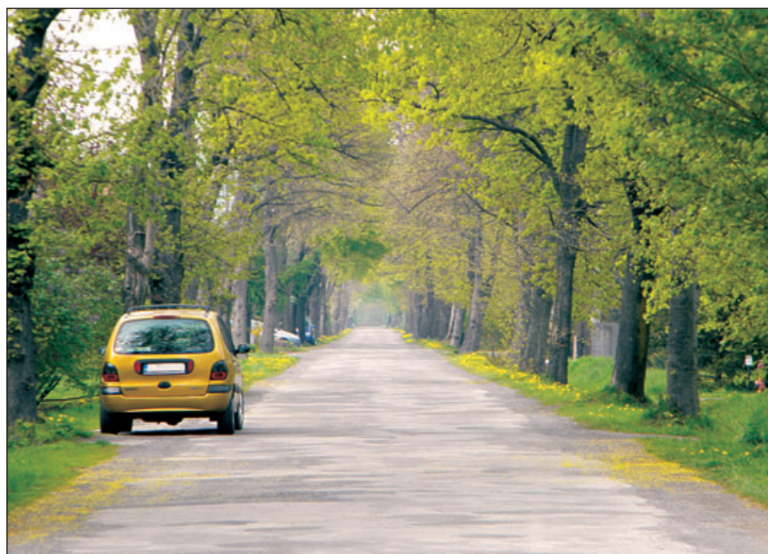
W Bładnicach nie brakuje uroczych zakątków.