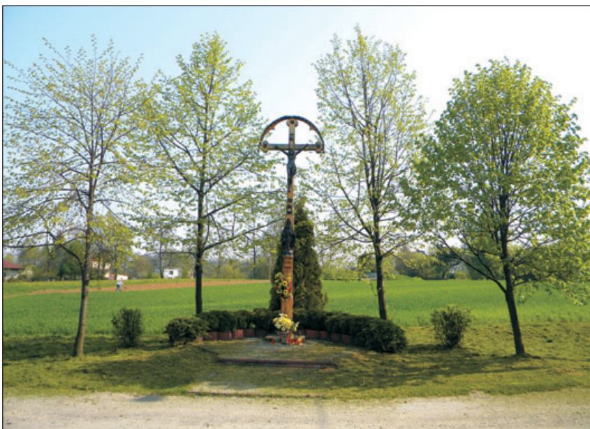
Krzyż w Kiczycach.

W Kiczycach znajduje się 12 obiektów objętych ochroną konserwatorską. Należą do nich budynki mieszkalne oraz gospodarcze.