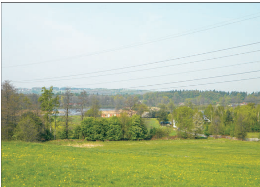
Widok na stawy.