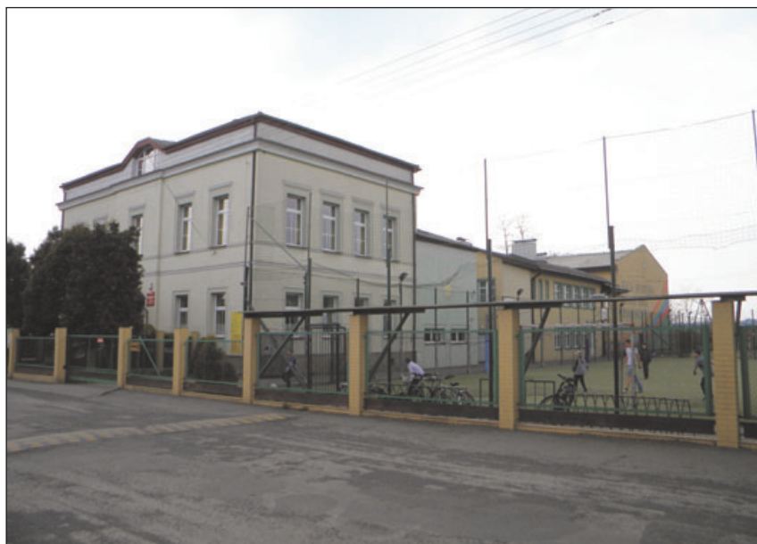
Zespół Szkół nr 5 im. Jana Marka.