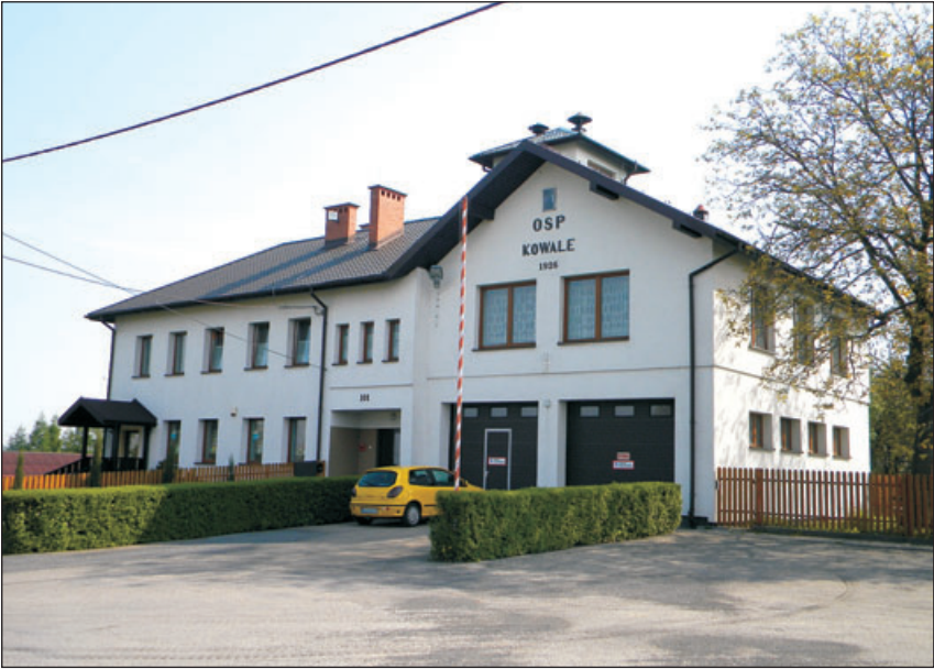
Strażnica OSP w Kowalach.