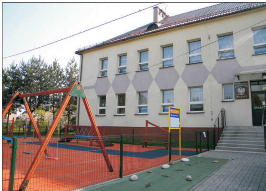
Szkoła Podstawowa nr 4 im. Orła Białego w Kiczycach.