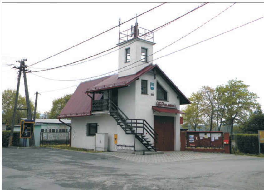
OSP w Bładnicach.