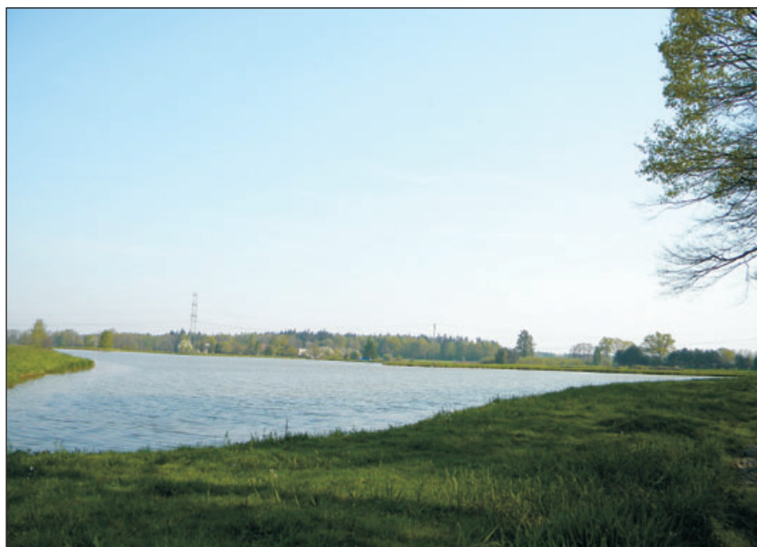
Widok na stawy.