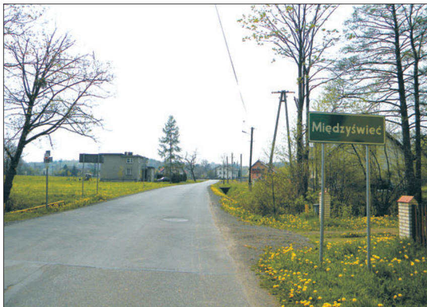
Droga prowadząca do Międzywiecia.