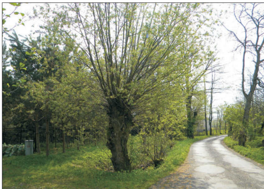
Wierzba rosnąca przy jednej z dróg w sołectwie.