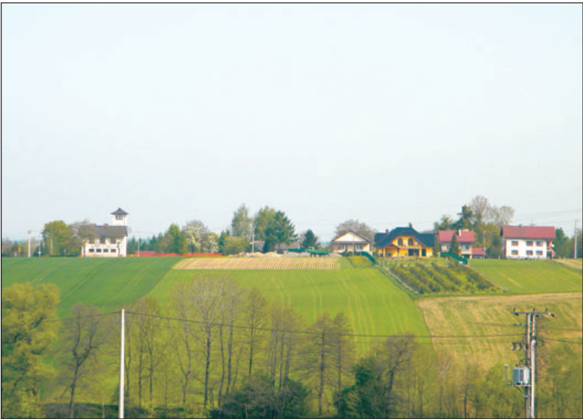
Widok na wieś.