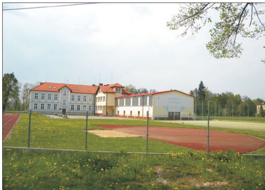
Widok na budynki szkolne i halę sportową.