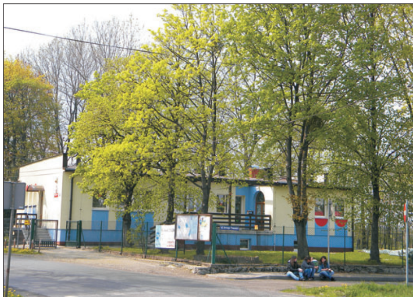
Przedszkole w Pierścicu.