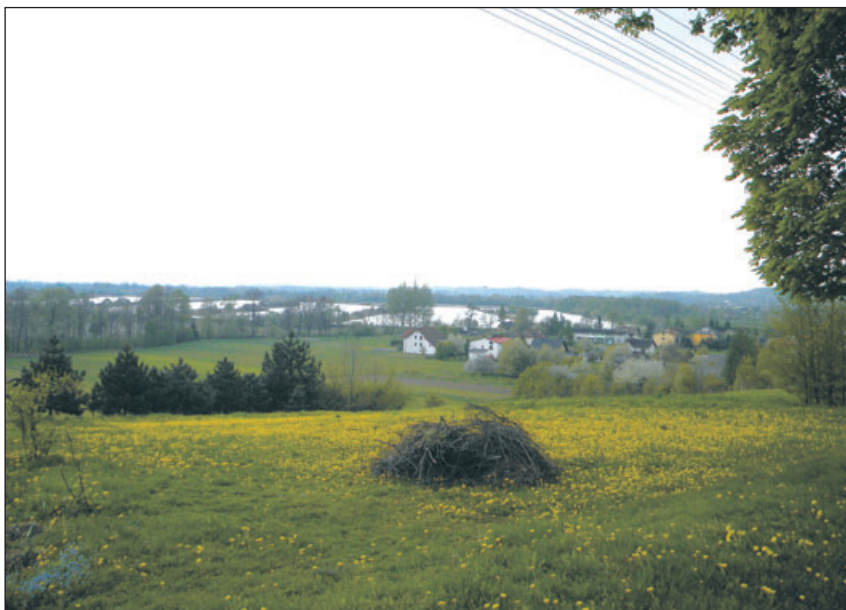
Widok na stawy.