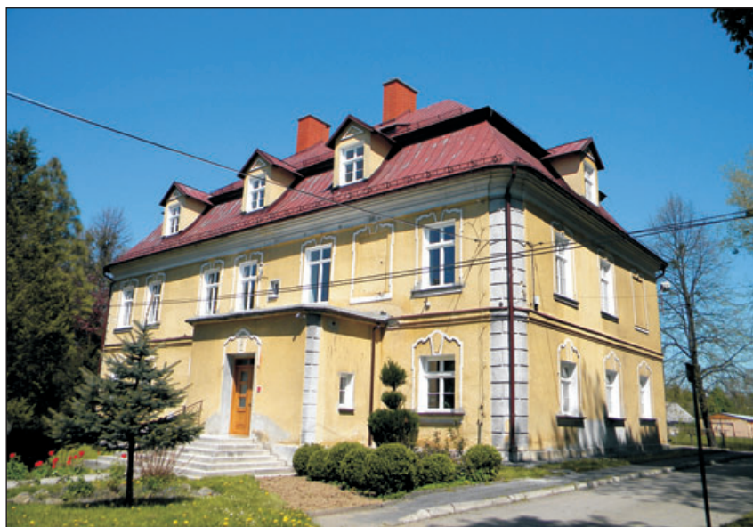
Dawny dworek Stonawskich, dzisiaj Powiatowy Dom Pomocy Społecznej w Pogórze.