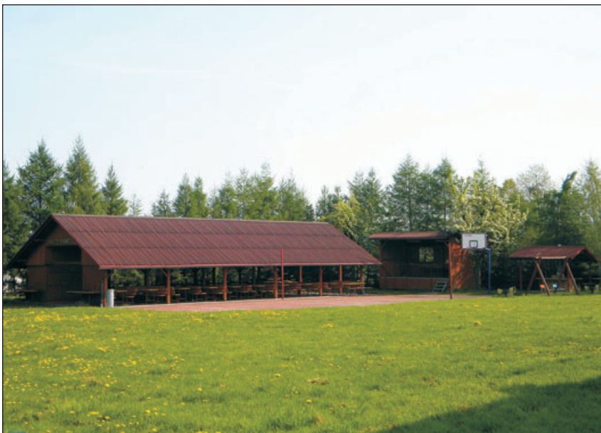
Wiata to miejsce gdzie odbywają się imprezy w sołectwie.