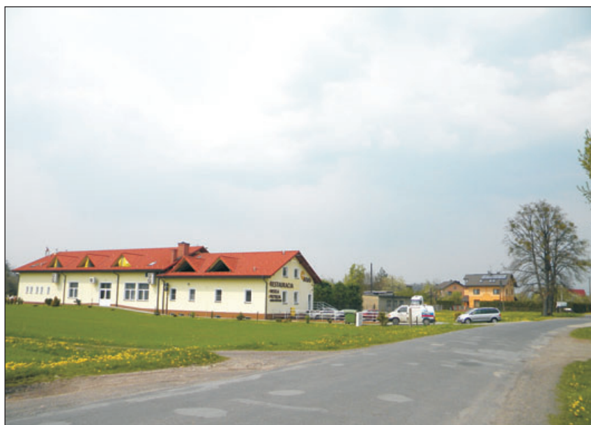
Restauracja w Harbutowicach.