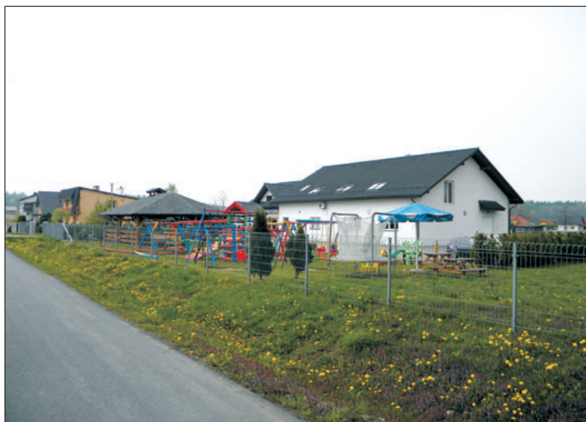
Restauracja w sołectwie.