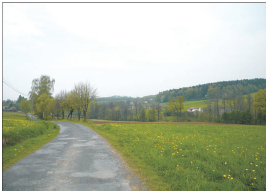
Jedna z dróg w sołectwie.