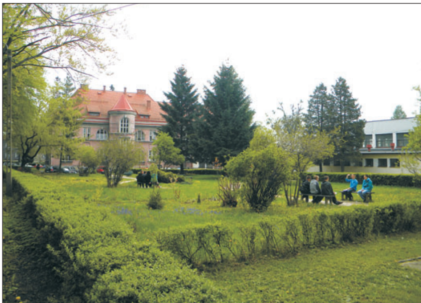
Zespół Szkół Rolniczych.