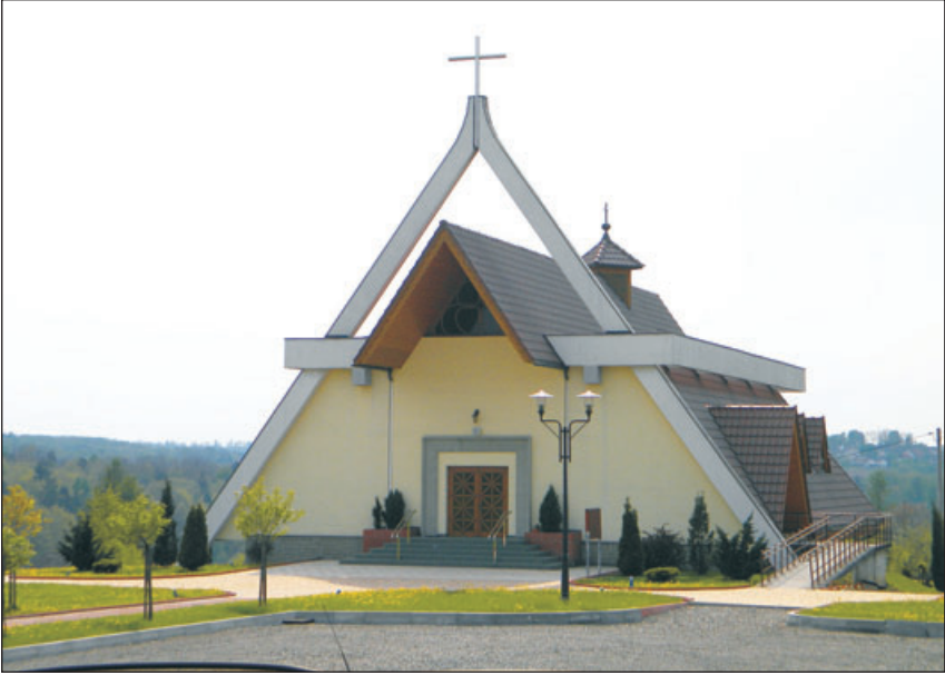
Kościół w Wiślicy.