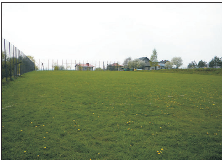
Boisko LKS Wiślica.