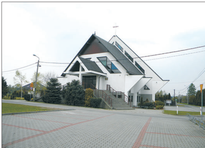
Kościół Ewangelicko-Augsburski Apostoła Pawła w Bładnicach.