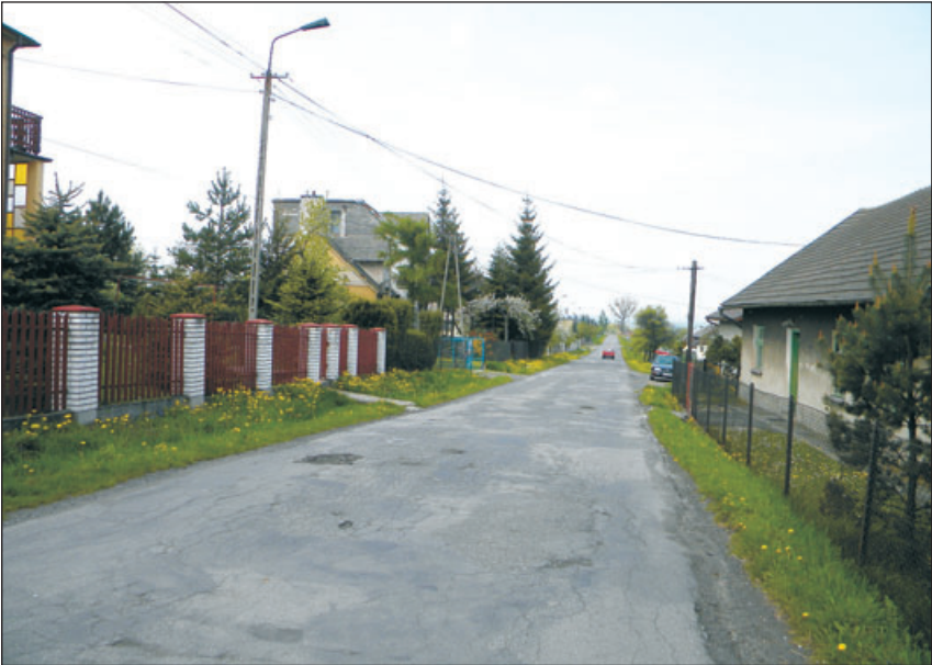
Droga przez wieś.