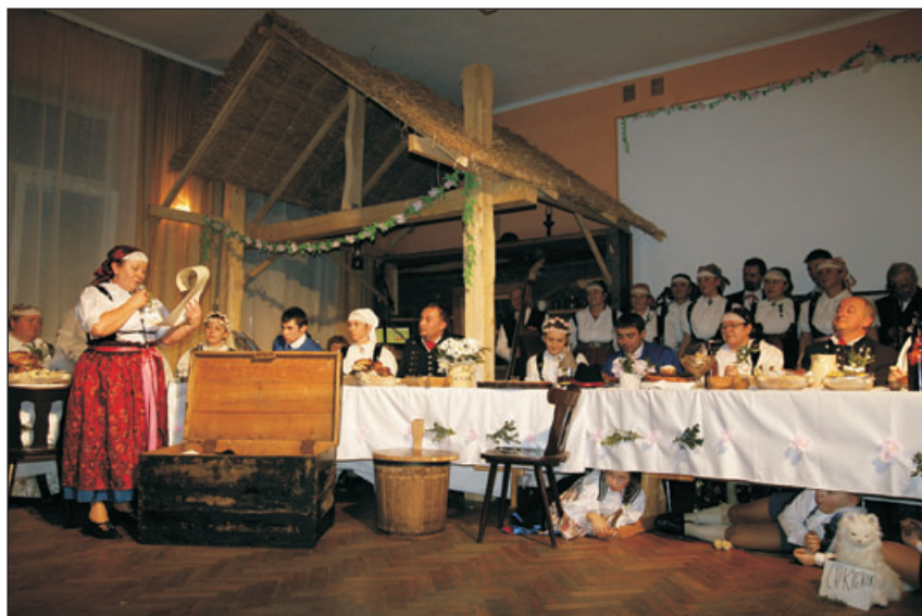
Dawne obrzędy weselne zaprezentowano w widowisku „Jak się starła z Ochob wydowali”.