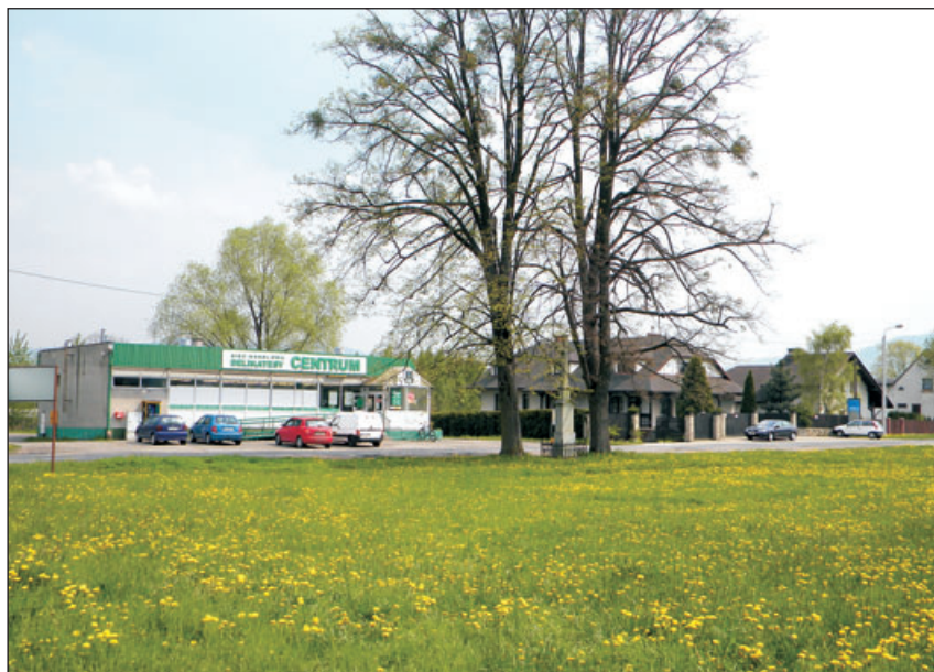
Sklep w centrum wsi.