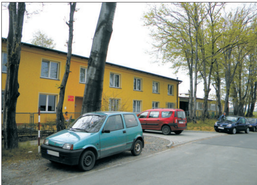
Dom Dziecka i przedszkole w Międzywiciu.