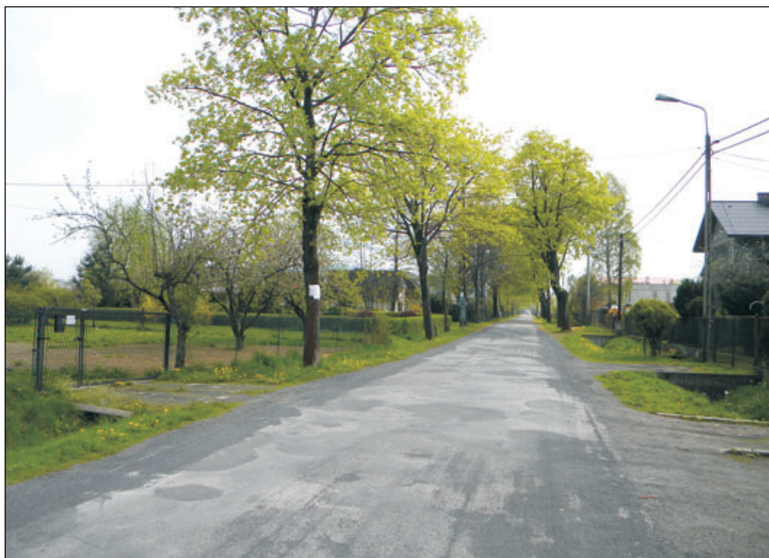
Jedna z dróg w sołectwie.

Do obiektów zabytkowych, w zdecydowanej większości należą budynki mieszkalne oraz gospodarcze. W ewidencji zespołów zabytkowych znajduje się również cmentarz ewangelicki założony w 1911 roku.